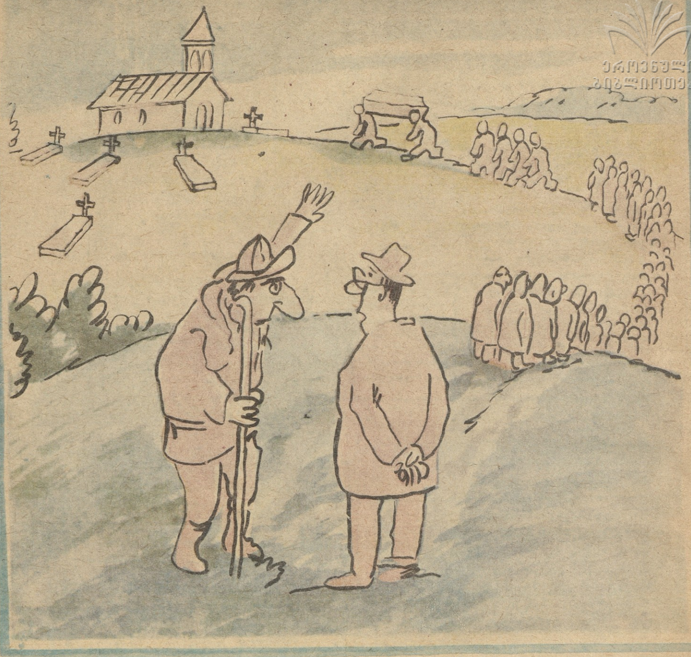
— ა, ბატონო, დავიწყეთ პრიუატიზაცია და ერთი თავ- გაპობილი უკვე მიგვყავს სასაფლაოზე შინის მიხედვად.