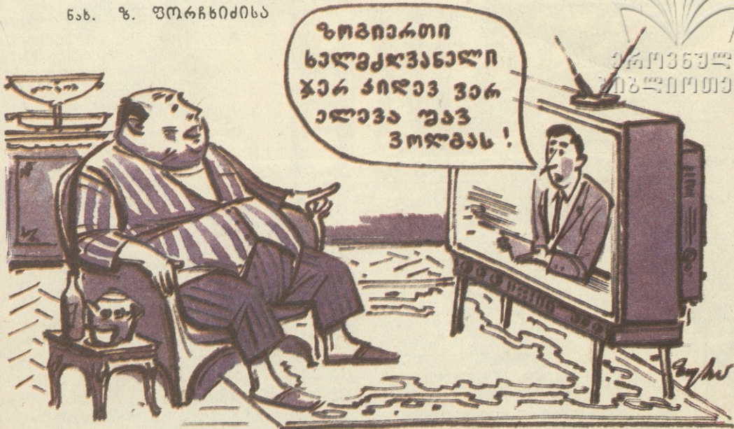
— მართლს ამბობს ეს კაცი: ხვლიდან მანქანა სხვა ფერად უნდა შევალევიწო!