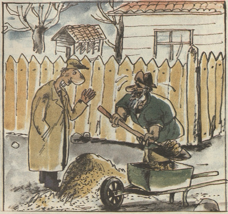
ნ.ბ. მ. აბაშიძისა