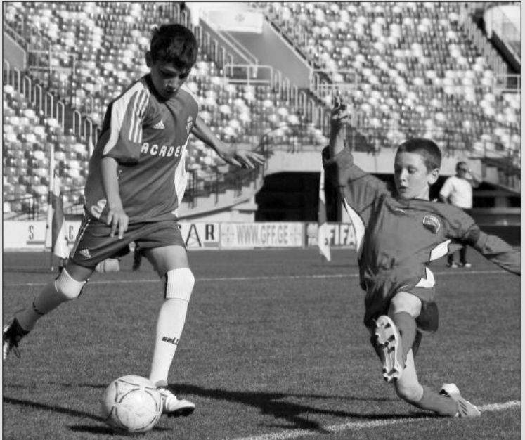
ასეთი ტურნირები სამომავლო ტენდენციების გასაანალიზებლად დიდ მასალას იძლევა