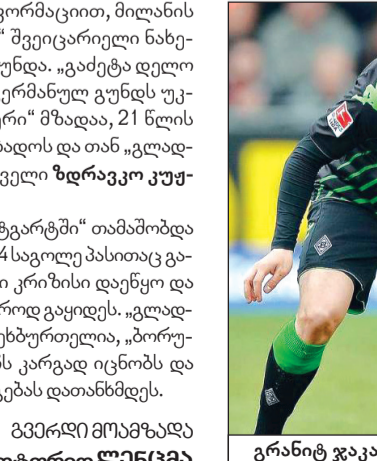
გრანიტ ჯაკა შეიძლება მილანის ინტერში აღმოჩნდეს

ცნობისათვის, კუშმანოვიჩი ადრე „შტუტგარტში“ თამაშობდა და ბუნდესლიგის 127 მატჩში 22 გოლი და 14 საგოლე პასითაც გამოირჩა, მაგრამ 2012/2013 წლების სეზონში კრიზისი დაეწყო და შტუტგარტელებმა იტალიაში 1.2 მილიონ ევროდ გაყიდეს. „გლადახისთვის“ ეს უკანასკნელი საინტერესო ფეხბურთელია, „ბორუსიას“ თავაკაც ლუსიენ ფავრი კუშმანოვიჩს კარგად იცნობს და დღეისათვის მანსი, რომ „გლადახში“ ამ გარიგებას დათანხმდეს.