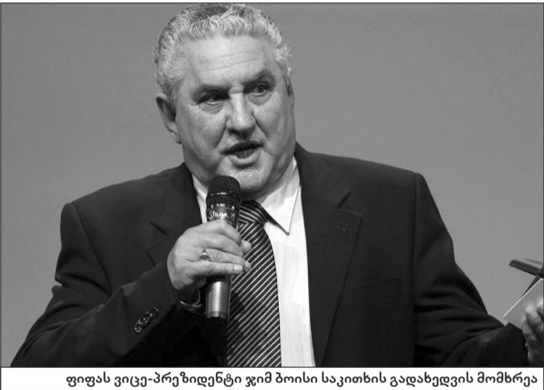
ფიფას ვიცე-პრეზიდენტი ჯიმ ბოისის საკითხის გადახედვის მომხრეა

„უკრაინაში შექმნილი მძიმე მდგომარეობა კიდევ დიდხანს გაგრძელდება მიუხედავად იმისა, რომ ქვეყანამ ახალი, ლეგიტიმური პრეზიდენტი აირჩია. ვლადიმირ პუტინი ამ ქვეყანაში ჰიტლერის სცენარით მოქმედებს და ნელ-ნელა ცდილობს ევროპასთან ტერიტორიულად დაახლოებას. ამას ალბათ ყველანი ვხვდებით. ჩვენ, ევროპასთან და ამერიკასთან ერთად, ყველანი უნდა გავერთიანდეთ ასეთი მზაკრული ვეგმების წინააღმდეგ. თუკი ასე არ მოვიქცევით, ის ჯერ ნახევარ უკრაინას დაიპყრობს, შემდეგ კი რუმინეთს, მოლდოვას, ბულგარეთსა და პოლონეთს მიადგება. რუსეთის ფაქტობრივი პოლიტიკა უზუშად არღვევს მსოფლიო ფეხბურთის მმართველი ორგანოს მიერ დეკლარირებულ პრინციპებს. მოგინდებთ, უარი თქვათ იმ კომპანიების მიერ ნარმოებული პროდუქციის შეძენაზე თუ მომსახურებაზე, რომლებიც 2018 წლის მსოფლიოს ჩემპიონატის სპონსორები არიან.“