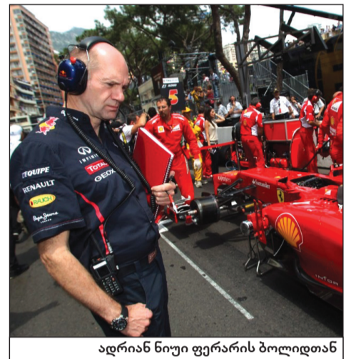
ედრიან ნიუი ფერარის ბოლიდთან

იტალიური საჯინიზო „ფერარი“ მზად არის „რედ ბულის“ მთავარ კონსტრუქტორს ედრიან ნიუსს ასტრონომიული ხელფასი - სეზონში 20 მილიონი ევრო გადაუხადოს. ეს იმ შემთხვევაში მოხდება, თუ ბრიტანელი სპეციალისტი „ფერარიში“ გადასვლას დათანხმდება, - იტყობინება „გაძედა დელო სპორტი“. აღვნიშნავთ, რომ მსოფლიოს ჩემპიონატში მონაწილე ბევრ პილოტს არ აქვს ასეთი ხელფასი.