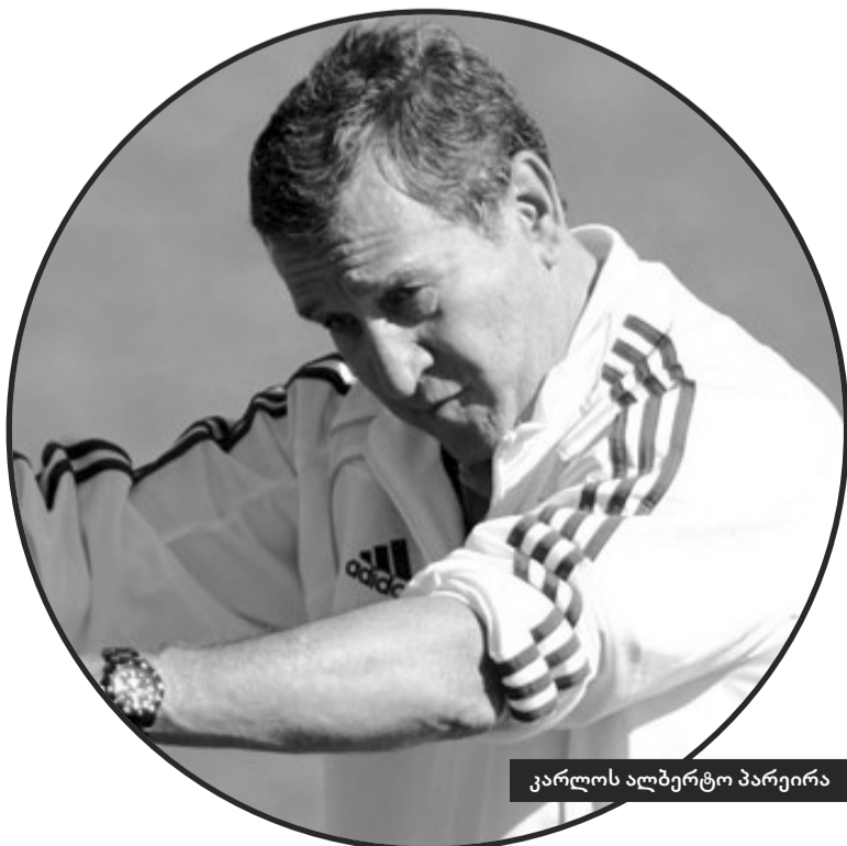
კარლოს ალბერტო პარეირა