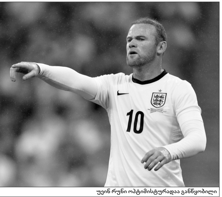
უეინ რუნი ოპტიმისტურადაა განწყობილი