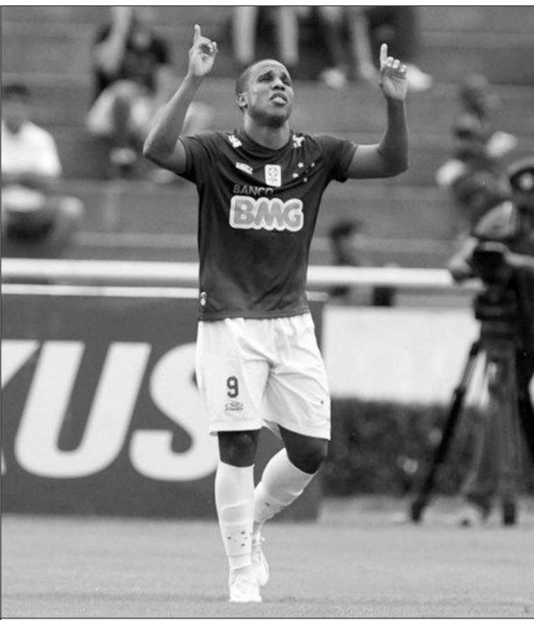
„კრუზეირო“, ბორუსი გოლს ზეიმობს