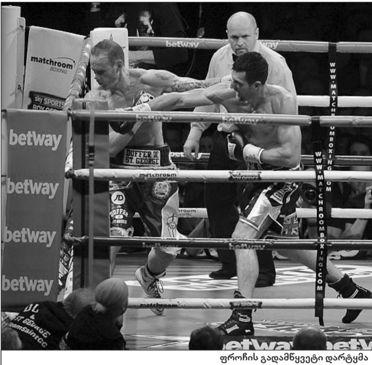
ფროჩის გამაწყვეტი დარტყმა