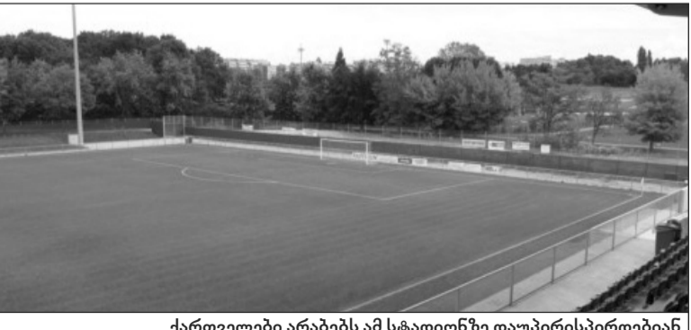
ქართველები არაბებს ამ სტადიონზე დაუპირისპირდებიან