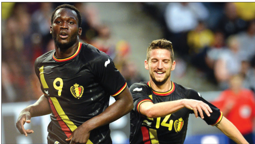
რომელსაც ლუკაკუ (მარცხნივ) ბრწყინვალე ფორმაშია