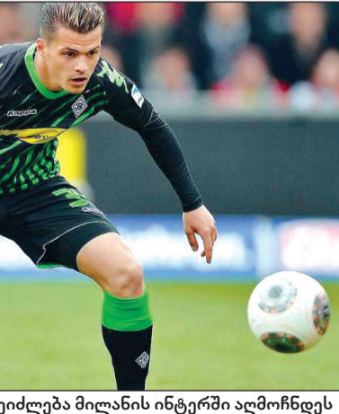
კუშმანოვიჩი კარგად იცნობს ლუსიენ ფავრი