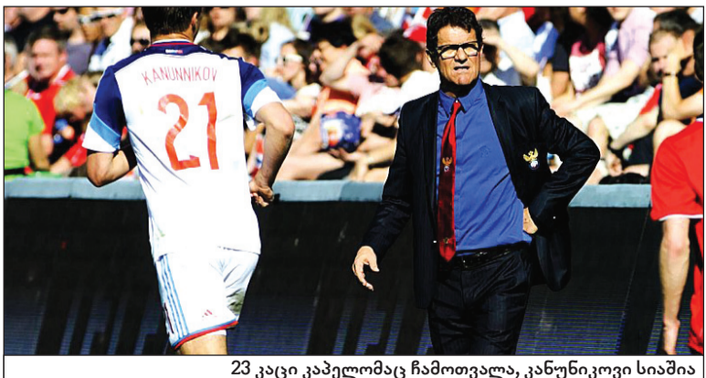
23 კაცი კაპელომაც ჩამოთვალა, კანუნიკოვი სიაშია

თავდასხმელები: ალექსეი იონოვი, მაკსიმ კანუნიკოვი, ალექსანდრ კერჟაკოვი, ალექსანდრ კოკორინი.