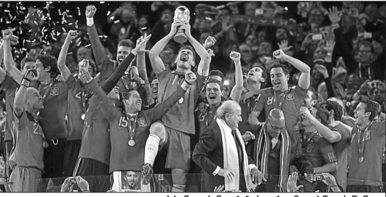
ესპანეთის ნაკრების ტრიუმფი 4 წლის წინათ