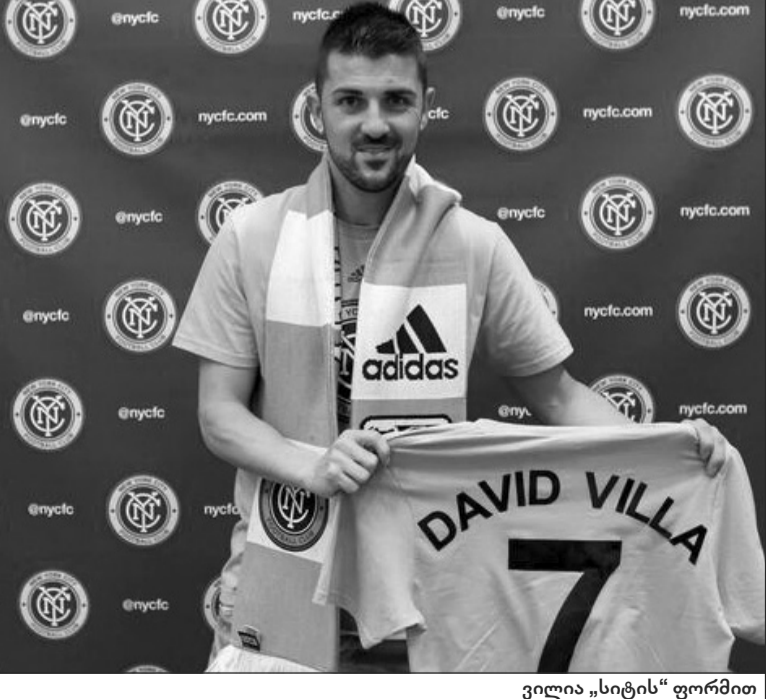
ვილია „სიტის“ ფორმით