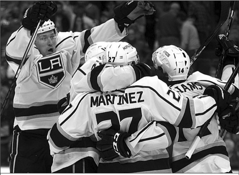
კინგზი ფინალში გასვლას ზეიმობს