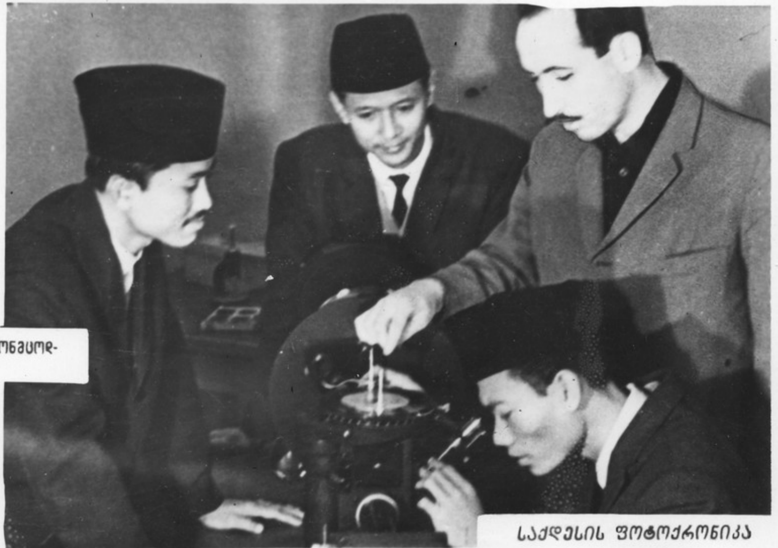
ინფორმაციური სპეციალისტები დითონსუმონის ღაბოკაშორიანში