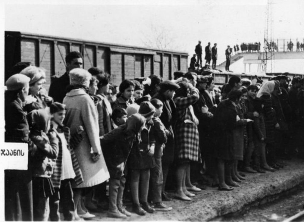
პირკვილი ელქტრომავთავი მოვირკ ბკკკკკის სარგკკვი.