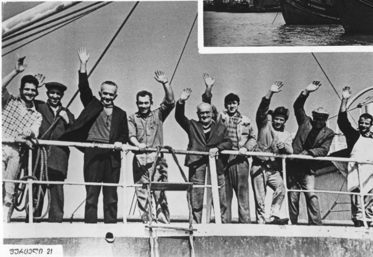
თუჩაქეთის სავიკიბუკი ბათუმის ნავსარ- ბუკი.

საქართველოს სოციალისტური რევოლუციის ღირსშესანიშნაობა