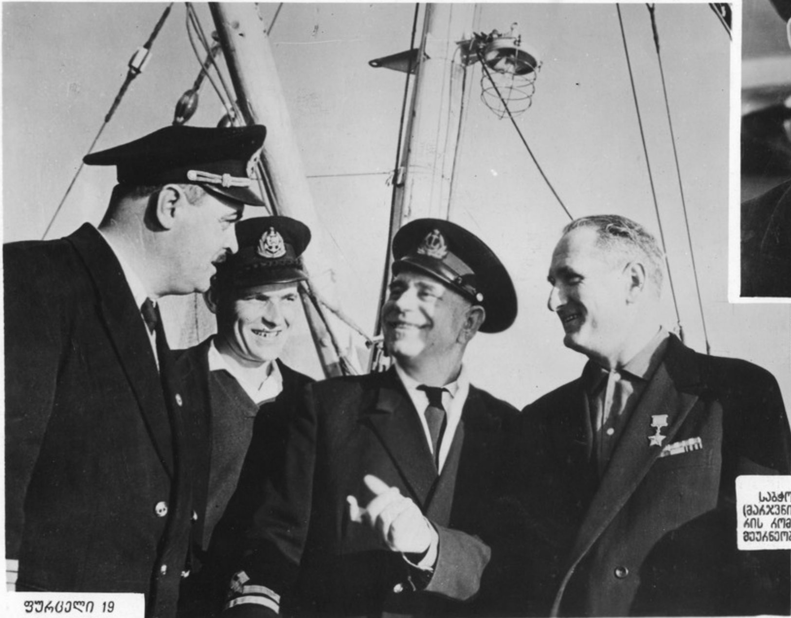
სავკომუნის ვიკაველი ხადხისხის. წითელი ვადსკვადვიის მოდენებინსა და უავშანი მდელის კავადიკი შიგე ზოდვადგე, იგი ახდა აქიკაკავ-კანსიის კინიგზის მოშინავვა მშენებანა-ინს-კავჭოკიკა.