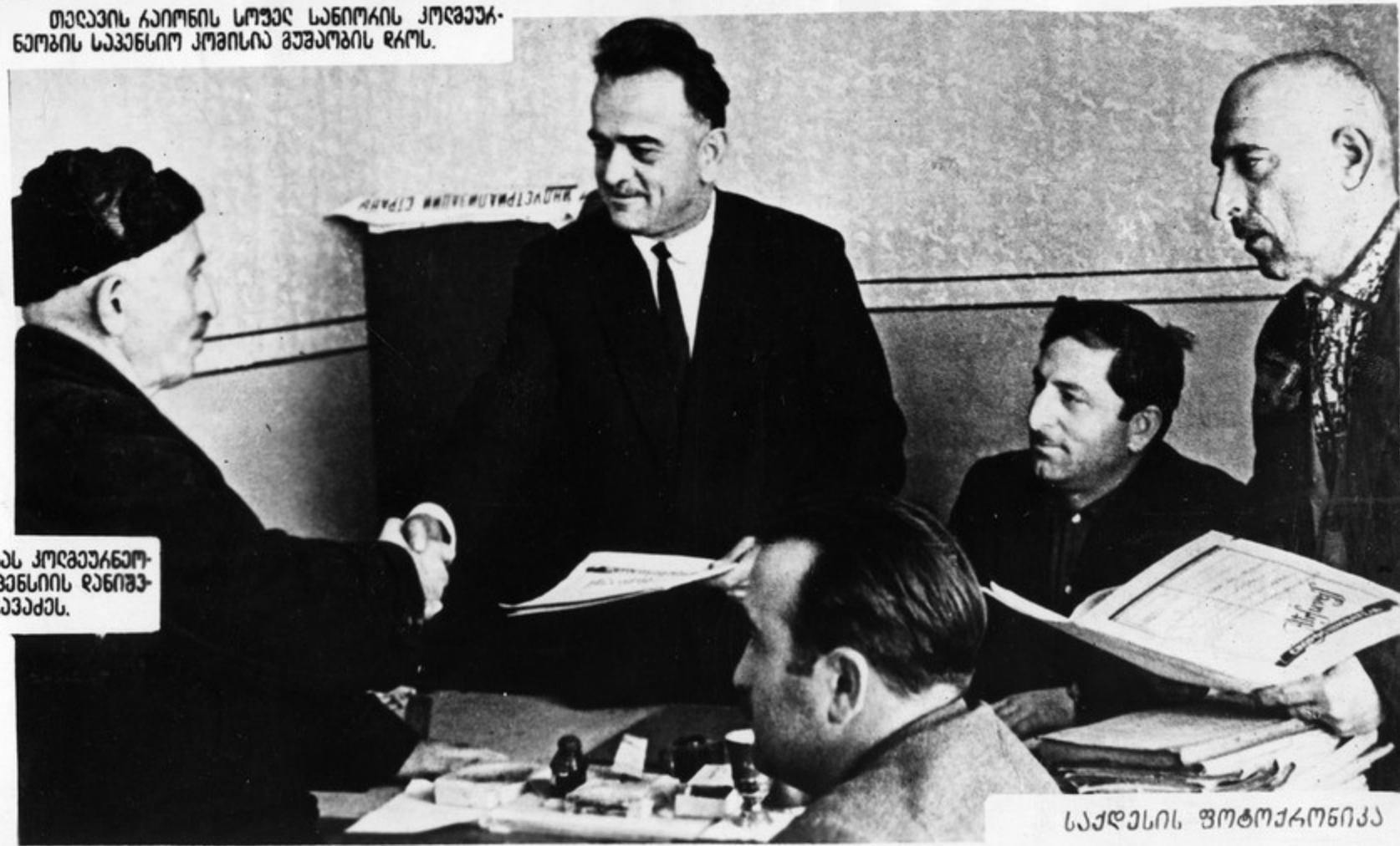
გათმობის აბოთის სოფელ ანგისას კომბაუკნომ- ბის საკანსიომ კომისიის მუშაობის პენსიის დანიშნუ- ნის აღმუშავება 70 დღის კუსიის დიჯანებას.