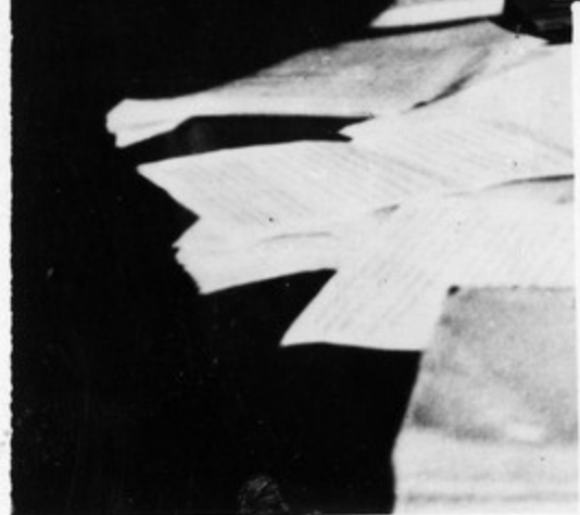
თბილისის აბოთის სოფელ სახელმწიფო კომბაუკ- ნომის საკანსიომ კომისიის მუშაობის დროს.

დიდ სიხარულს განიხილავს სოფლის მშრომლები. პაკვი- ნსა და მთავრობის გადაწყვეტი- ლებით სკომბაუკნომ სოფლის დასახელებად აღიარებებს ენიშნებათ პენსიონატი.