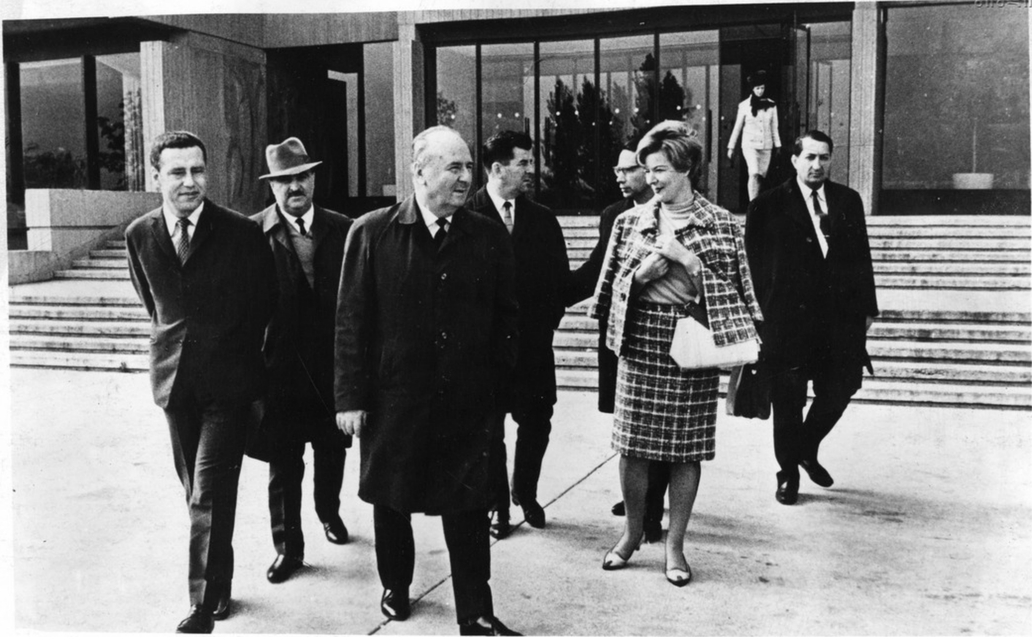
საქართველოს სსრ დელეგაცია მიემართება გაომუენის გენერალური კომისიის ბავონ რიუპუის მიერ გაგეათულ და- ბავონგაზე.