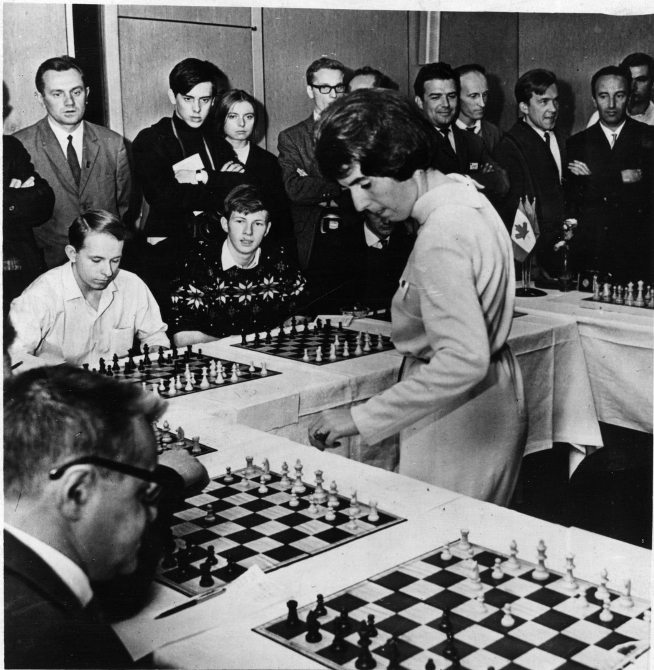
მსოფლიო ჩემპიონი ჭარბაკუი ნონა გაუჩინრაუზილი 20 რაუზზე ატორაოული თაგაუის სეანს მათაუვს