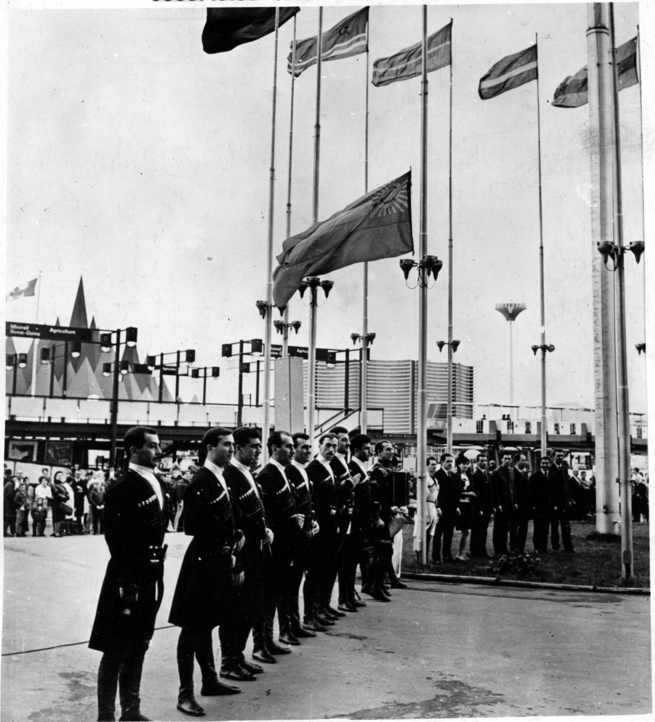
საქართველოს ეროვნული დროშის აღმართვა