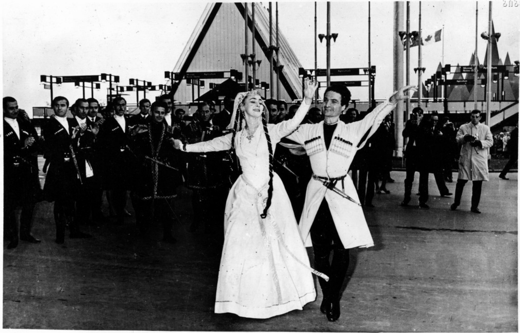
საქართველოს დღის გახსნა. კონცერტი. ტაქვავეს და დვადი და ვახაგანს გუნდები.