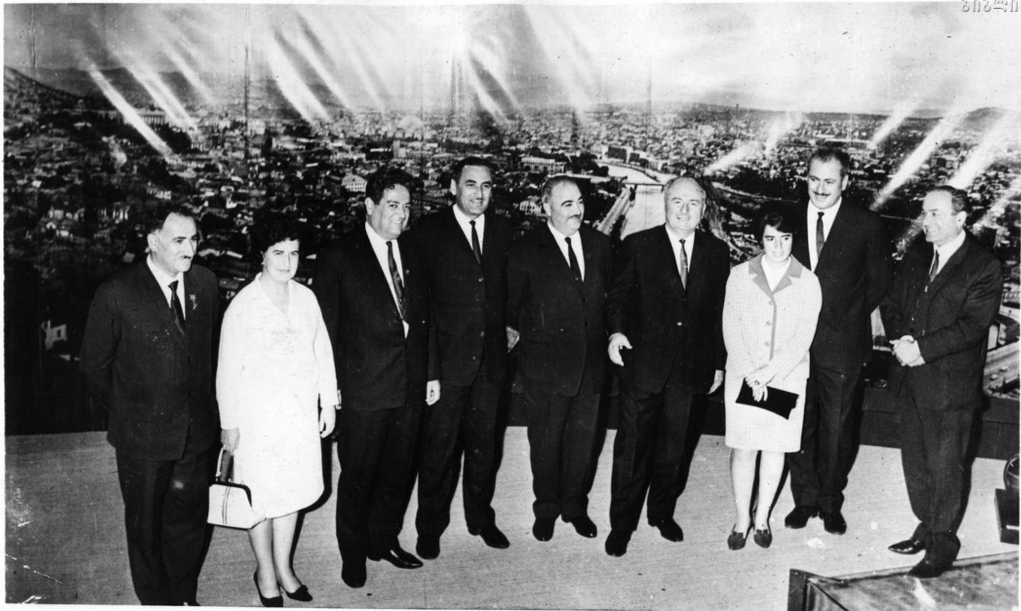
საქართველოს სსრ დელეგაცია თბილისის შუაღვალის პანორამასთან საგზოთა კავშირის კავშირდონში