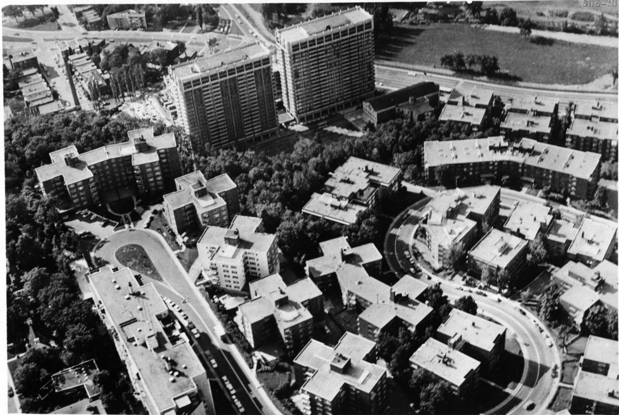
აღიშვამიანი იმედიანი აბონის ხედი მთა მონე-როქზე.