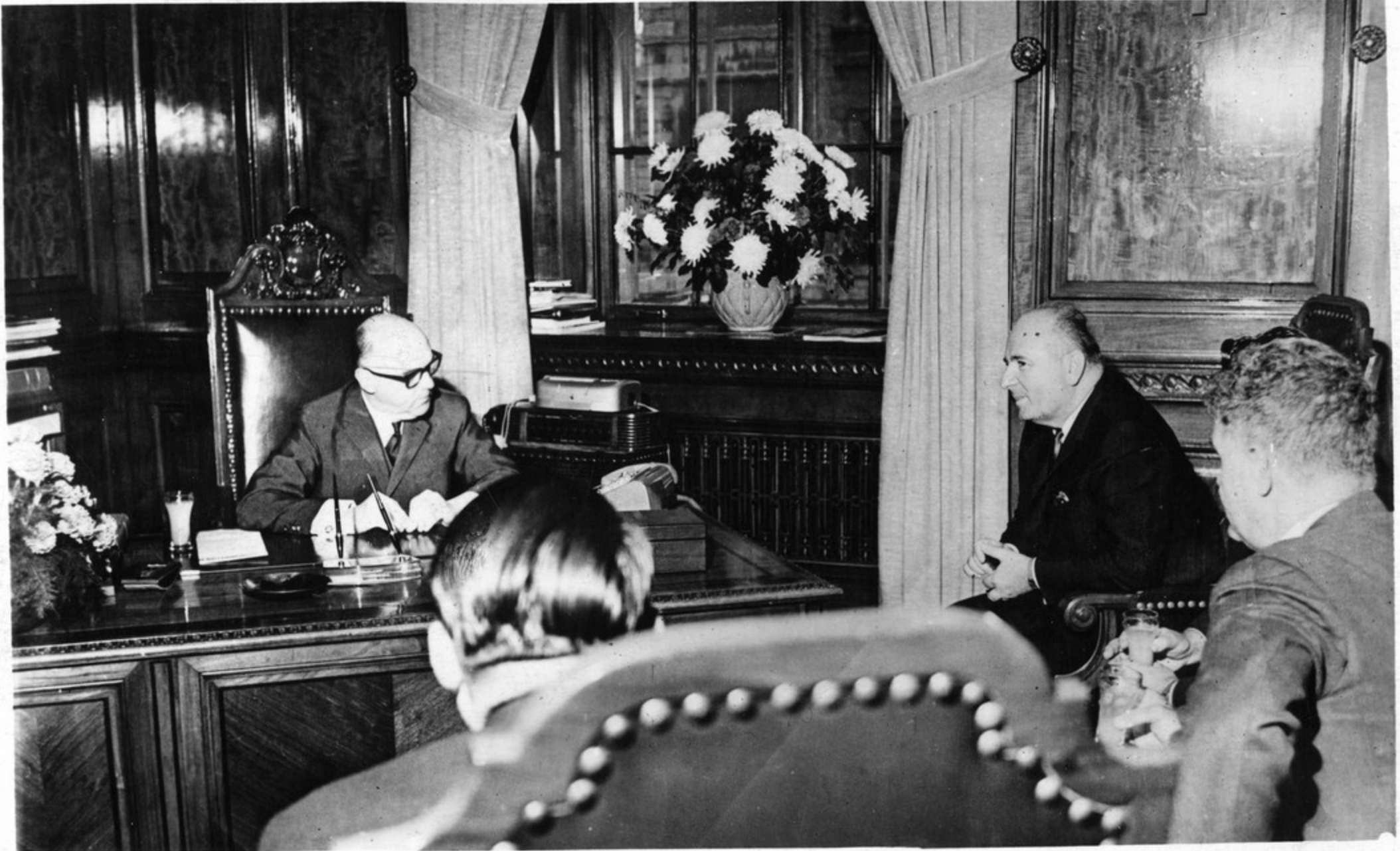
ქალაქ მონრეალის პეი ბავონ რეპოსტან