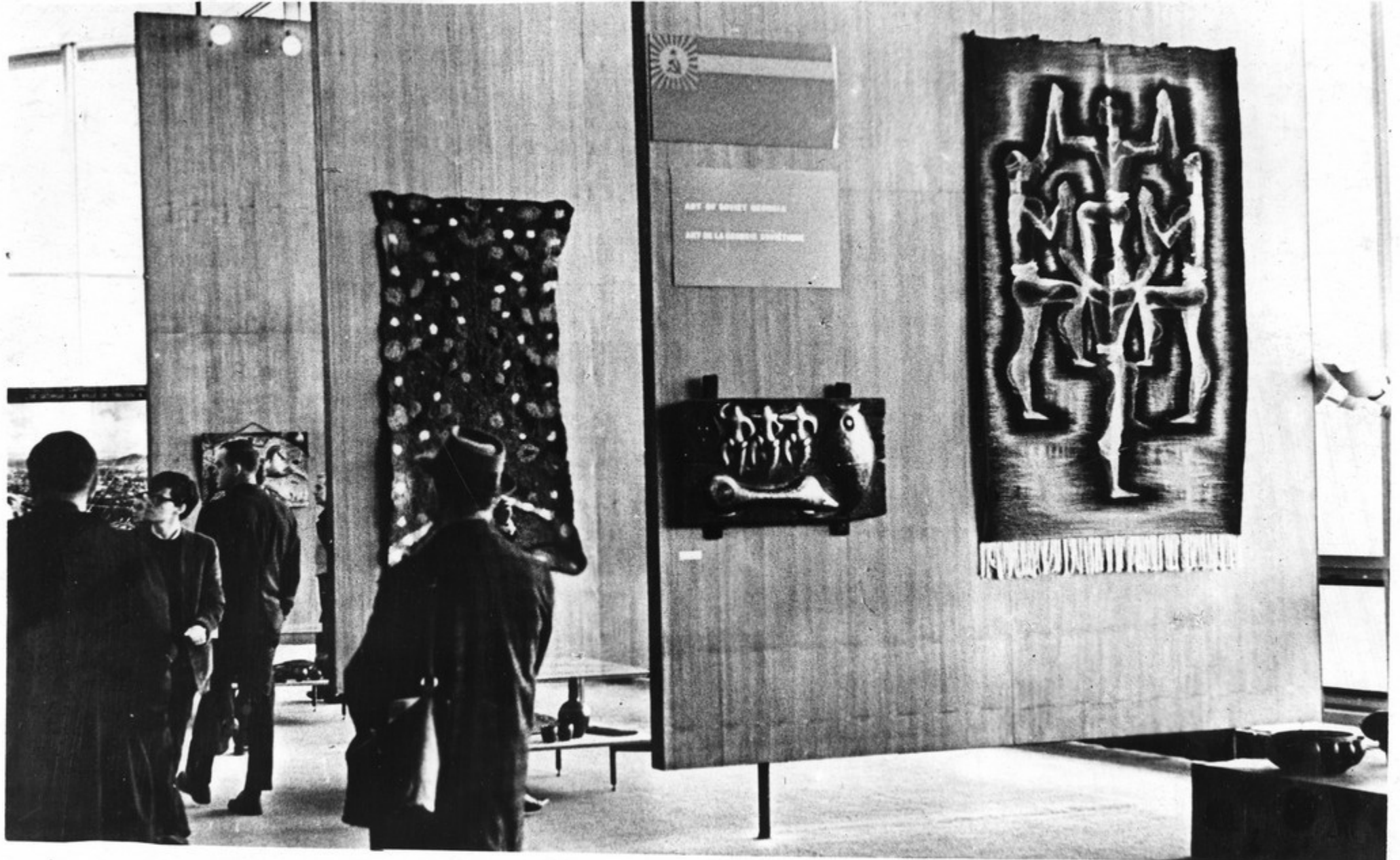
განყოფილება—„საქართველოს კულტურა“ საბჭოთა კავშირის კავშირში