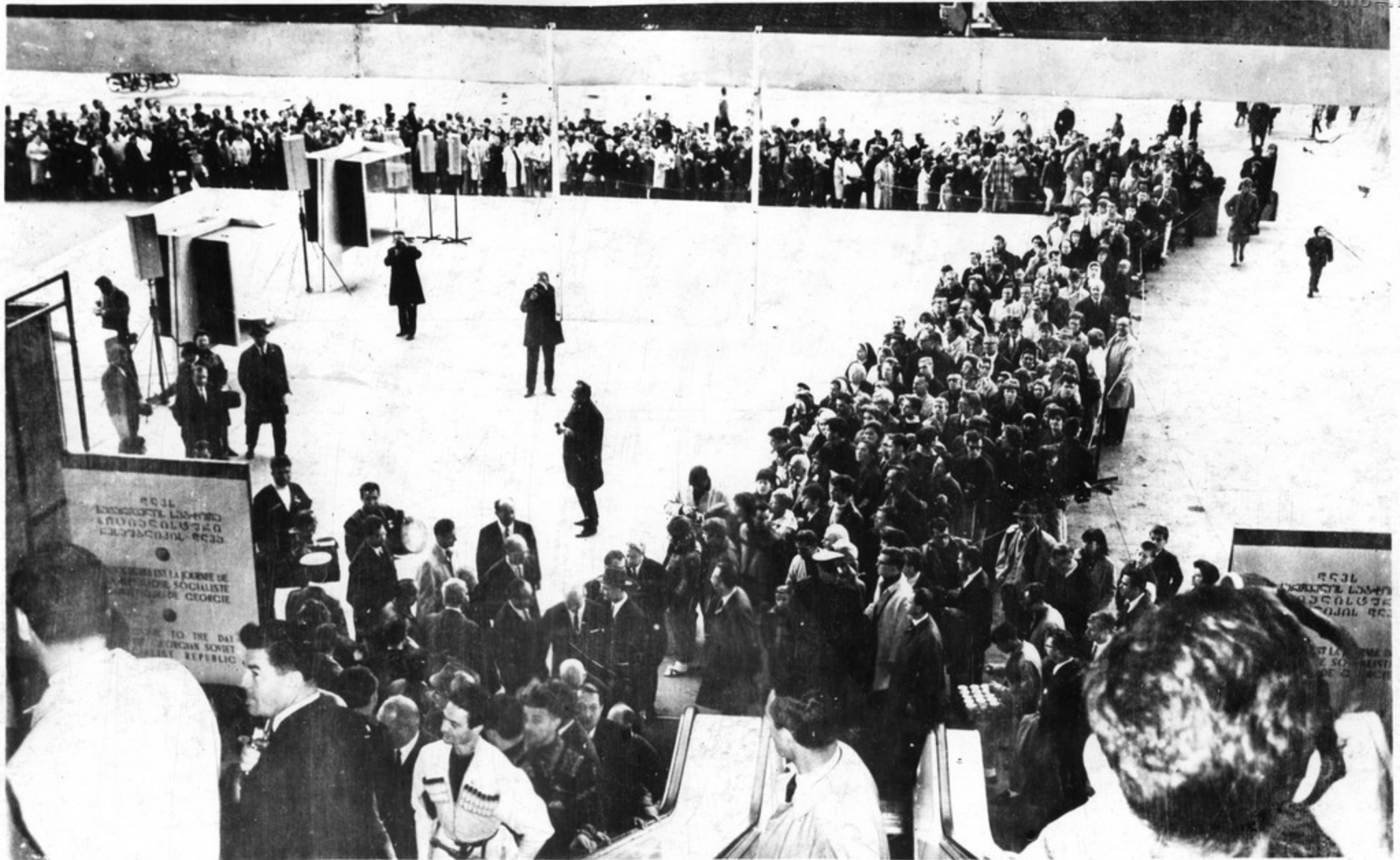
მნახველები, რომელთაც საბჭოთა პავილიონში მოხვედრა სუკით