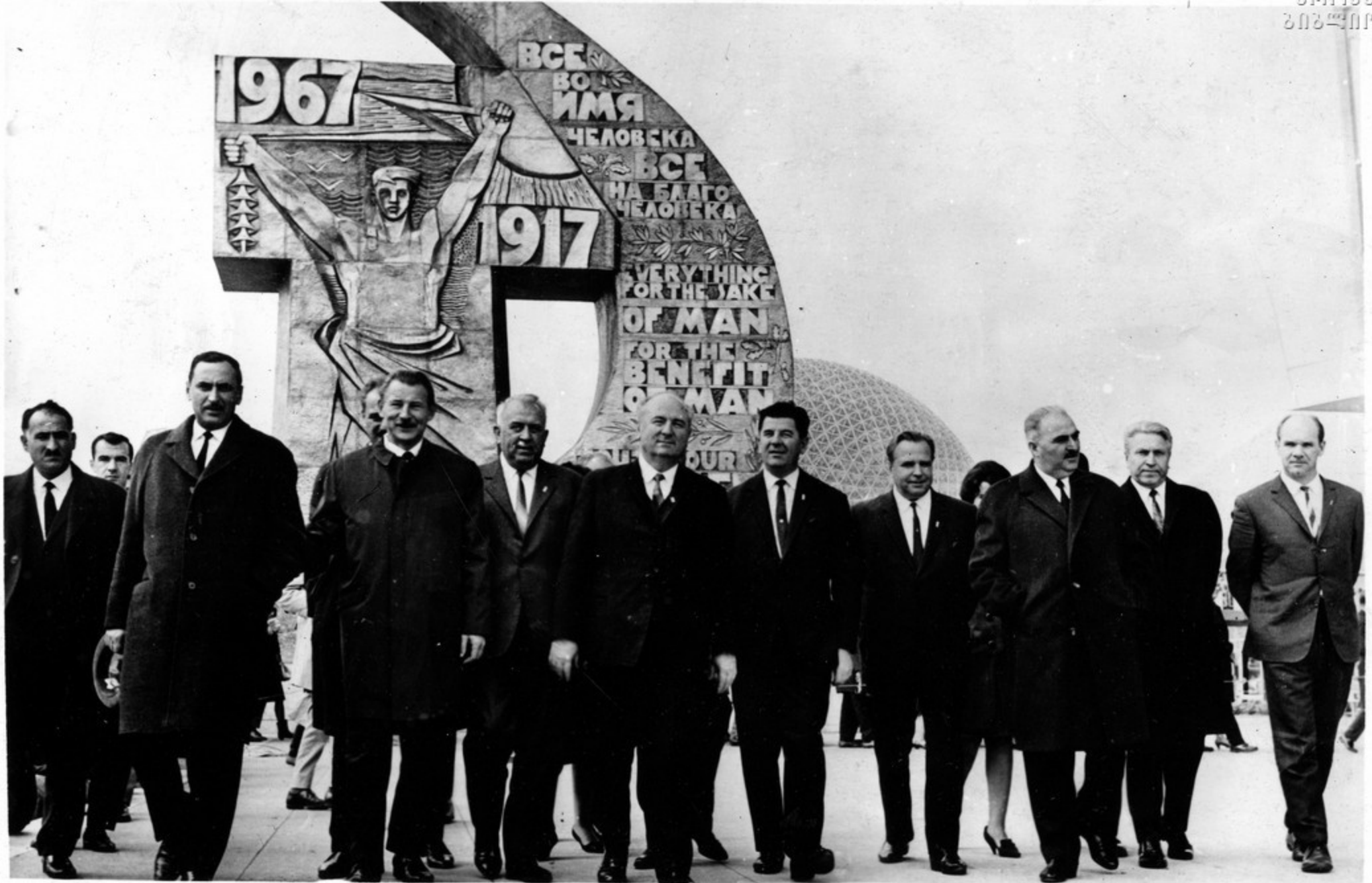
საქართველოს სსრ დელეგაცია საგჭოთა კავშირის კავშირობთან.