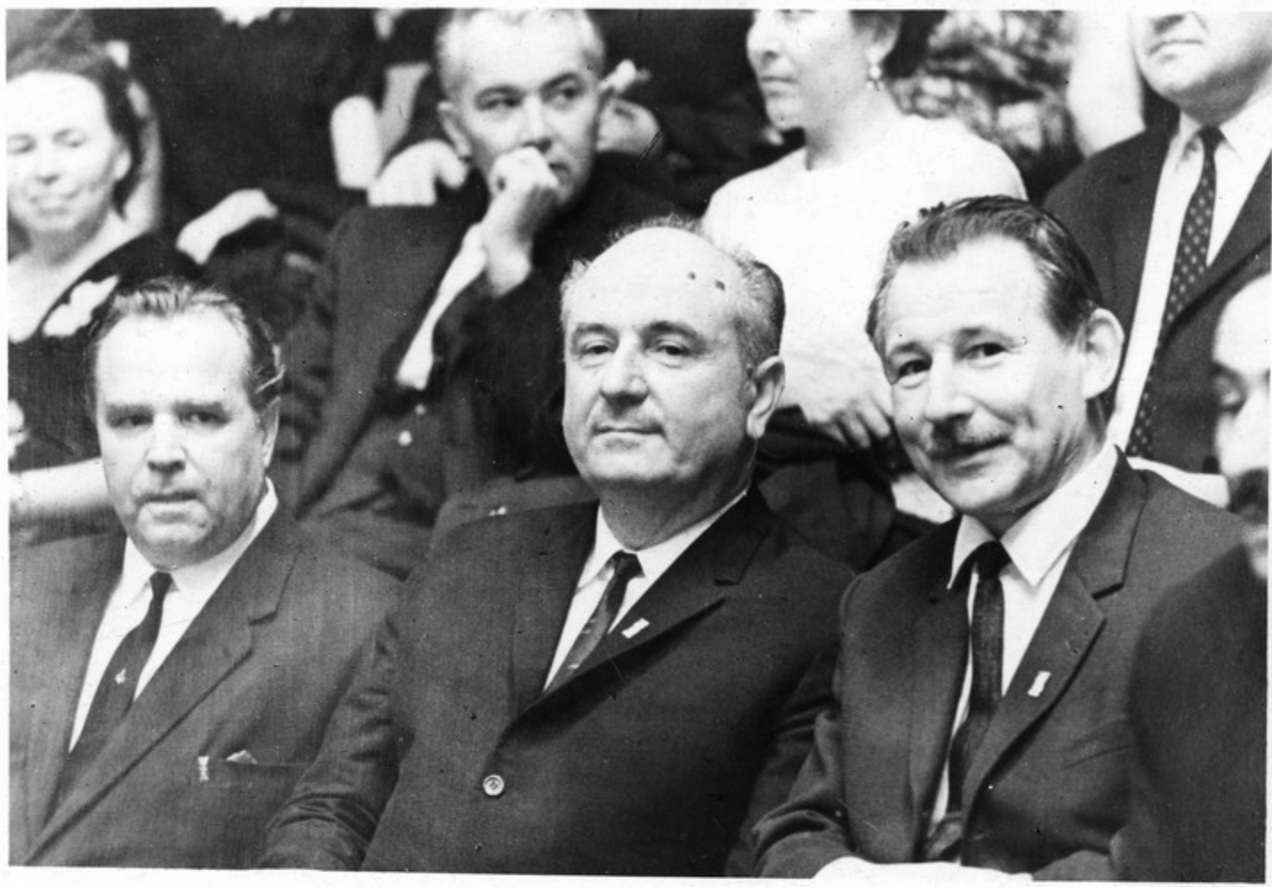
საქართველოს ხელოვნების ოსვავთა კონსერვზა