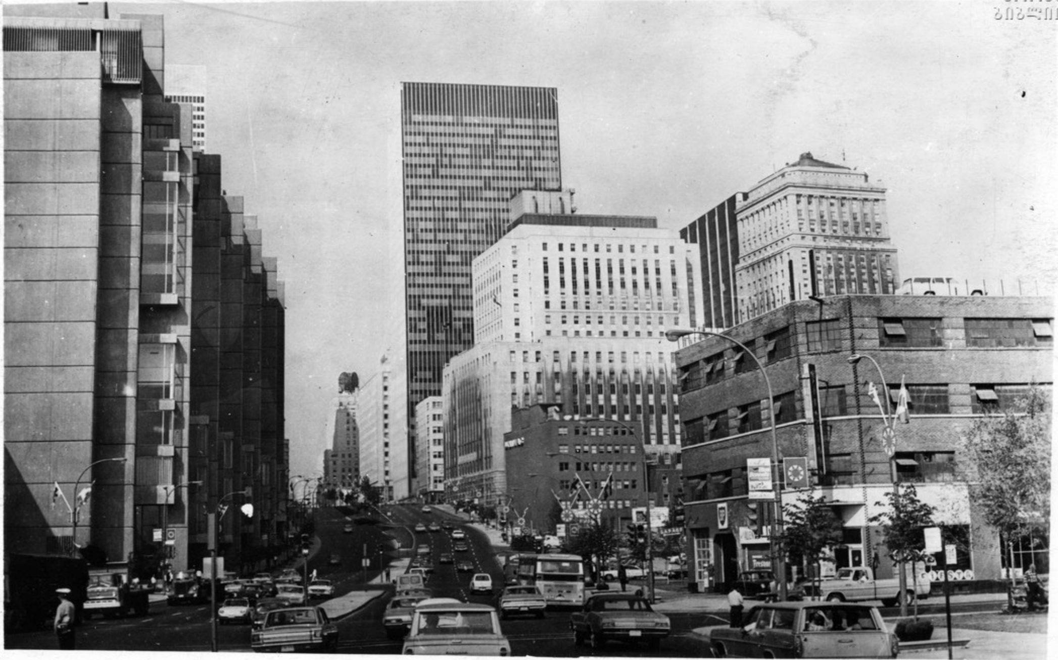
მონაკის ქუჩის ხეივანი ქუჩა