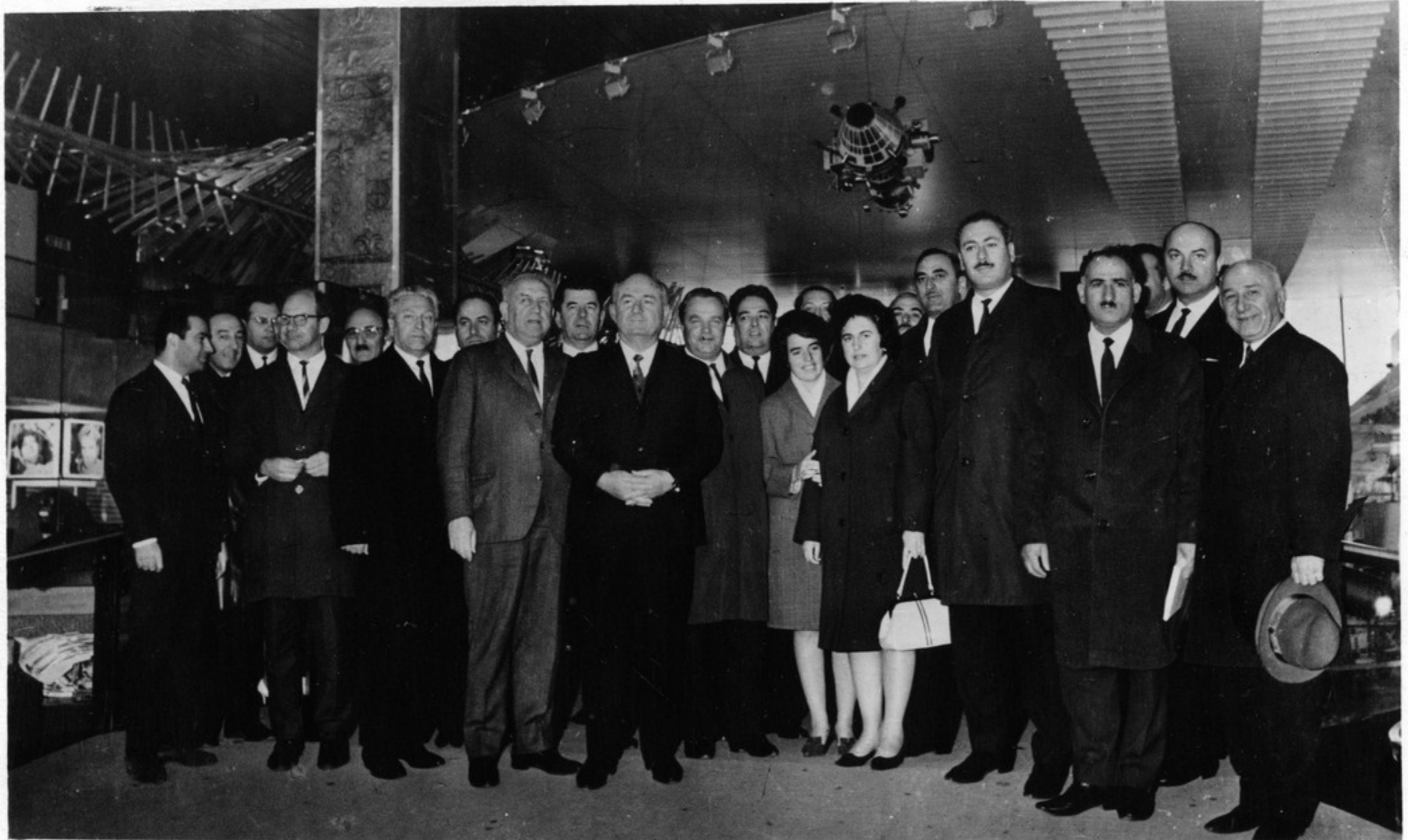
საქართველოს სსრ დელეგაცია საერთაშორისო კავშირის კავშირობები