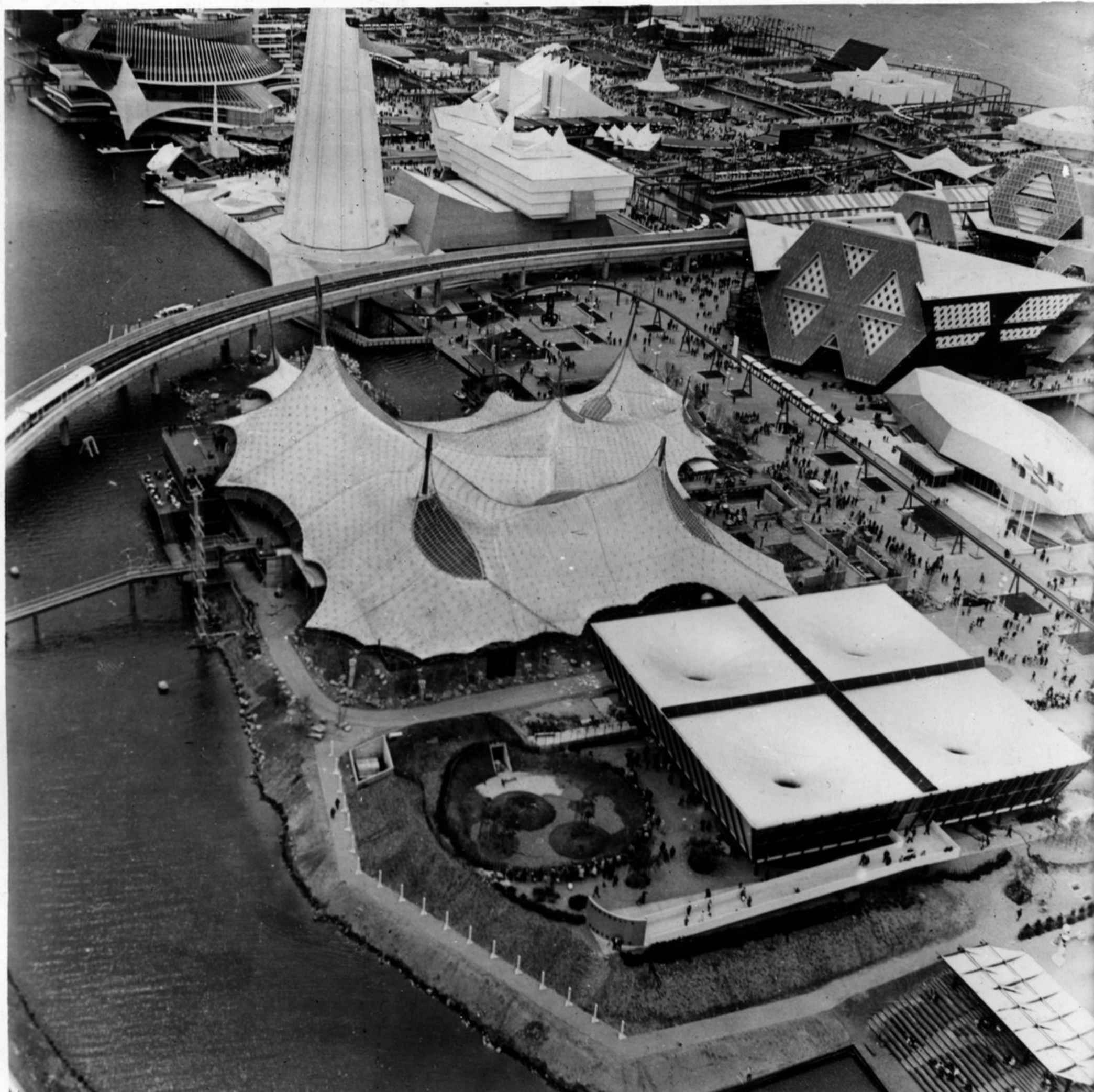
გამოფენა „ექსპო-67“-ის საქათო ხალი.