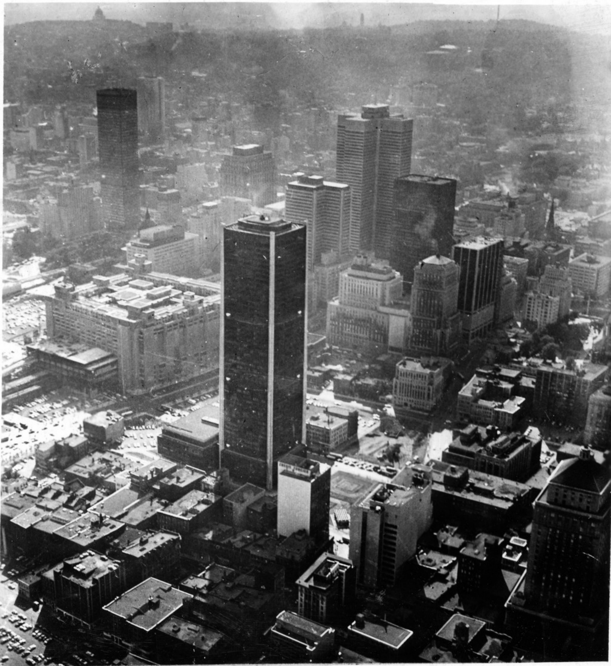
ქალაქ მოწაბაძის ხედი