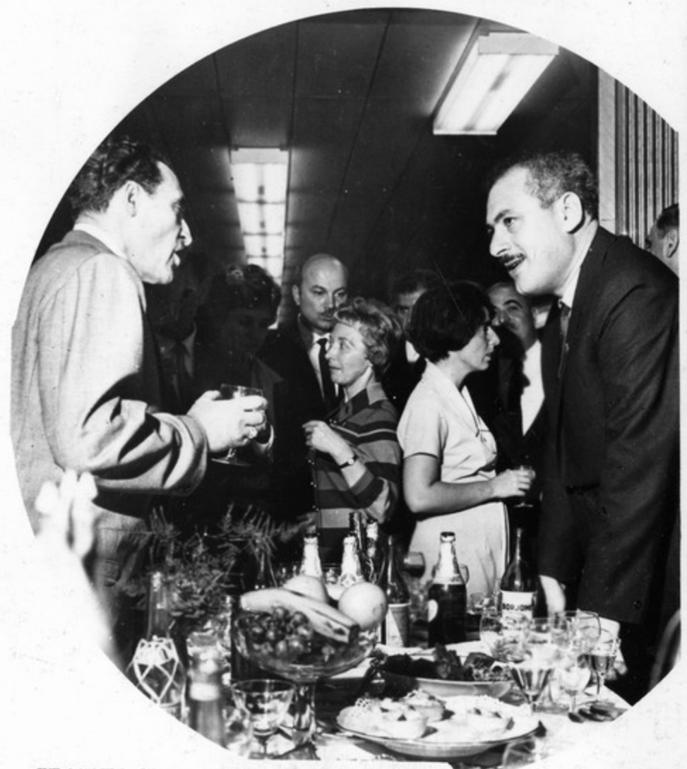
ფურცელი 23 საქანის ფოტოარონიკა

საქართველოს დელეგაციის სპეციალურმა გაგებითი დარგებობა საჭიროთა პეპიდრონი.