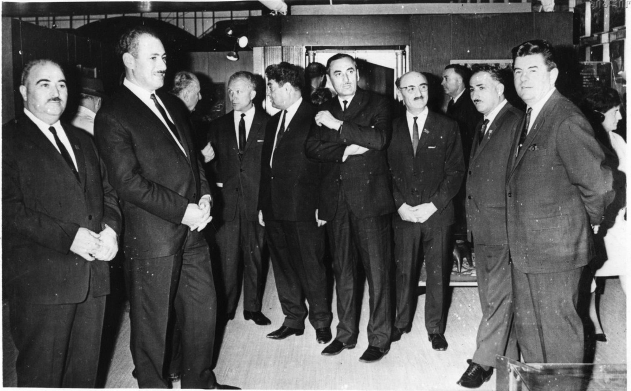
საქართველოს სსრ დელეგაცია ექსპოზიციის დათვალიერების შედეგად