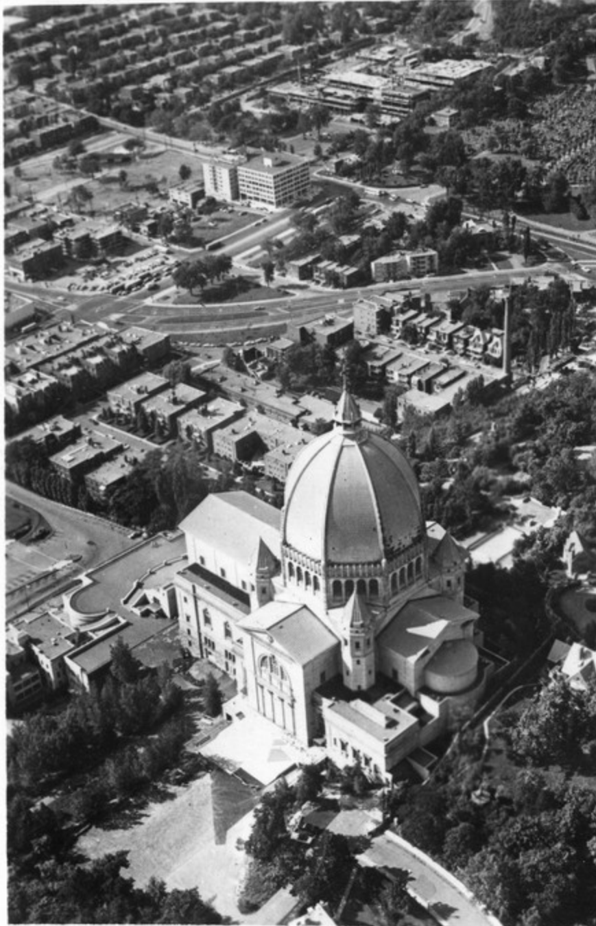
ნაინრა ჯოზაუზის ზაქაი მონაკააღუი.