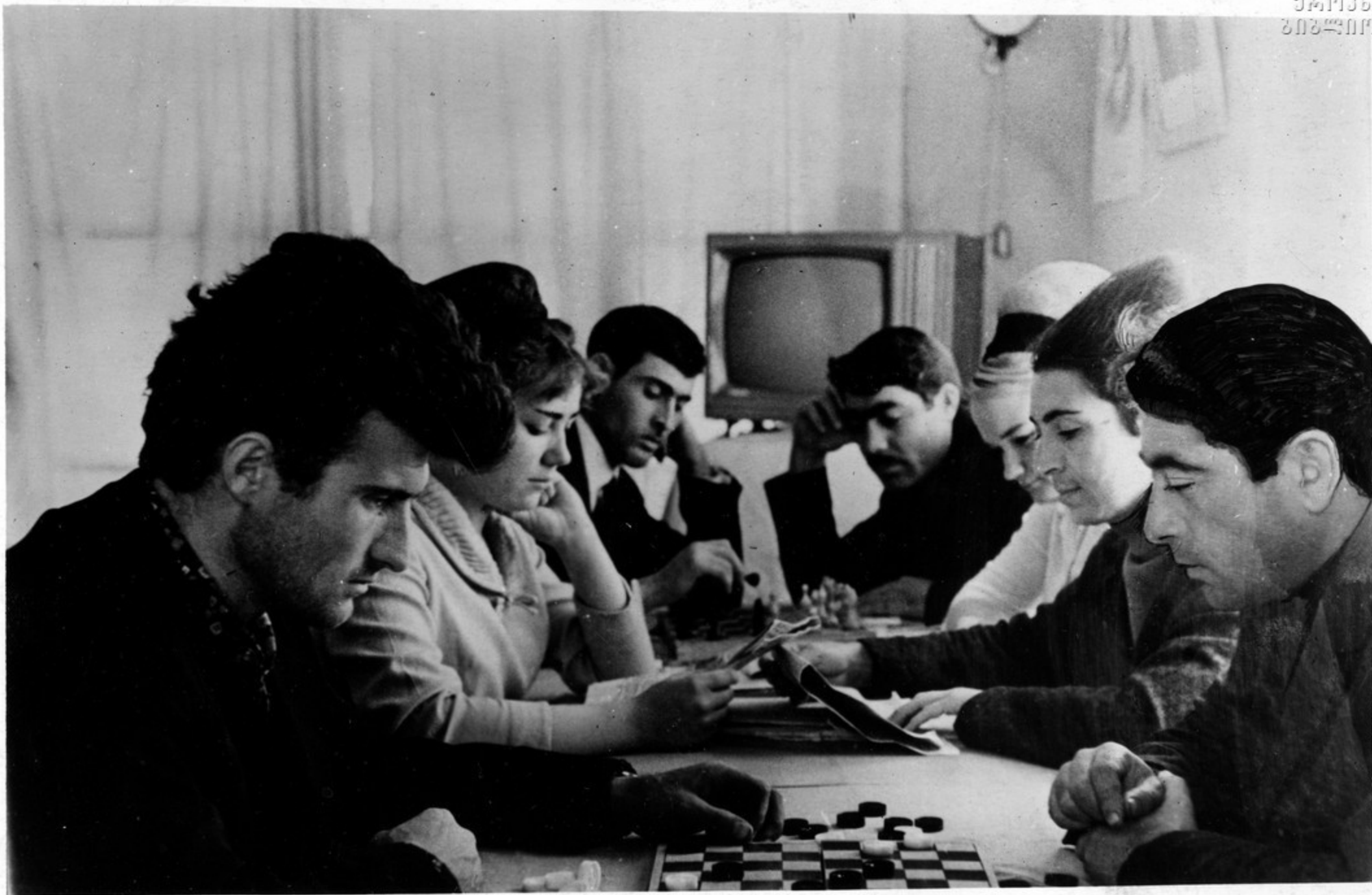
Грузинские строители в часы досуга в красном уголке