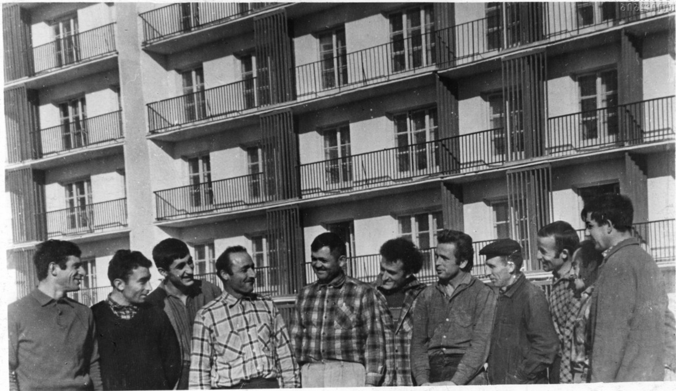
Комплексная бригада строителей из Грузии