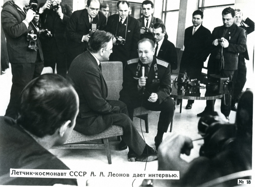
Летчик-космонавт СССР А. А. Леонов дает интервью.