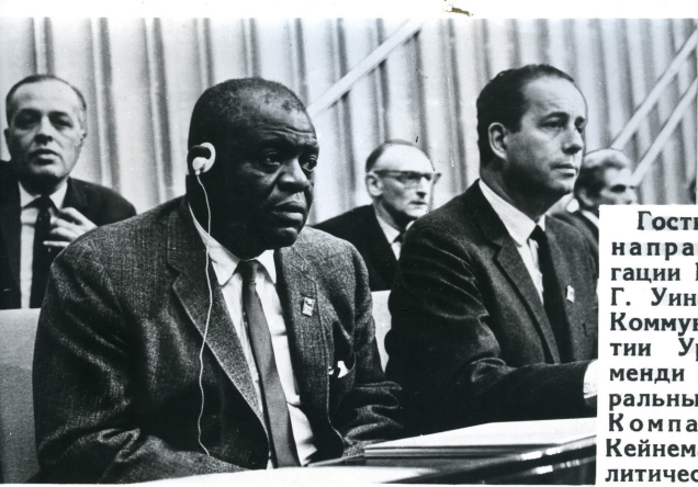
Гости съезда. Слева направо — глава делегации Компартии США Г. Уинстон, член ЦК Коммунистической партии Уругвая Р. Арисменди (1-й ряд), Генеральный секретарь ЦК Компартии Цейлона Кейнеман и член Политического Комитета Исполкома Компартии Великобритании Д. Уоддис.