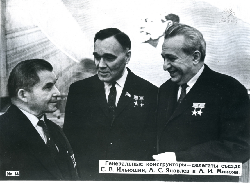
Генеральные конструкторы—делегаты съезда С. В. Ильюшин, А. С. Яковлев и А. И. Микоян.