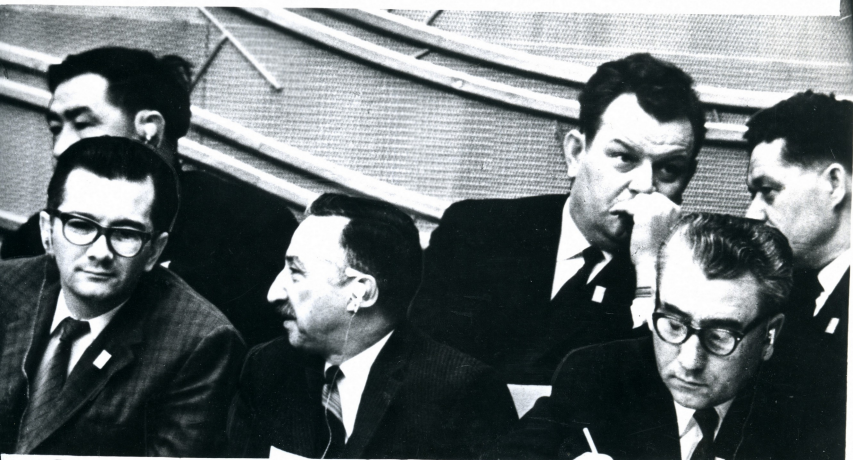
В президиуме съезда (слева направо) член Политбюро ЦК Компартии Кубы, секретарь ЦК Компартии Кубы А. Харт Давалос, генеральный секретарь Компартии Чили Л. Корвелан, член Исполкома ЦК СКЮ, секретарь ЦК СКЮ, вице-президент Социалистической Федеративной Республики Югославии А. Ранкович.