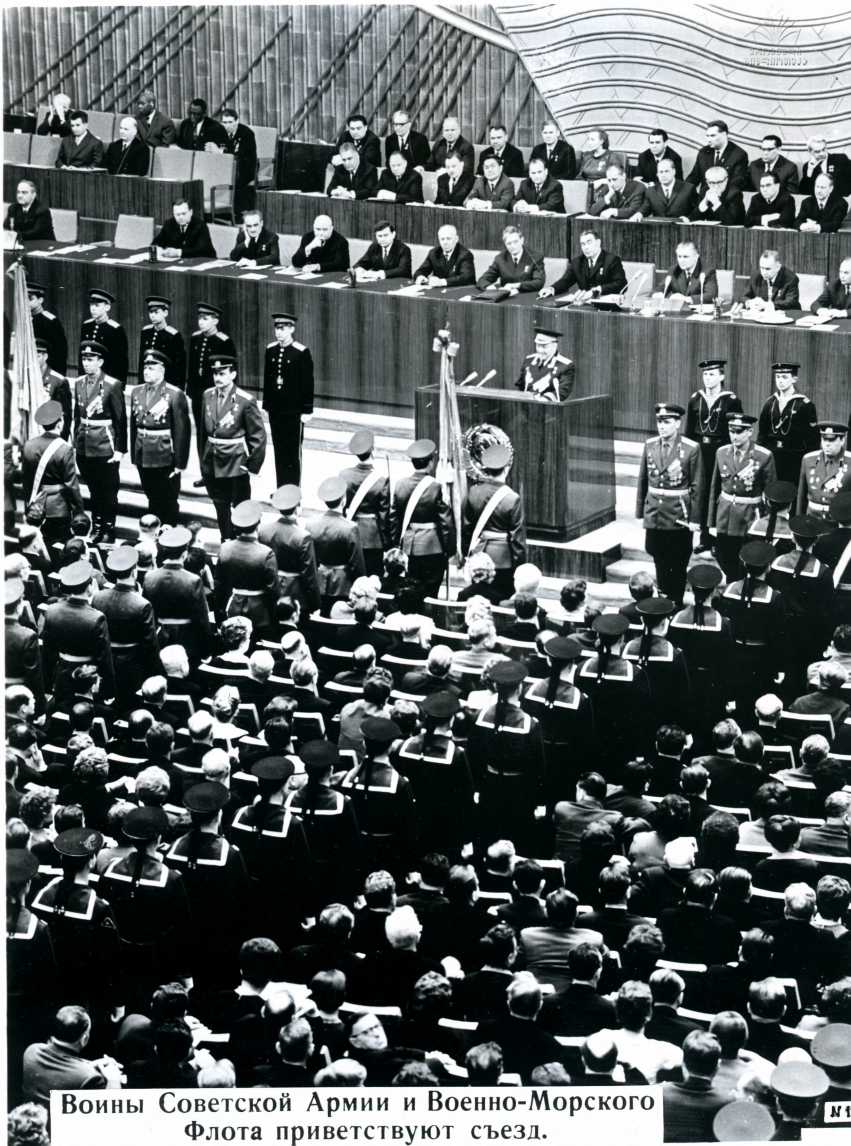
Воины Советской Армии и Военно-Морского Флота приветствуют съезд.