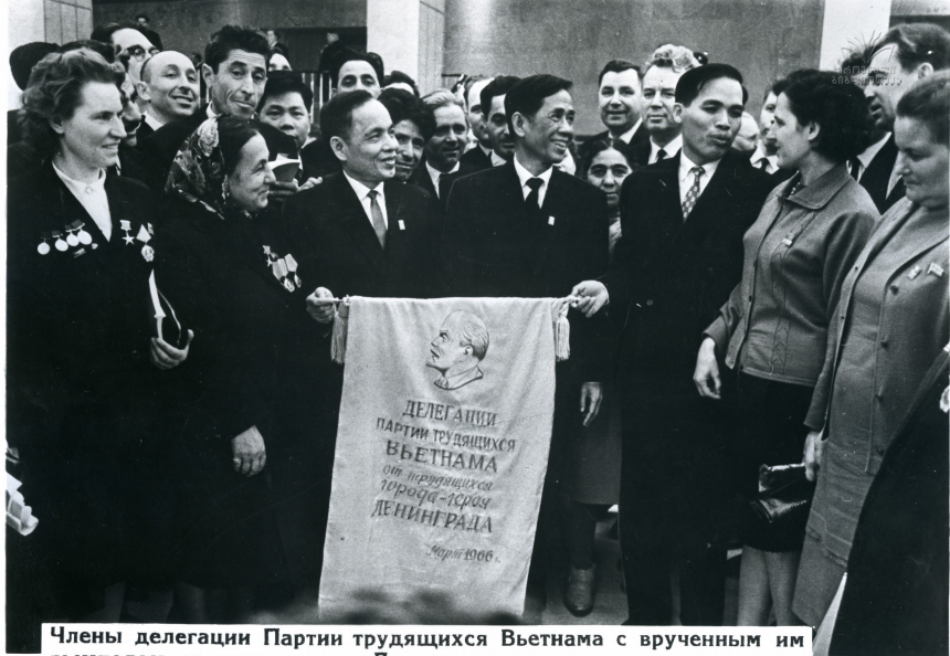
Члены делегации Партии трудящихся Вьетнама с врученным им вымпелом от трудящихся Ленинграда среди делегатов съезда.