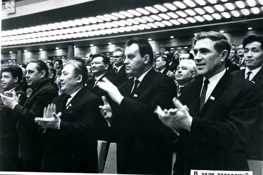
В зале заседаний.