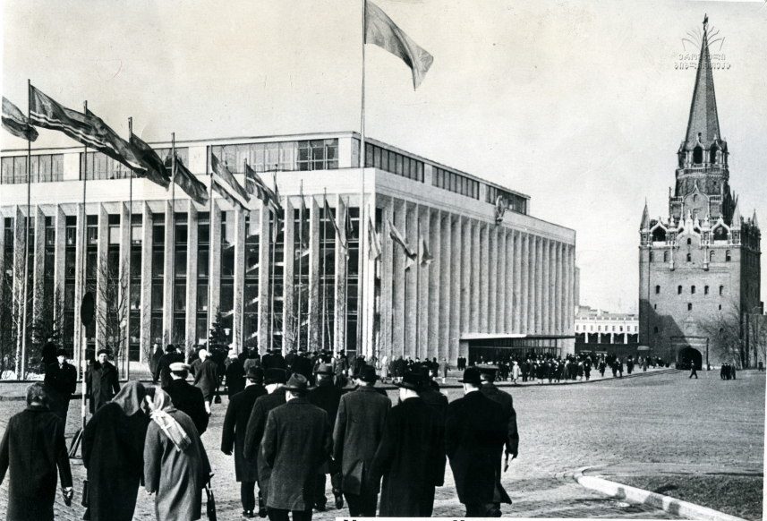
У здания Кремлевского Дворца съездов. Делегаты направляются на заседание.