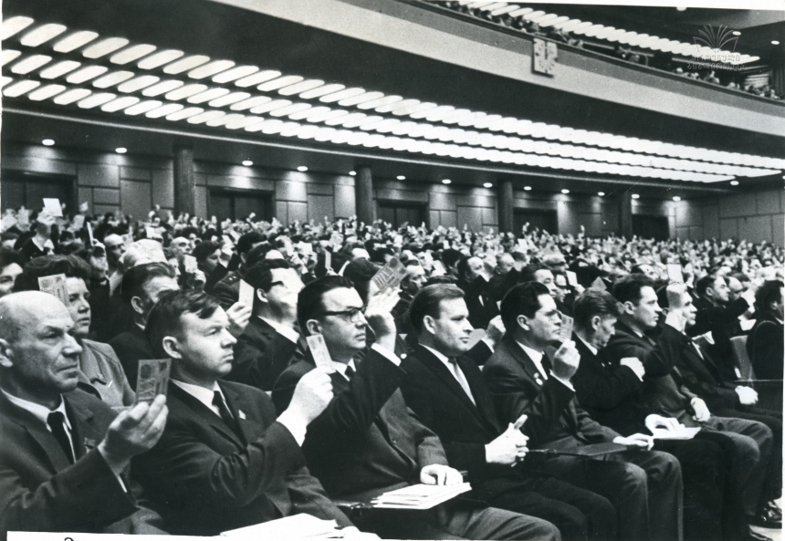
Заключительное заседание XXIII съезда Коммунистической партии Советского Союза. Делегаты голосуют за резолюцию.