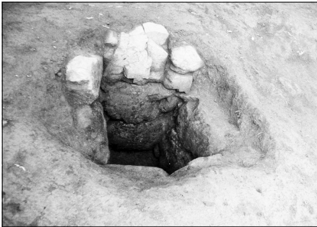
რკინის სადნობი ღუმელი. ჩაქვი, ჩაისუბანი. ძვ.წ. XI-X სს.

ეს ისტორიული ძეგლები (ძვ. წ. XIII-VII სს.) რომლებიც ნივთიერი მტკიცებულებებით ადასტურებენ, რომ საქართველო, ძველი კოლხეთი რკინის წარმოების ისტორიული სამშობლოა დღეს ჩვენს წინაშეა! იგი ქართული და ზოგადსაკაცობრიო კულტურული მონაპოვარია, რომელსაც სათანადო გაფრთხილება, მოვლა-პატრონობა, აღიარება და დაფასება ჭირდება!