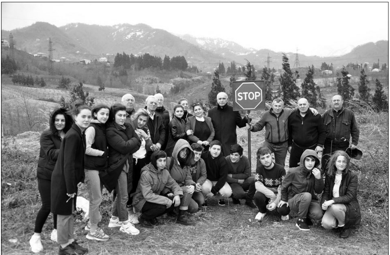
საინიციატივო ჯგუფის წევრები და სოფ. ლედვას საჯარო სკოლის მოსწავლეები და მასწავლებლები უძველეს კოლხთა რკინის სადნობი სახელოსნოს ტერიტორიაზე. სოფ. ლედვა, თებერვალი, 2020 წ.