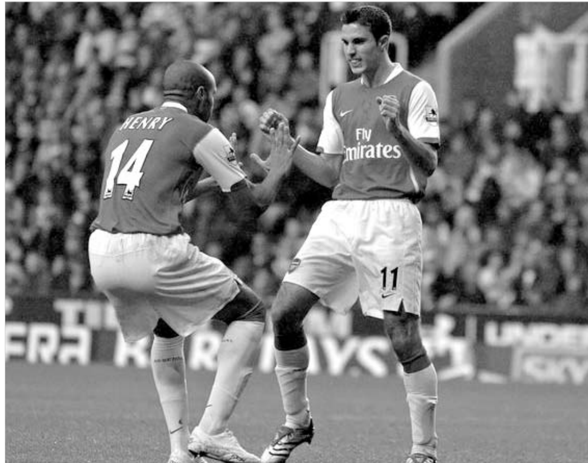
"არსენალი" რევანშისთვის ემზადება.

ნევილისა და საას გარეშე ესტუმრებიან, მაგრამ ფერგისონის შე-