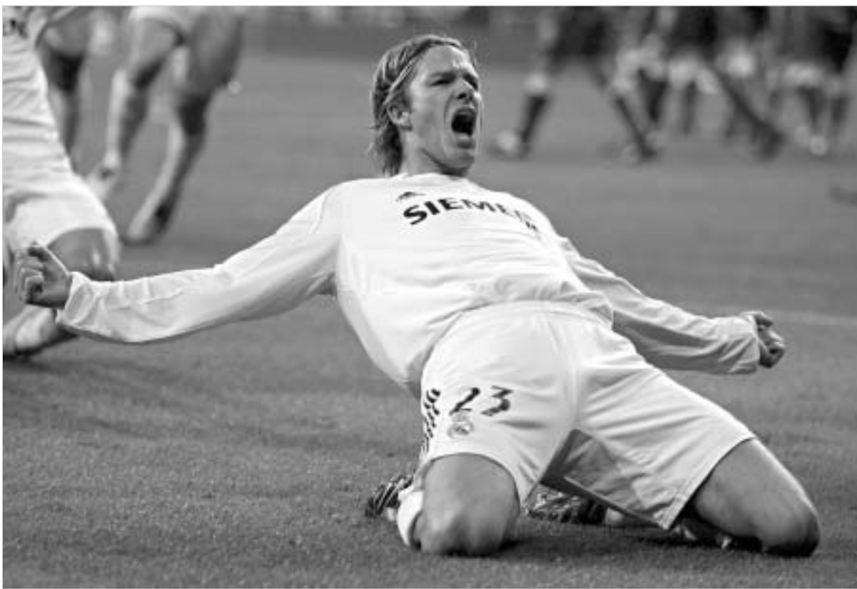
ვად გადამწყვეტილი ამბავიაო.

მიუხედავად ამისა, ალბონზე ვიუტად ამტკიცებენ, დევიდ ბექემი ზამთრის სატრანსფერო სეზონში ფეხბურთელს "რეალს" 7 მილიონი ფუნტის სანაცვლოდ. მაღირდები კი საპირისპიროს აცხადებს "სამეფო გუნდის" პრეზიდენტი რამონ დელპორნი - ბექემთან კონტრაქტის გახანგრძლივება ფაქტობრი-