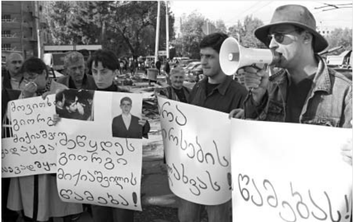
აქციები პერმანენტულად გაიმართება - შინამდე, სანამ პატიმრების უმოწყალო ცემა და ძალადობა არ შეწყდება.