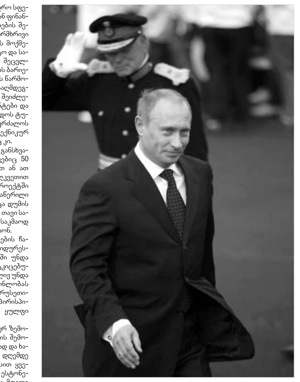
და აგრარული პროდუქციის. საქართველოს წინააღმდეგ ამოქმედებული სანქციები იმთავითვე ყველაზე მასშტაბური იყო, სექტემბრის ბოლოს რუსი ოფიცრების დაპატიმრების შემდეგ კი არსებულ შეზღუდვებს ყველაზე მაღალი სატრანსპორტო კომუნიკაციის მოშლა და სასაქონლო ნაკადების შეწყვეტა დამატდა, რითაც სანქციები კიდევ უფრო გამკაცრდა და კარდინალურად შეიცვალა. სანქციების შესახებ გამკაცრებული კანონის შემოღებამდე მოხდა და შესაბამისი საკანონმდებლო ბაზის უქონლობის ხელი არავისთვის შეუშლია უმაღლესი ხელისუფლების უმაღლესი ნების აღსრულებამ.

თუმცა, ბოლო დრომდე სანქციების თემა მაინც მხოლოდ თეორიულად ფრაგმენტულ სახით ატარებდა და მისი აქტუალობა ძალიან დაბალი იყო. 2005 წლის ბოლოდან ვითარება კარდინალურად შეიცვალა. სანქციების ამოქმედების თვალსაზრისით განსაკუთრებით ზეგარეული სწორედ წარმოშობილი წლიდან აღმოჩნდა, როდესაც რუსეთის მმართველ სანქციები ერთდროულად სამ პოლიტიკურად ურსახელმწიფოს დაუწესდა: უკრაინიდან რუსეთში ხორციის და რძის პროდუქტების შეტანა აკრძალა, მილდოვიდან - ლენინის, საქართველოდან - ლენინის, მინერალური წყლებისა