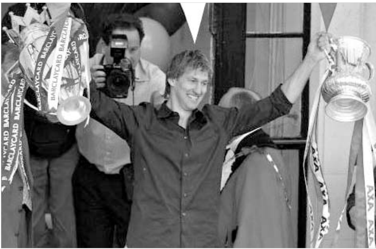
ტონი ადამსი Sporting Chance Clinic-ის დამაარსებელი.

ასეთ დროს მათთვის გამოსავალია პორნოგრაფია. "ნაგების შემდეგ თავს ცუდად გრძობენ, სათამაშო ფული თითქმის აღარა აქვთ. საიტომ მორიგ სათამაშო საიტზე აღარ შედიან. ძნელი მისახვედრი არ უნდა იყოს, რომ გულის გადასაყვლებლად არ ნახავენ ფილმს "რიგითი რიანის გადარჩენა". პირდაპირ რომედიმე პორნოსაიტზე შევლენ და... დილის ხუთ საათამდე ასე იტარებენ დროს. ცხადია, მეორე დღეს ფეხბურთის ნორმალურად