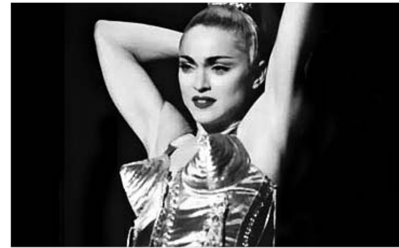
მადონა მისი სიყვითისათვის", - განაცხადა ბანდა.

ყველაფრის მიუხედავად, იოჰან ბანდა მადონას გადაუხადდა მადონას, რომ დაეხმარა მის შვილს ავადმყოფობისგან განთავისუფლებაში. "ჩემი ვლიტულობით, რომ დემეტრე დალოცოს