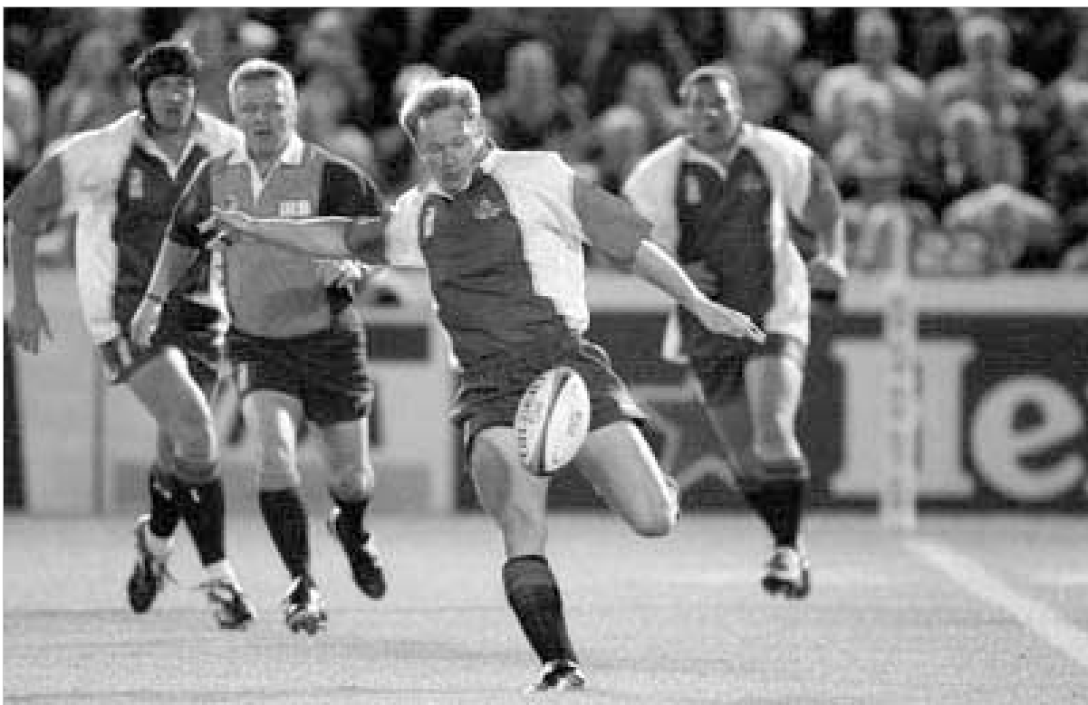
ნამიბიის გამარჯვების კარგი მონსი აქვს.

2 გარდასახვა, 2 საჯარიმო: ვესლესი მაროკო - ლელო: გარდასახვა: გარსია რევერი: მაკდაუელი (ირლანდია).