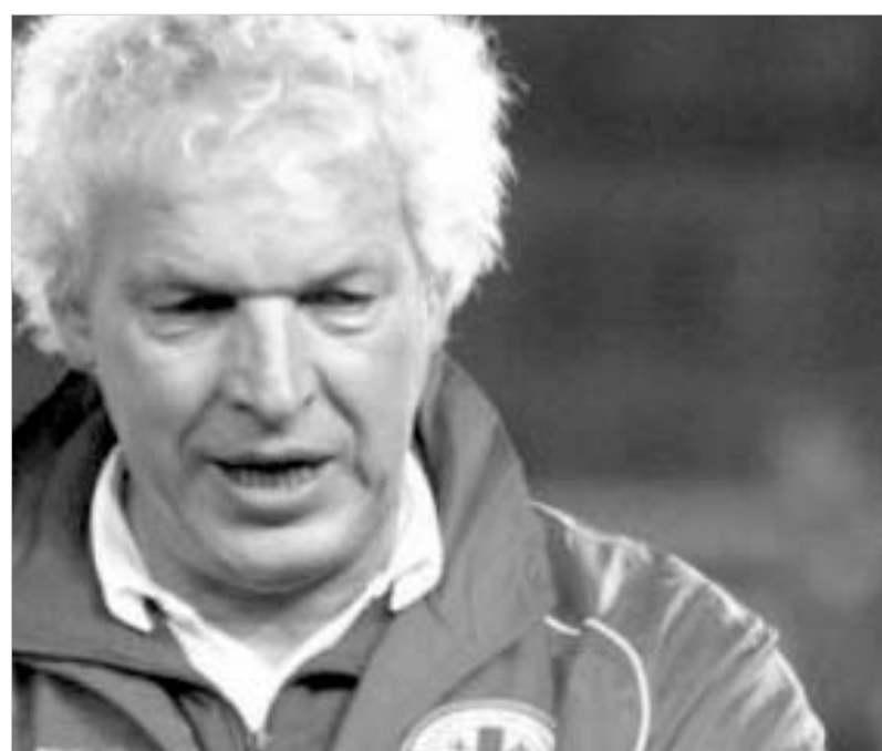
ტომშიოლერმა სია დაასახელა.

ლობაში რამდენიმე ახალი სახე გამოჩნდა. კერძოდ, ბატონმა კლაუსმა ძირითად ნაკრებში მიინიჭა თბილისური "ამერის" ახალგაზრდა ფორვარდი რატი წინამძღვრიოლი. ნაკრებს ასევე გააძლიერებს დავით სირაძეც, რომელიც აქამდე იმსახურებდა ნაკრებში გამოცდის შანსს. კიდევ ერთ სიახლედ ნაკრებში ლადო ბურველის დაბრუნება უნდა მივიჩნიოთ. ურუგვაისთან მატჩზე ტომშიოლერმა არ გამოიძახა შოთა არველაძე, რომელიც ბრწყინვალედ თამაშობს ჰოლანდიურ "ალქმარში", თუმცა გერმანულ სპეციალისტს არავითარს უთქვამს, რომ შოთას არანაირი გამოცდა არ სჭირდება. ეტყობა, ამჯერად საქართველოს ნაკრების მთავარ ფორვარდს დასვენების საშუალება მისცეს. გარკვეული სიახლეები იქნე-