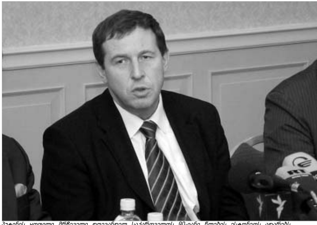
პუტინის ყოფილი მრჩეველი დღევანდელ საქართველოს მმართველის ესტონეთს ადარებს.