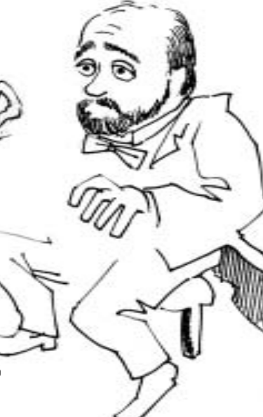
ომბუდსმენს შეგიძლიათ დაუკავშირდეთ მხაბთობით.

აი, "24 საათმაც" კი ერთი სიტყვითაც არ მოიხსენია ოპოზიციის ერთი ნაწილის პოზიციები, რომელიც გასულ კვირის დასანჯიშო გაიმართა და ეხებოდა რუსეთთან დემოკრატიულ ქართველებს. მონოდების შინაარსი შემდეგ იყო: გახსნას პრეზიდენტმა თავისი ონდი და გადაუხადოს კომპენსაცია დემოკრატიულებს, უპრეზენტლოს მათი დასაქმება და ა. შ. რაც არ უნდა კეთილშობილად შედეგად ამგვარი მონოდება, მე ამ დროს სხვა მზა და სხვა იდეები გამახსენდა — ოდესღაც ჯაბა ოსელიანი ამბობდა რუსეთის ტელევიზიის მიერ გადაუხადოს ერთი დოკუმენტურ ფილმი: ვინც ფიქვ იძიოვ, ვალდებულია, ჩემს ფიქვს წილი მისცეს.