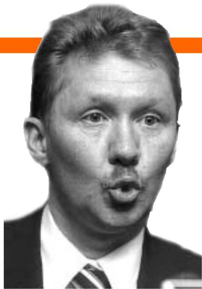
მილარი ყვალაზა ბაველიანი რუსი ოლიგარქი

ეკონომიკური სიახლეების სააგენტომ და გაზეთმა "ნება-ვისიმიამ რუსიამ" ჩაატარეს გამოკითხვა, რომლის მიზანია უმდიდრეს რუს ბიზნესმენთაგან ყველაზე გავლენიანთა გამოვლენა გახლდათ. გამოკითხვის შედეგად, რომელშიც 62 ექსპერტი მონაწილეობდა, გავლენიან რუს ოლიგარქთა რეიტინგში პირველ ადგილზე "გაზპრომის" თავიკაცი ალექსეი მილერი გავიდა, მეორე ადგილი კი ჩუკოტკის გუბერნატორმა, უმდიდრესმა რუსმა რომან აბრამოვიჩმა დაიკავა.