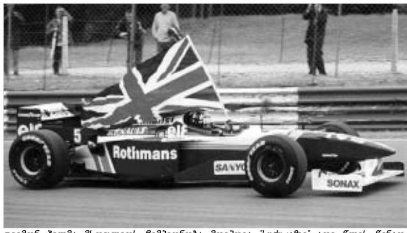
დევიდმა პილიმა მსოფლიოს ჩემპიონობა მოიპოვა "სუპერჯე" ათი წლის წინათ.