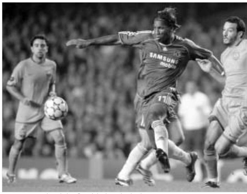
ლოკა კიდევ ბერ სინტერესს გავირდება.