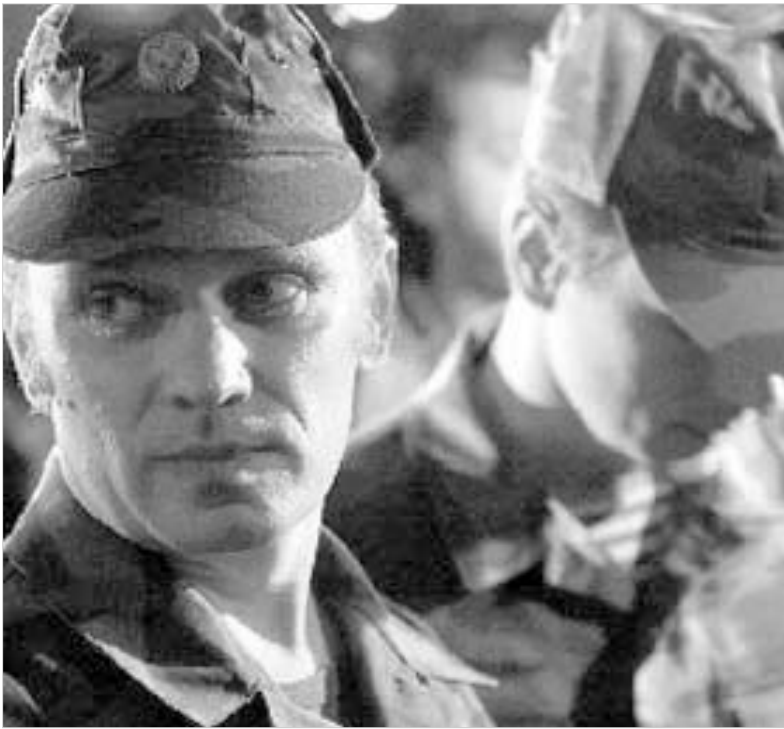
კავშირშია ბრალდებული ბარანოვი და ზავგორდნი რუსეთში აღმარაკედნენ.

პოდპოლკოვნიკ ბარანოვის განცხადებით, დაკავებისას მასზე მოახდინეს ფსიქოლოგიური ზენო-