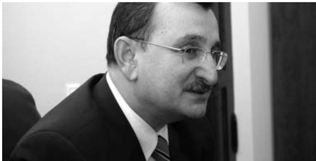
ეროვნული ბანკის პრეზიდენტი რომან გოციორიძე

მიუხედავად მუქარისა, რუსეთის სათათბირო არ დასრულა იმ კანონპროექტზე მუშაობა, რომლის მიხედვითაც რუსეთიდან ფულადი გზავნილები გარკვეულ სახელმწიფოებში უნდა შეზღუდულიყო. არადა, დუმის სპიკერი ამ ორივე დღის წინ იქადაგებდა, რომ 4 ოქტომბერს აღნიშნული კანონპროექტი მზად იქნებოდა, რადგან რუს დეპუტატებს იმავე დღეს უნდა ემსჯელათ. რა აკავებს მეზობელ სახელმწიფოს საკუთარი მუქარის შესრულებისაგან და რა შედეგი შეიძლება მიიმკის მან საქართველოს ბლოკადით?