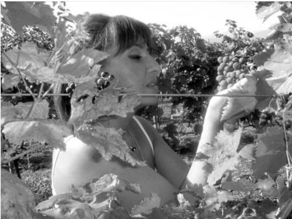
ის მართლა ცოცხალია და სუნთქავს. თან მადლიანია. მასში მზეც არის და სიყვარულიც.

ამჟამად "ქინძმარაულის მარანი" 12 სახეობის თეთრ და წითელ ღვინის ასხამს. მათ შორის არის - თეთრი