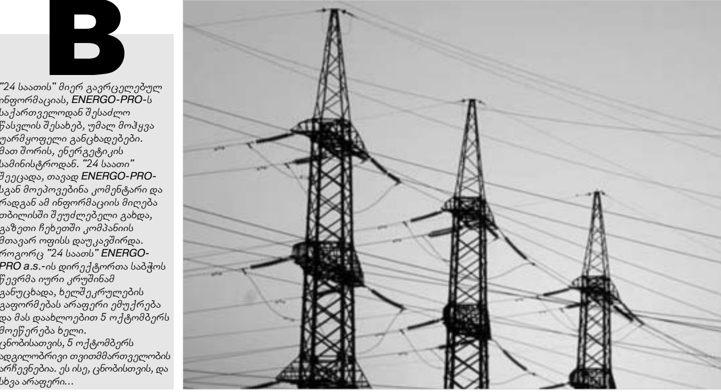
ენერგოინფრასტრუქტურის მშენებლობის პროექტი

ENERGO-PRO და საქართველოს მთავრობა მიმდინარე კვირას ოფიციალურად გარიგებებიან