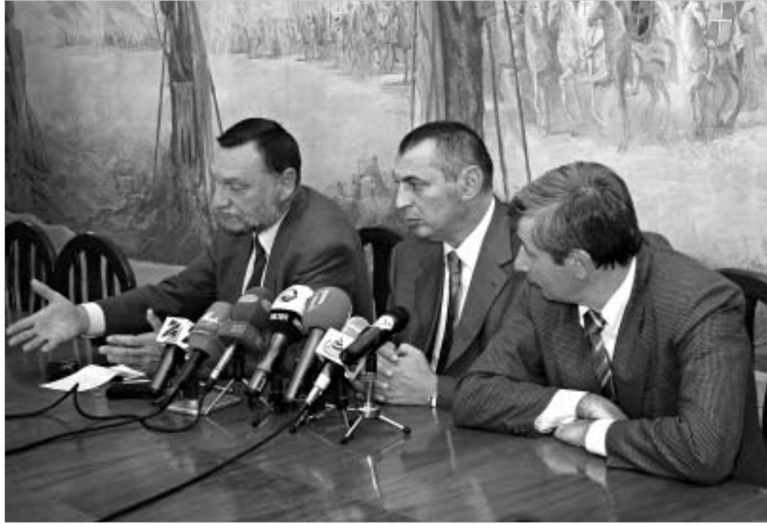
დემოკრატიული ფრონტი ხელისუფლების ქმედებებს სრულად ამართლებს.