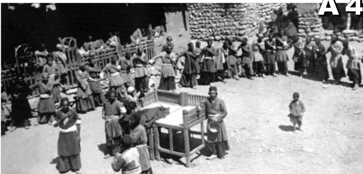
ფერეიდანი. სამზადისი მუშარების დღესასწაულისთვის.

ქარვასლაში უნიკალური ფოტოგამოფენა გაიხსნა