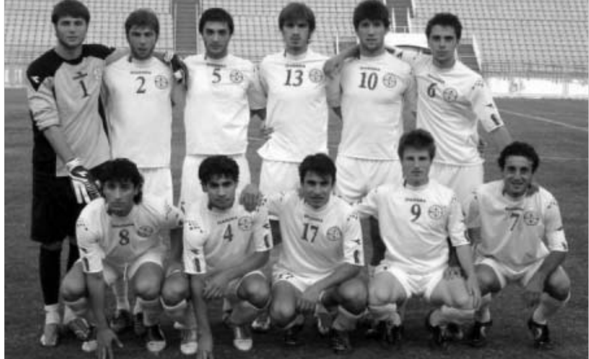
19 წლამდელები რეიმინეთში ითამაშებენ.