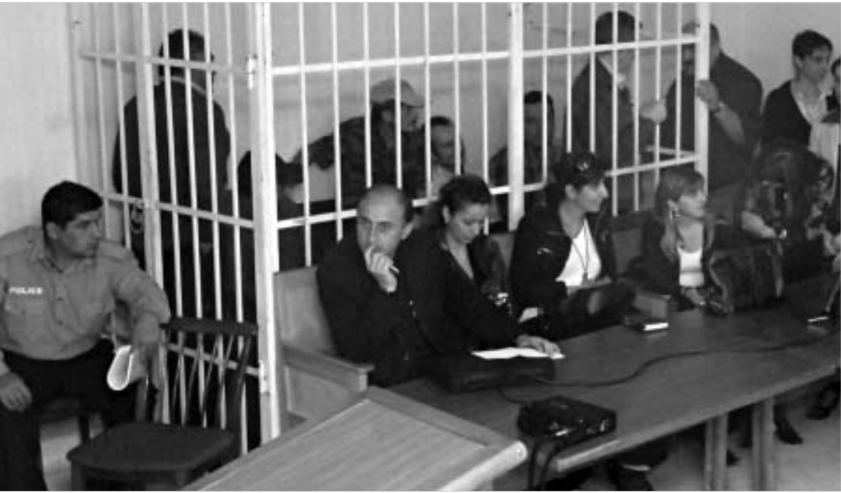
პროცესი დახურულ რეჟიმში ჩატარდა.

"სასამართლო დარბაზში გაეღრმდება ისეთი ინფორმაცია, რომელიც სახელმწიფო საიდუმლოებას შეეხება, ამიტომ, შინაგან უსიონილი არ არის, პროცესი საჯაროა".