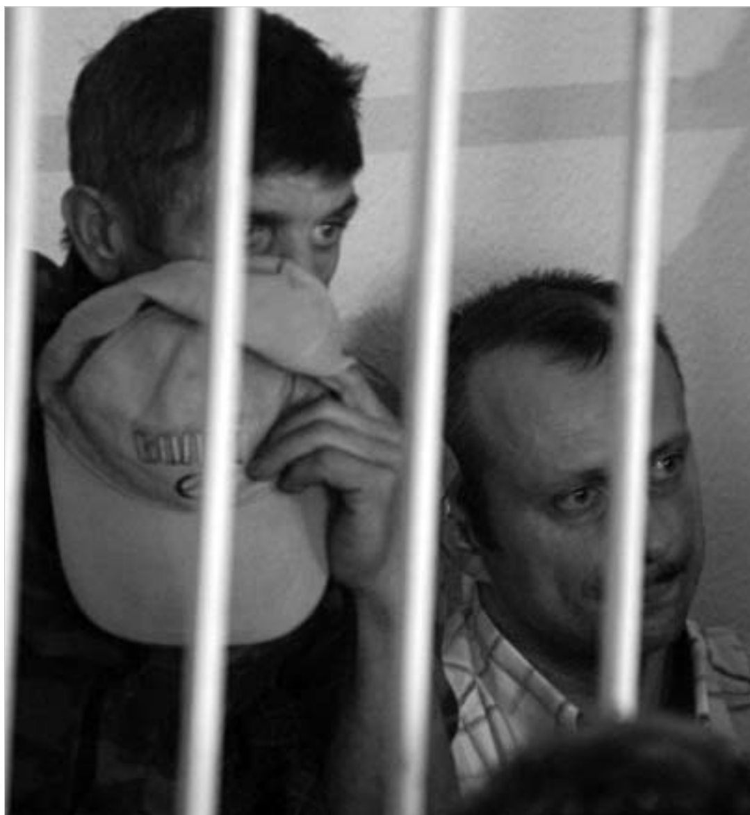
დაკავებულმა დანაშაული აღიარა.