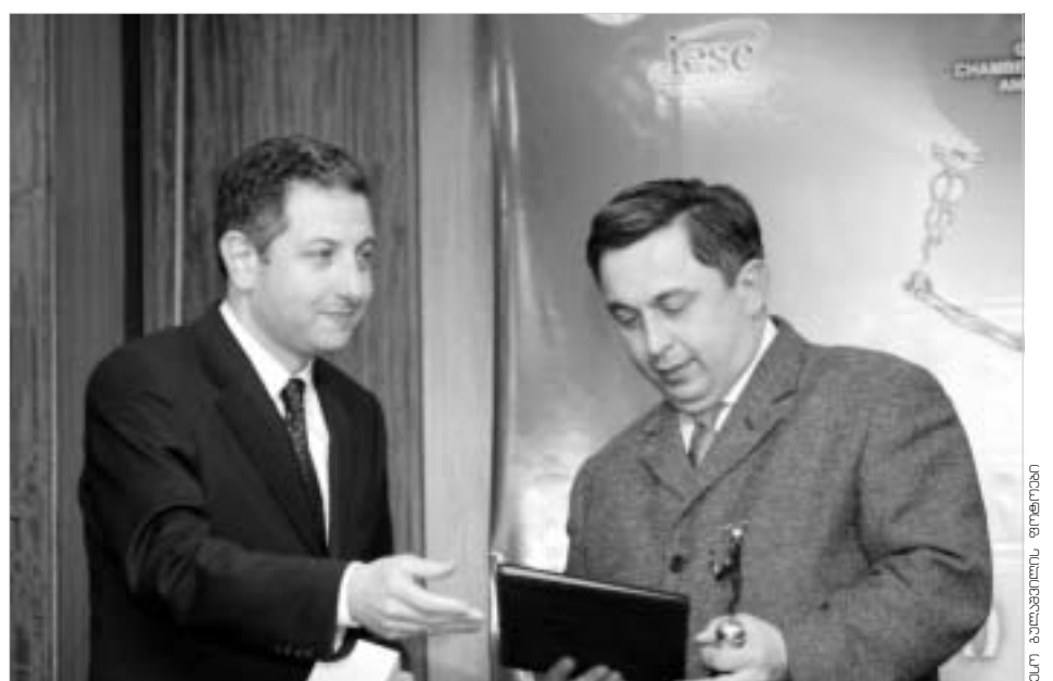
საქართველოს საგარეო ურთიერთობების სამსახური