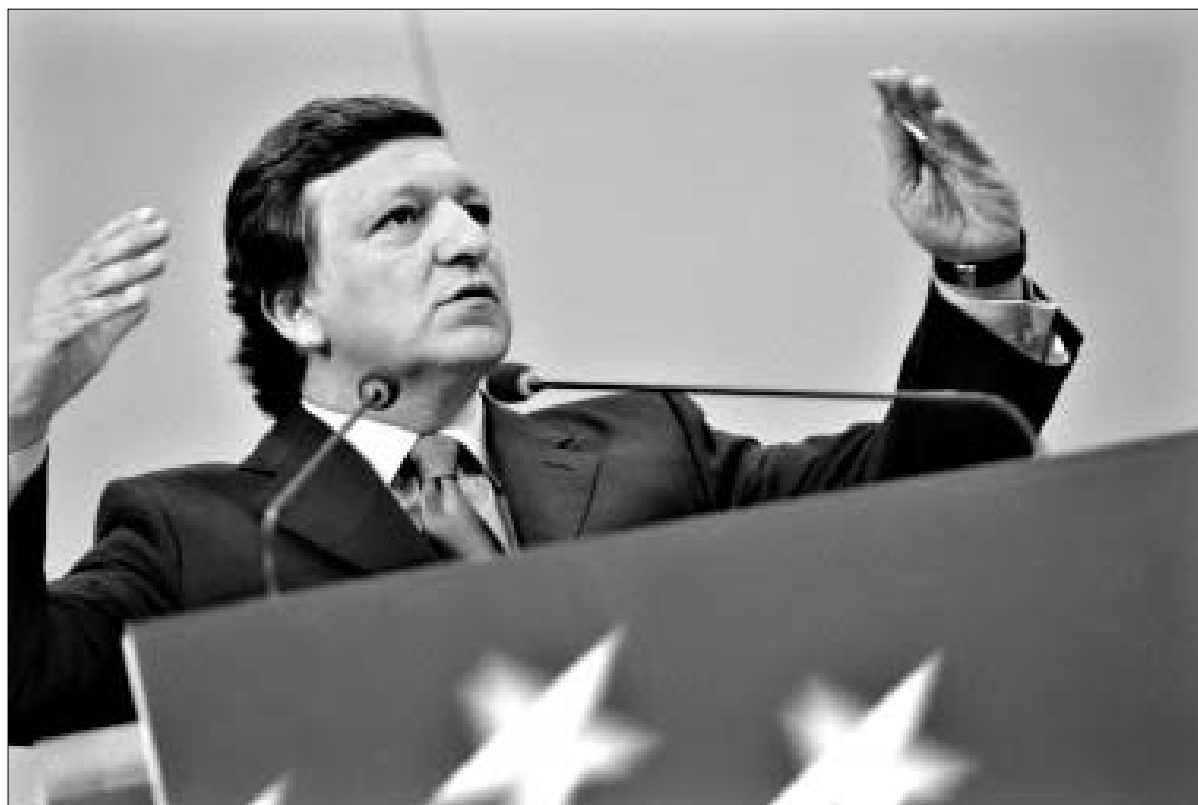
მანუელ როგორია 49 წლის პოლიტიკოსის მონაწილე?

პოლიტიკური განათლების მიღება ბაროზუმ შეეცადინა, შეწევის უნივერსიტეტში განაგრძო, შემდეგ კი უკვე ჯორჯთაუნის უნივერსიტეტში გადაიდა კურს-