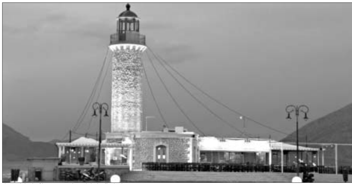
ქალაქის სიმბოლო - პატრასის მუკერა.

პროექტმა დროთა განმავლობაში დიდი პოპულარობა მოიპოვა და დღეს, ევროპული კულტურის დედაქალაქად დასახელებული ქალაქი მთელი წლის განმავლობაში აურაცხელ ტურისტს იტებს.