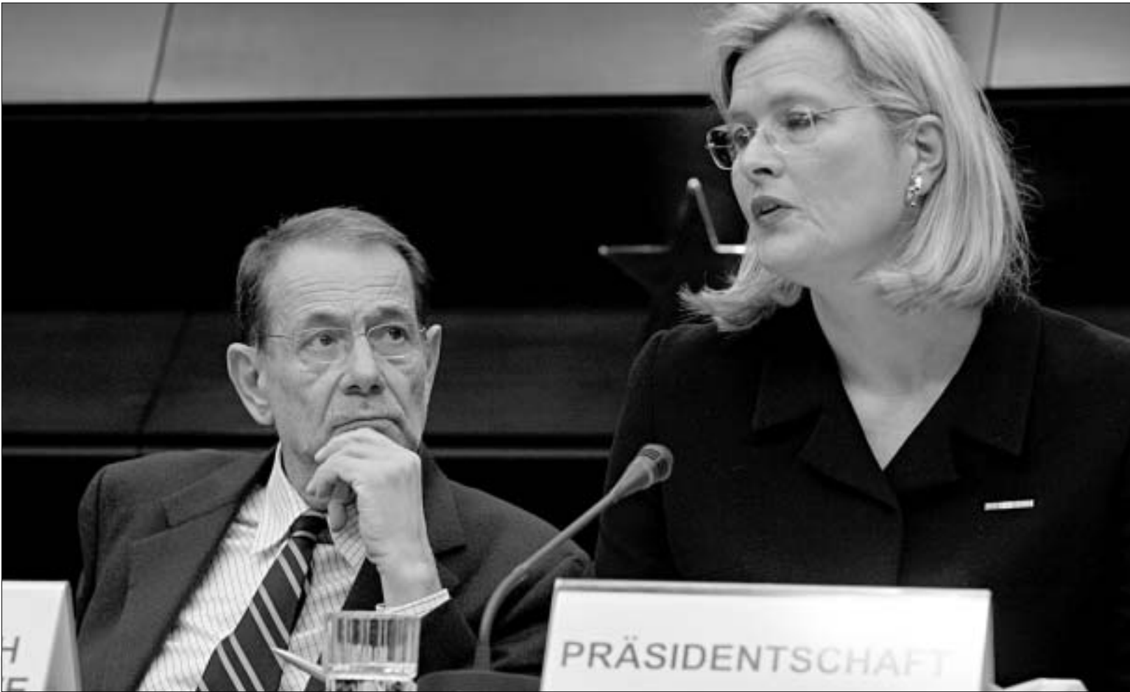
ევროკავშირის მინისტრთა საბჭოს შეხვედრა 30-31 იანვარს ბრიუსელში.

30 იანვარს შემუშავებულ განცხადებაში ნათქვამია, რომ სასურველია ერაყში ახალი მთავრობა რაც შეიძლება მალე ჩამოყალიბდეს და მასში ყველა ის პოლიტიკური ძალა იყოს წარმოდგენილი, რომელიც მშვიდობას უჭერს მხარს.