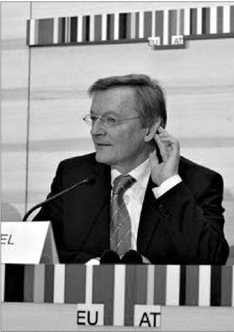
კოლფაანგ შესული: "ევროკავშირი არ უნდა გადაიტიროს".

2006 წლის 1 იანვარს ავსტრია გახდა ევროკავშირის საბჭოს თავმჯდომარე ქვეყანა, რაც ნიშნავს, რომ მიმდინარე წლის 30 ივნისამდე საბჭოს მუშაობას ავსტრია უხელმძღვანელებს და წარმოადგენს მას სხვა ევროპულ (ძირითადად ევროპარლამენტის და ევროკომისიის) და საერთაშორისო ინსტიტუტებთან ურთიერთობაში. წლის მეორე ნახევარში კი თავმჯდომარის მოვალეობებს ფინეთი გადაიბარებს.