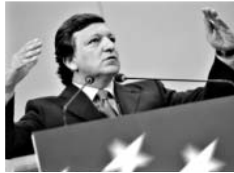
ევროპორტრეტი: ევროპის მისაჭი