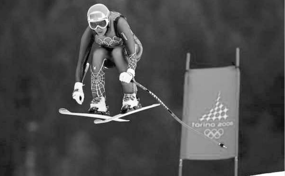
დორფმისტერმა ოლიმპიურ ტრასას გადაუფრინა.

ბიბა ბარასაშვილი მოვლენები ჯერ კიდევ მაშინ განვითარდა, სანამ ქალი სამთოთბიხლამურეები სწრაფდამკვლელებს გაითამაშებდნენ. რომაათის ფრანგმა კარლ მოსტიმ და ამერიკელმა ლინსეი კილდუმ ვორჯისხის ტრამპები მიიღეს და სააფხაზელო გზას გაუყენეს. ექიმები ფიქრობდნენ, რომ შესაძლოა, მთის ოლიმპიადამ იმ დღეს დამთავრებულიყო, მაგრამ ისე მოხდა, რომ გუმინ ორივე გავიდა სტარტზე გამარჯვებით კი ავსტრიელმა მიხაელა დორფმისტერმა გამარჯვდა.