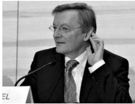
ავსტრია - ევროკავშირის საბჭოს თავმჯდომარე ქვიჰანა