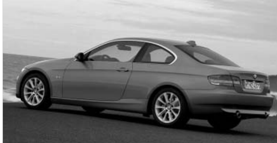
BMW 3-series coupe