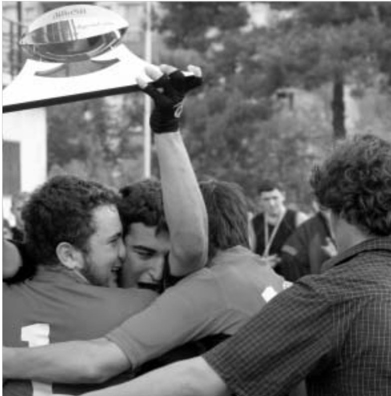
ტურნირის გამარჯვებული "ყოჩები":

შაბათს კიდევ ერთ კარგ ტრადიციას ჩაეყარა საფეხბურთო ვარკვე-თილში, სარაგბო კლუბ "ლელოს" სტადიონზე "ქისტის თასის" გათამაშება გაიმართა 14 წლამდე ასაკის მორაგბეთა შორის. ტურნირი ტრადიციულად გარდაცვლილი ახალგაზრდა მორაგბის ბექა ხუციშვილის ("ქისტი") ხსოვნას მიეძღვნა.