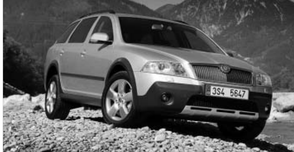
Skoda Octavia Scout