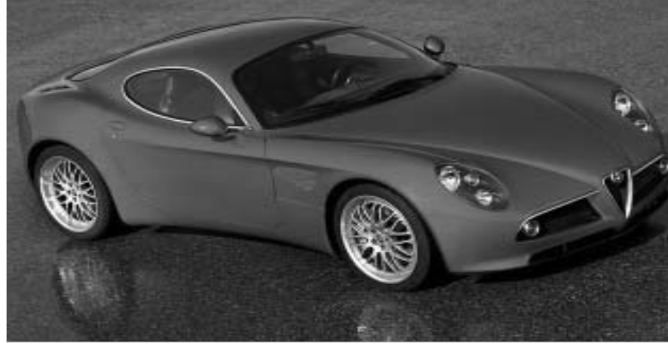
Aifa Romeo 8C