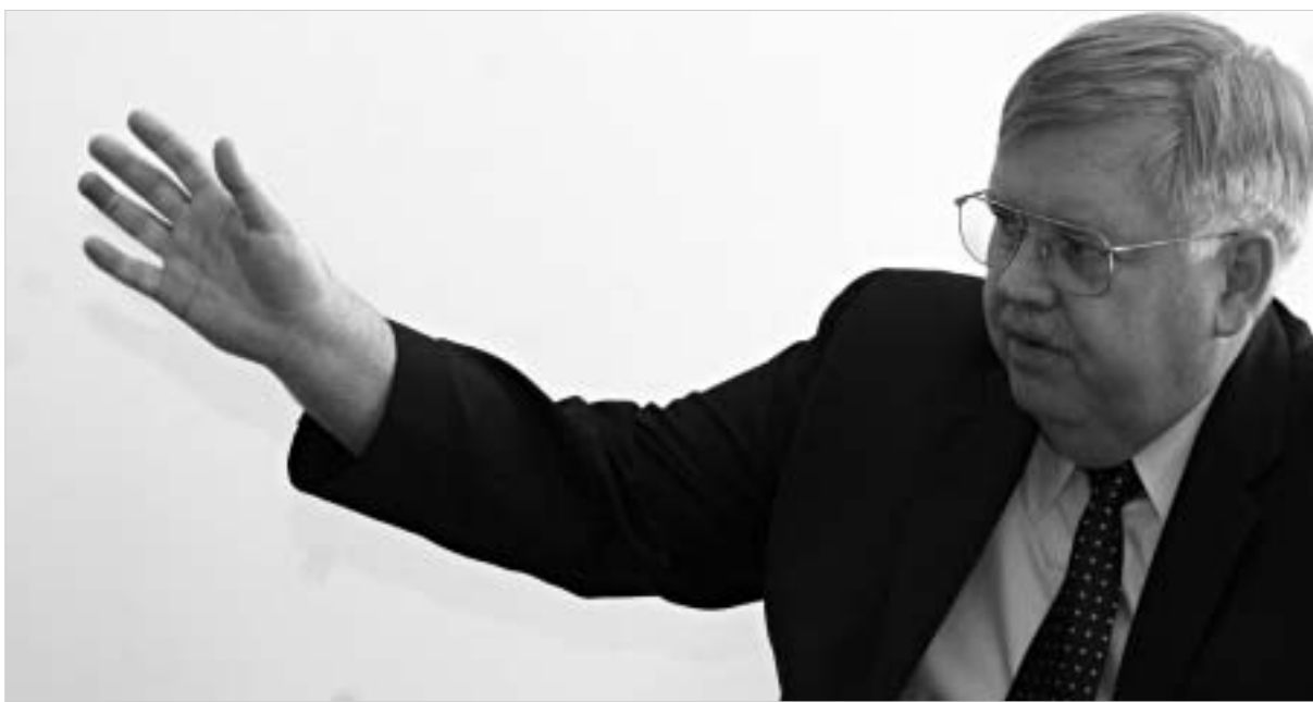
დემოკრატიის მშენებლობის სტრატეგია დოქტორი დევიდ სმეეტა. ის პროცესის საქართველოში დანერგვას იმედობს.

საქართველოში დემოკრატიული პროცესების ხელშეწყობა უკვე დაიხარჯა 640 000 დოლარი. ამ თანხას რამდენიმე არასამთავრობო ორგანიზაციამ გამოიყენა ადმინისტრირება. "ხალხი თაობა, ახალი ინიციატივა", დემოკრატიის და არჩევნების მხარდაჭერის ორგანიზაცია და "ადგილობრივი თვითმმართველობის ნაციონალური სახელმწიფო ასოციაცია".