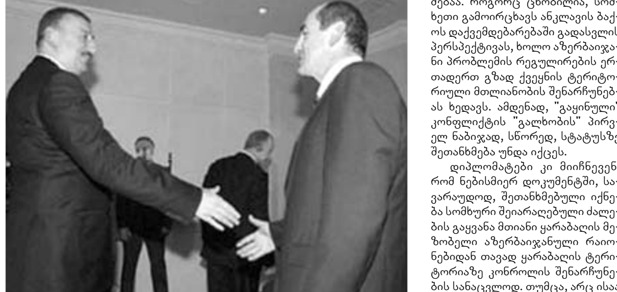
განცხადებებს ცხება, არამედ მნიშვნელოვან როლს ამ შემთხვევაში აზერბაიჯანულ და სომხურ პრეტო ქვეყნების ლიდერების მწვავე ასრულებს. დიპლომატთა თქმით, საფრანგეთში გამართული შეხვედრის მიზანი ჯერ მხოლოდ მთიანი ყარაბაღის სტატუსზე შეთანხმება იყო.

ელისეს სასახლეში პარასკევს საფრანგეთის პრეზიდენტმა ჟაკ შირაკმა 45 წუთიანი შეხვედრა გამართა ცალ-ცალკე სომხეთისა და აზერბაიჯანის პრეზიდენტებთან. თემა, რასაკვირველია, ყარაბაღის გაყინული კონფლიქტის რეგულირების გზების ძიება იყო. შეხვედრით კი რობერტ კოჩარანი და ილჰამ ალიევი მოლაპარაკებების მაგიდას რამზოუიეს სასახლეში მიუსხდნენ, მაგრამ როგორც მოსალაღმდეგი იყო, მოლაპარაკებები ერთდღიანი არ აღმოჩნდა და შეხვედრას სამხრეთ კავკასიის ორი სახელმწიფოს პრეზიდენტები დღესაც განაგრძობენ. რამზოუიეს სასახლეში გამართულ გუშინდელ შეხვედრაში მონაწილეობდნენ ასევე საფრანგეთის, აშშ-სა და რუსეთის წარმომადგენლებიც, რომლებიც ეუთო-ს მინსკის ჯგუფის წევრები არიან. სწორედ, ეს ჯგუფი მუშაობს მთიანი ყარაბაღის პრობლემის მოგვარებაზე. "ამჟამად უკვე არსებობს შეთანხმებისთვის საფუძვლის ჩაყრის შანსი", - მიიჩნევს ჟაკ შირაკი. "ჩვენ უკვე გვაქვს ოპტიმისტური განწყობის მიზეზი, უბრალოდ, საჭიროა პოლიტიკური ნების გამოვლენა და გარკვეულ რისკზე წასვლა", - აღნიშნა ასევე სომხეთის პრეზიდენტმა რობერტ კოჩარანმა სომხური ტელევიზიისთვის მიცემულ ინტერვიუში. აზერბაიჯანული მხარე კი მიიჩნევს, რომ მეტი ძალისხმევა საჭიროა მოლაპარაკებებისას არსებული ურთიერთგამომრიცხავი პოზიციების დაახლოებისათვის. საფრანგეთის პრეზიდენტის პროგნოზის რეალურობას არ გაამორიციხებენ, სხვათა შორის, ნაკლებად ოპტიმისტურად განწყობილი ექსპერტებიც. თუმცა, მხარეთა შუამდგომლობის მიხედვით, ეს არცთუ მარტივი მისაღწევი იქნება. საქმე არა მარტო ქვეყნების ლიდერების მწვავე