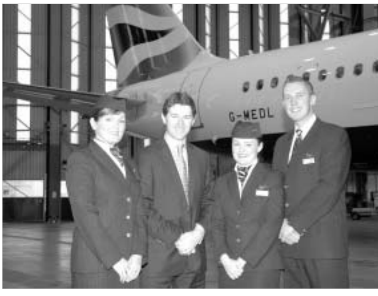
აგს. ბოლო წლის მარჯვენების მიხედვით, მგზავრების რიცხვი- ლნიდა ფრენის სიხშირეც შესა- ბამისად გაიზარდება," - განა- ცხადა ბიმედის აღმასრულებე-

თბილისიდან ლონდონის გავე- ლით გრძელ მარშრუტზე მიმავ- ალ მგზავრებს ამერიიდან შესაძ- ლებლობა ეძლევათ, ახალი A321 თვითმფრინავით ისარგებლონ.