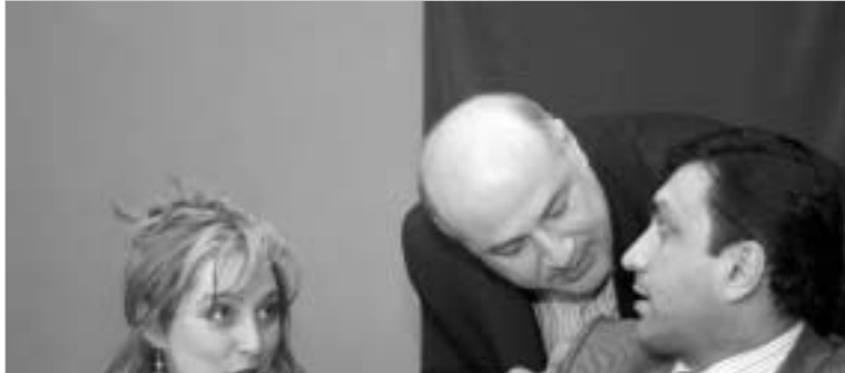
უფრო მეტიც, მისი განცხადებით, ჯერჯერობით ქართულ მხარეს საშიშროება დასულა შემსუაურდა კონტაქტის სრულად არ აქვს გამოყენებული.

ის მძღოლები, რომლებიც კა- ნონის მოთხოვნას არ დაემორჩი- ლებიან, 100 ლარით დაჯარიმდე- ბიან, ხოლო კანონდარღვევის გა- ნმეორების შემთხვევაში მათ ერ- თი წლით ჩამოერთმევათ მართე- ბის მოწმობა. გამონაკლისი მხოლოდ იმ უცხოელებისთვის დაიშვი- ბა, რომლებიც მარჯვენასაქარის საკუთარი ავტომანქანებით საქე- რთველოში სამუშაოებზე ჩამო- ვლენ, ან ჩვენი ქვეყნის ტერიტო- რიას ტრანზიტით გადაკვეთენ.