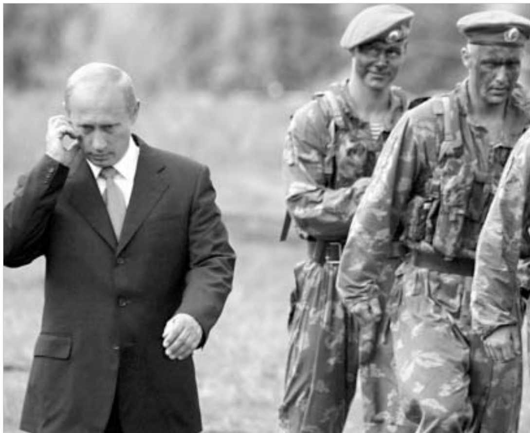
პუტინი ცდილობს, დაარწმუნოს მსოფლიო, რომ ორმაგი სტანდარტების პოლიტიკაც "რეალპოლიტიკის" ნაწილია.