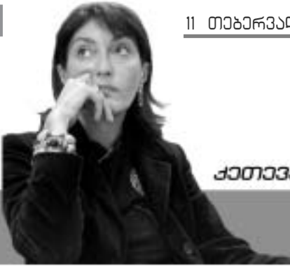
ქათვას ნებატონა წარმოგიძღვება