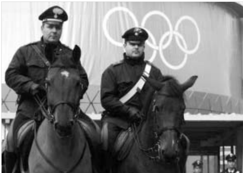
პოლიციელებს თბი თვალი და ყური აქვთ.

ის, რომ იტალიელები ტურინის ოლიმპიური თამაშებზე ყველაზე მეტ ყურადღებას უსაფრთხოებას უთმობენ, გასაკვირი არაა. თამაშების დაწყებამდე ცოტა ხნით ადრე ქვეყნის პრეზიდენტი-მინისტრის სილიო ბერლუსკონიმ აღნიშნა კიდევ ყველა ორზე უნდა ეთმარათ იმისთვის, რომ დავიცვათ იტალიის კეთილი სახელი.