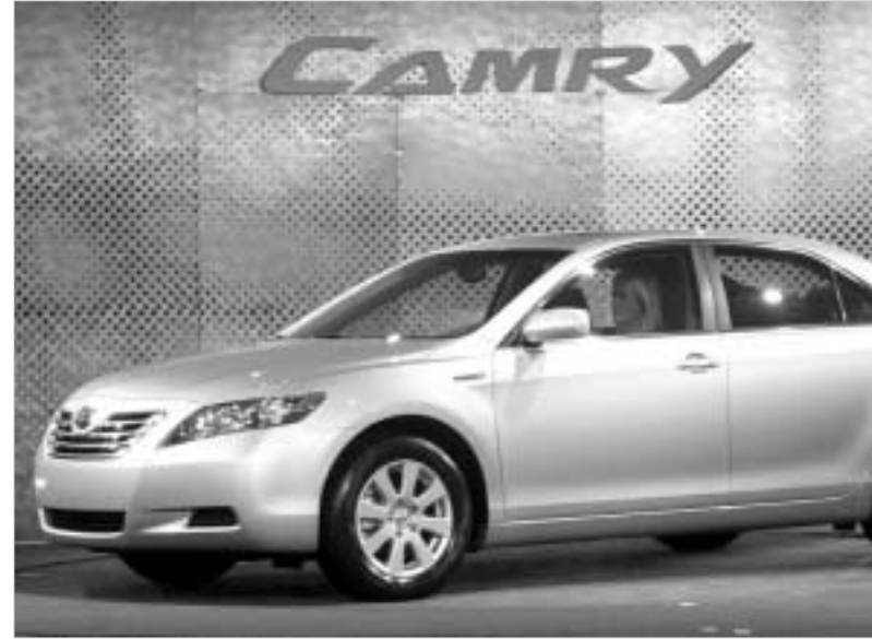
შეიქმნა თაობის ქამრი