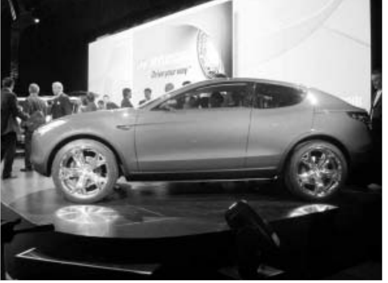
HCD9 Talus - ჰიუნდაის სპორტული ექსპერიმენტი