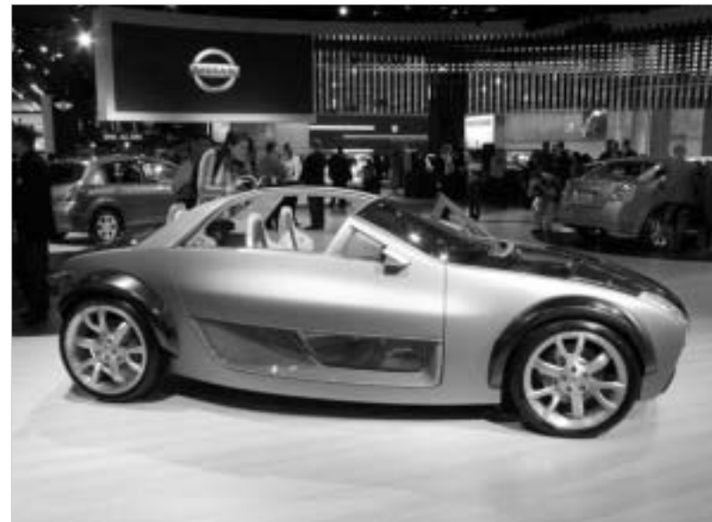
ნისანის სამდგილიანი "სურვილი"