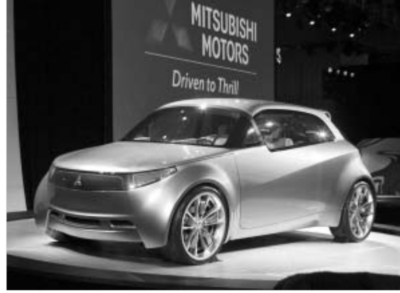
ასეთი უნდა იყოს მინის კონკრეტული მიცუბიშიდან