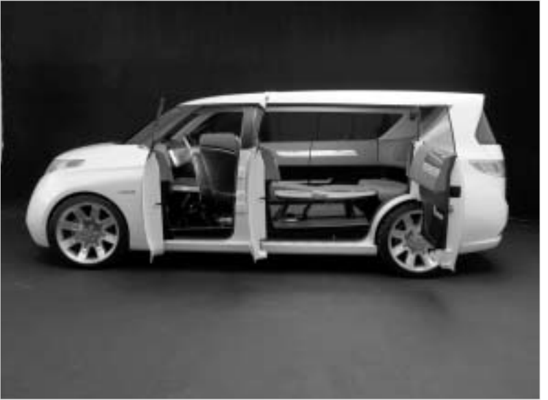
F3R - ასეთი ტოიოტას მომავლის მინივენი