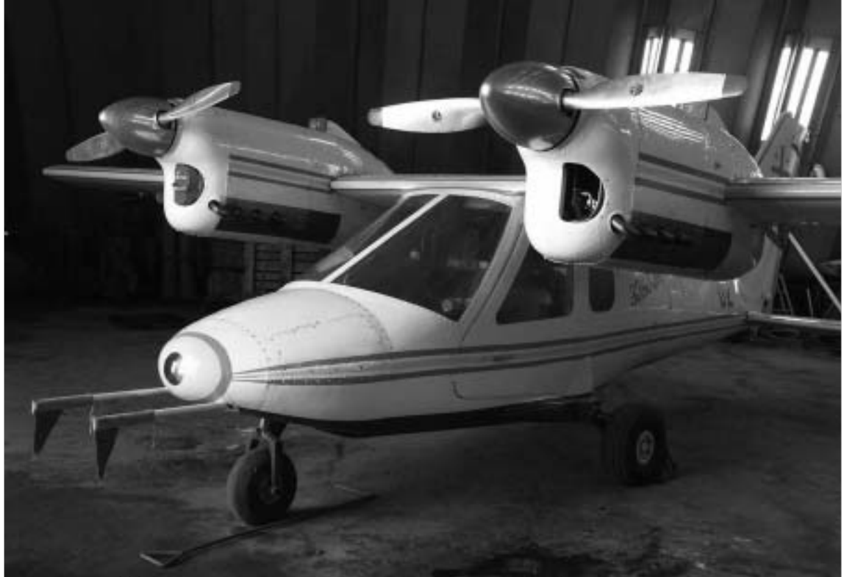
„მერკური 003“ ქუთაისის საავიაციო სარემონტო ქარხნის პავილიონში

რა ულის ქუთაისის საავიაციო ქარხნის ამბიციურ გეგმებს?