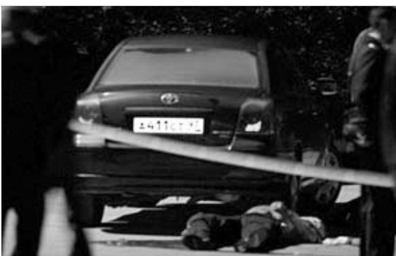
ზია "ინვესტიკომბანკ ბელკომბა". ოპერატიული სამსახურების ვარაუდით, თუ თავდასხმა საბანკო