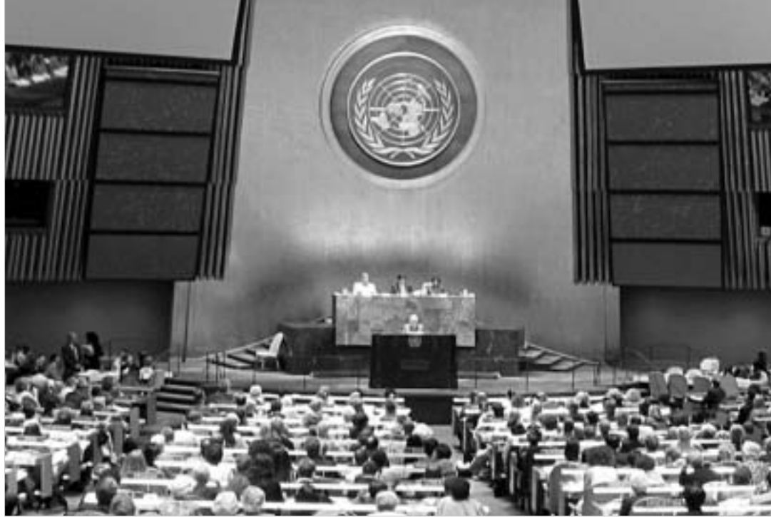
უმალეს ფორუმზე "გაყინული კონფლიქტების" შესახებ პირველად იმსჯელებენ.