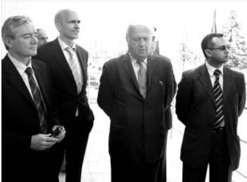
რეაბილიტირებული "დიდი ზესტაფონის" მთავარი შემოქმედები.

"ქვესადგურის მოწყობილობის ხშირი დაზიანება, რაც მისი სიძველეთა იყო გამოწვეული, ხშირად ხდებოდა სისტემის სქემის ორად გაყოფის მიზეზი. ავარიული სიტუაციები შეფერხებებს იწვევდა ენერჯისტიკის საიმედო მუშაობაში და მომხმარებლის უწყვეტ ენერჯომომარაგებაში მისი ტექნიკური მოთხოვნებს არ შეესაბამებოდა," - აცხადებდა გუშინ "საქართველოს სახელმწიფო ელექტროსისტემის"