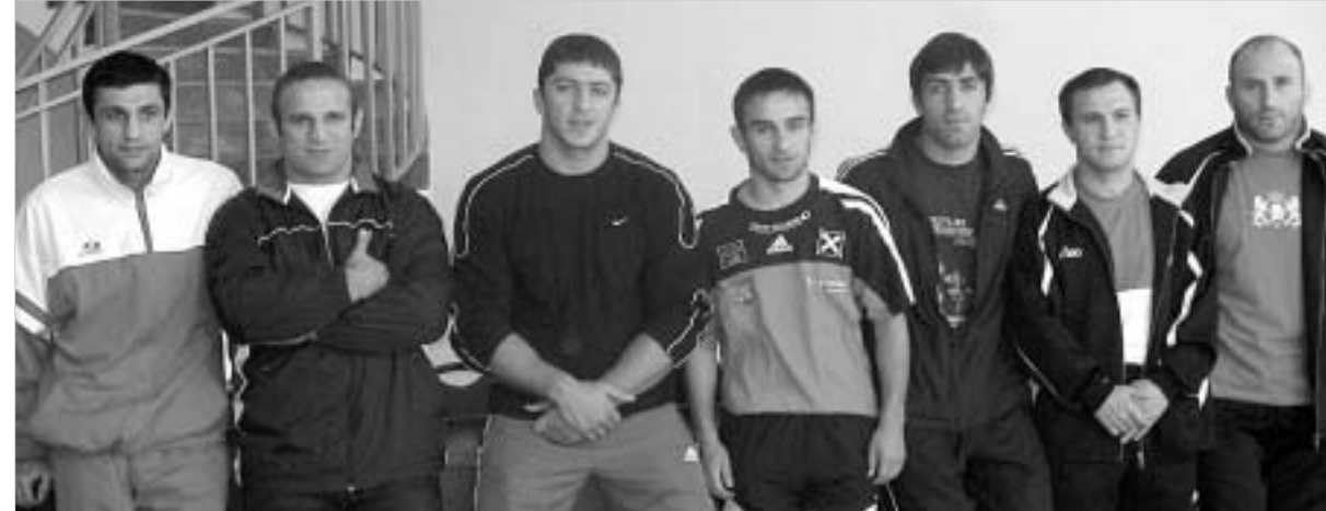
ბერძენ-რომაელები და "თავისუფლები" მსოფლიოს ჩემპიონატისთვის გუნება-განწყობას არ უჩივიან.