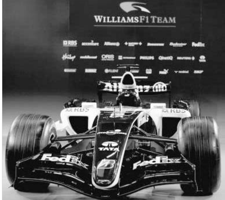
"უილიამსმა" თავისი ახალი ბოლიდი - FM28 წარმოადგინა.

"ჩვენ ძალიან ამბიციური გეგმები გვაქვს. იმედია, მათ განსაკუთრებულად ეს მოედელი დაგვხმარდება. როცა ბოლიდს ქმნი, არასდროს არ ფიქრობ იმაზე, რომ ის უბრალოდ ფინიშამდე უნდა მივიდეს. ჩვენ გამარჯვებების მოპოვების იმედი გვაქვს", - განაცხადა "უილიამსის" ერთ-ერთმა მფლობელმა პატრიკ ჰედმა. ახალი მანქანით კმაყოფილი დარჩნენ გუნდის პილოტებიც: მარკ უებერი და ნიკო როსბერგი. ეს უკანასკნელი დებიუტანტია და "სამეფო როლაში" პირველი სეზონის ჩასატარებლად ემზადება.