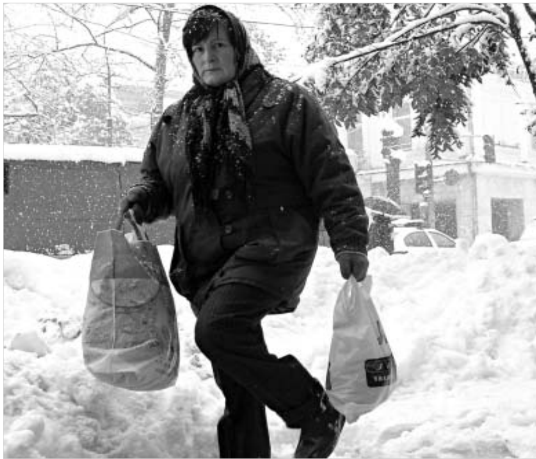
ქუთაისელებმა უმძიმესი კვირა გადაიტანეს.