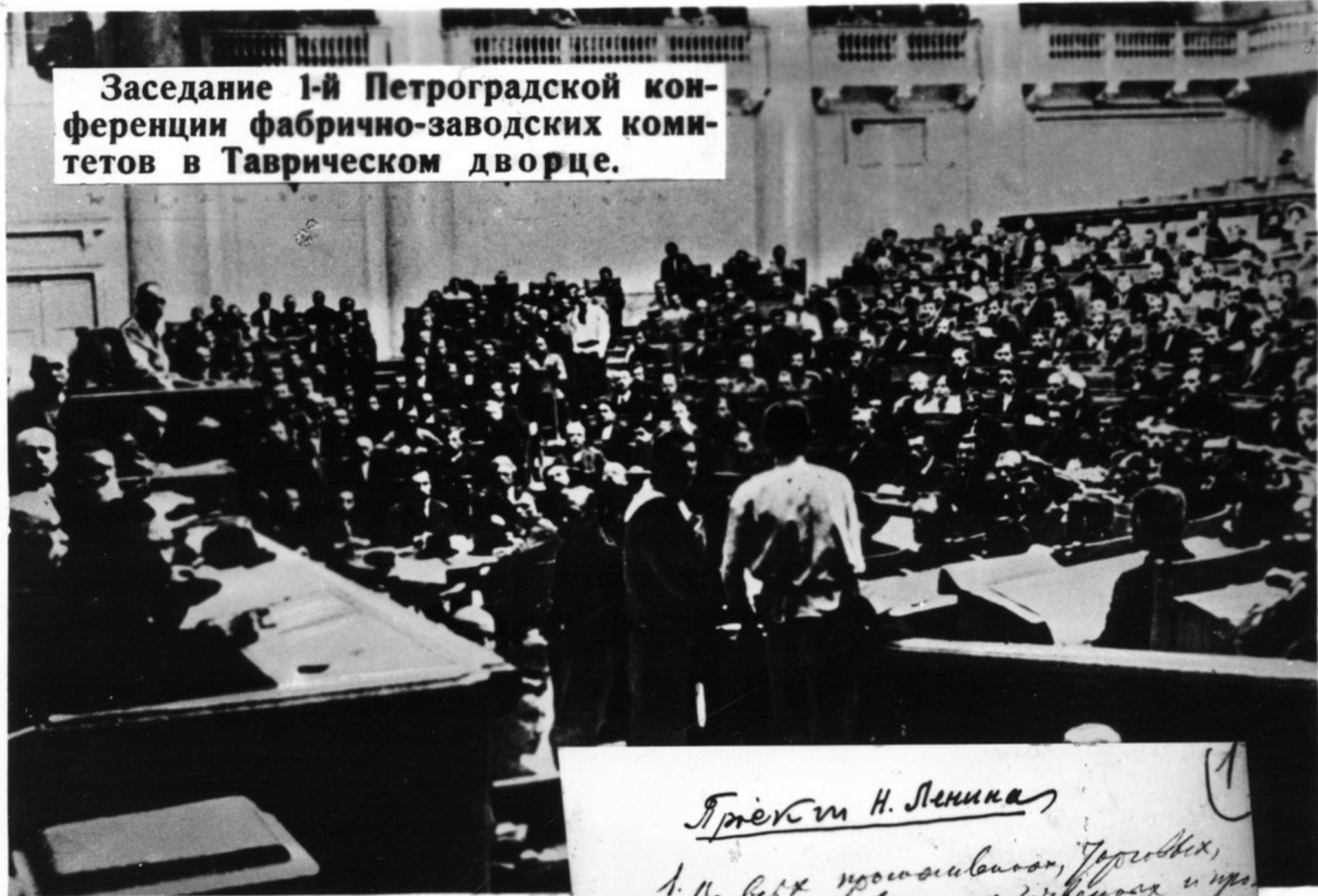
Рукопись В. И. Ленина „Проект положения о рабочем контроле“.

Главным в работе государственного аппарата В. И. Ленин считал контроль за исполнением решений и директив партии и правительства.