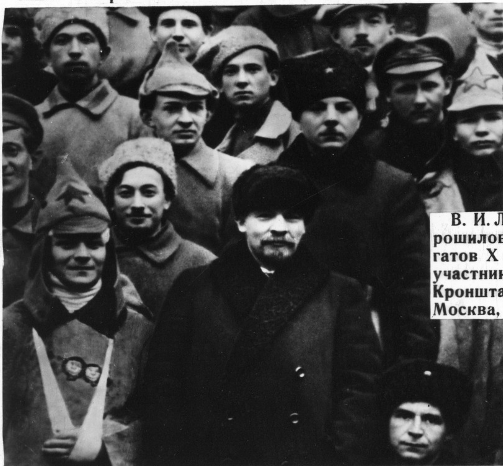
В. И. Ленин и К. Е. Ворошилов в группе делегатов X съезда РКП(б) — участников подавления Кронштадтского мятежа. Москва, март 1921 года.