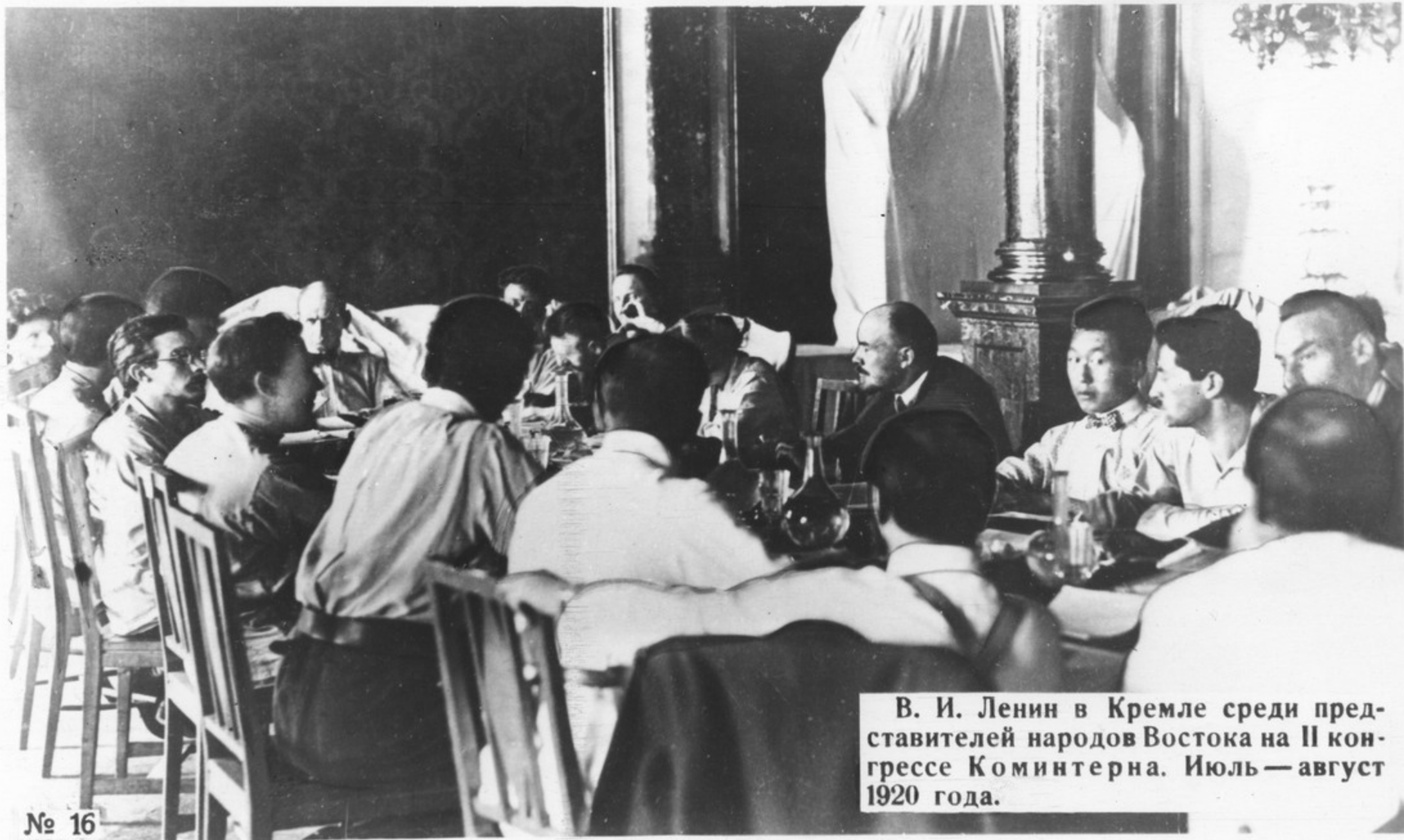
В. И. Ленин в Кремле среди представителей народов Востока на II конгрессе Коминтерна. Июль — август 1920 года.