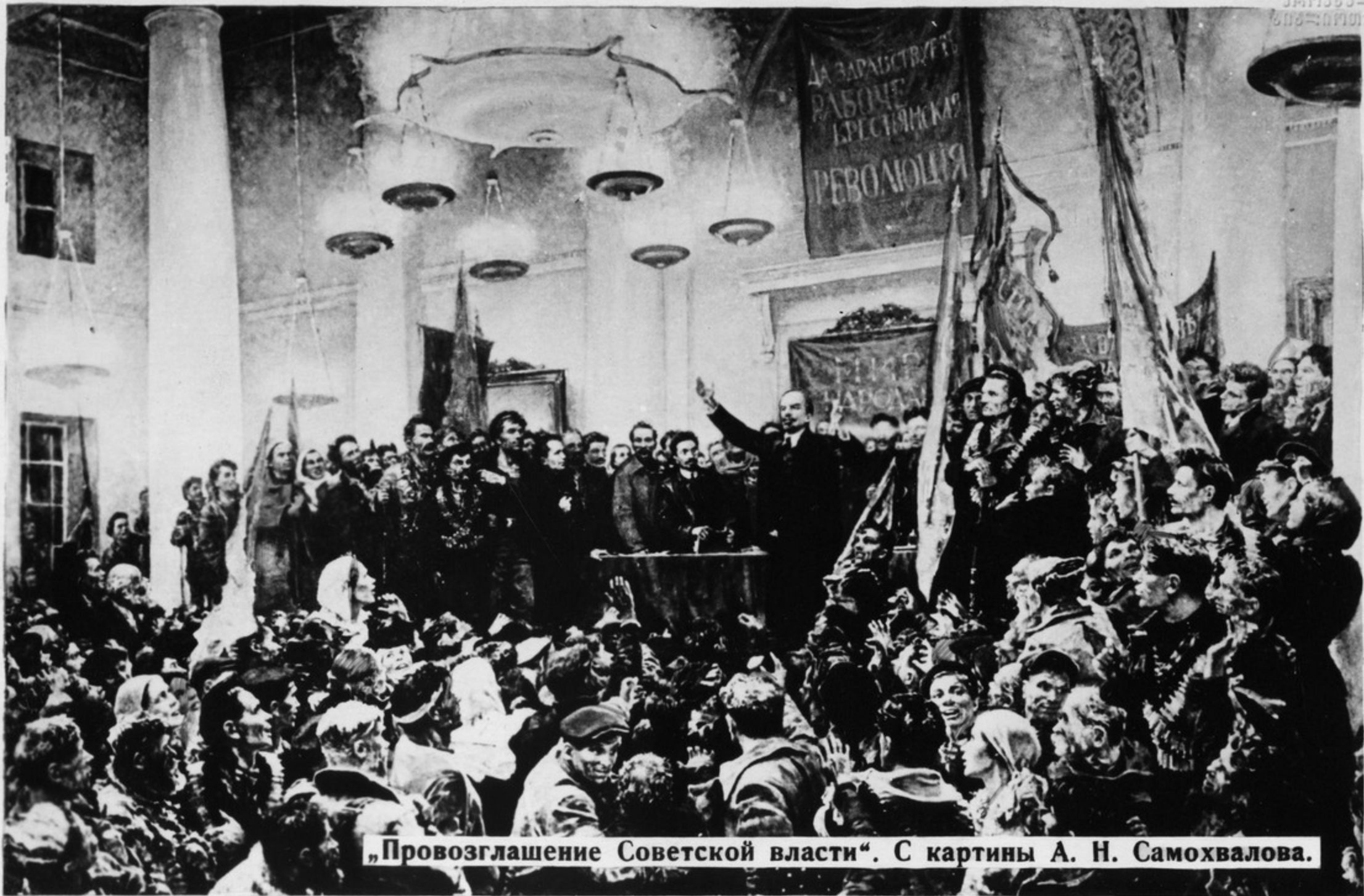
„Провозглашение Советской власти“. С картины А. Н. Самохвалова.

25—27 октября 1917 года в Смольном состоялся Второй Всероссийский съезд Советов. С докладами о мире и земле выступил Ленин. На съезде было образовано рабоче-крестьянское правительство во главе с В. И. Лениным. № 2