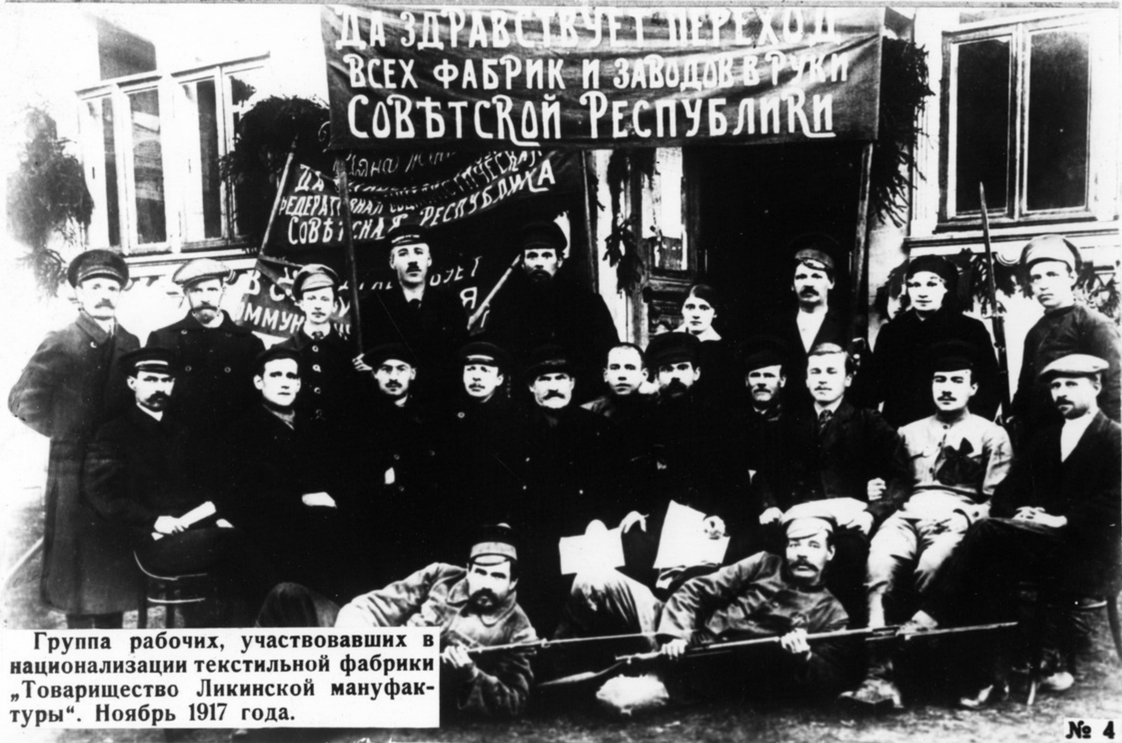
Группа рабочих, участвовавших в национализации текстильной фабрики „Товарищество Ликинской мануфактуры“. Ноябрь 1917 года.