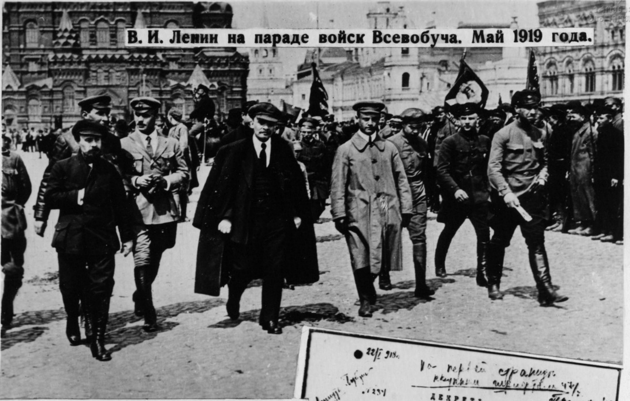
В. И. Ленин на параде войск Всевобуча. Май 1919 года.