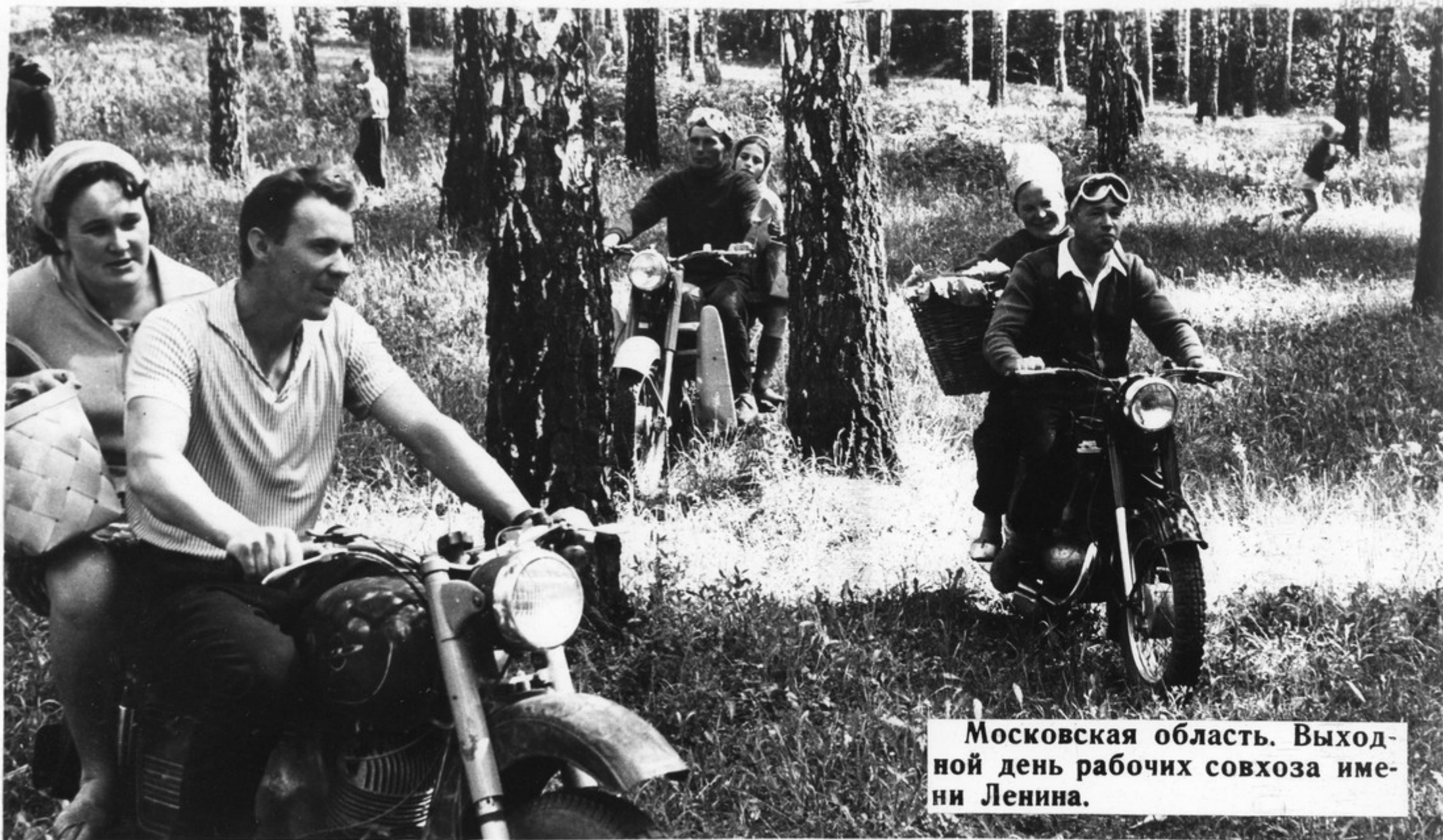
Московская область. Выходной день рабочих совхоза имени Ленина.

„Рост социалистического производства создал прочную базу для повышения материального благосостояния и культуры советского народа.