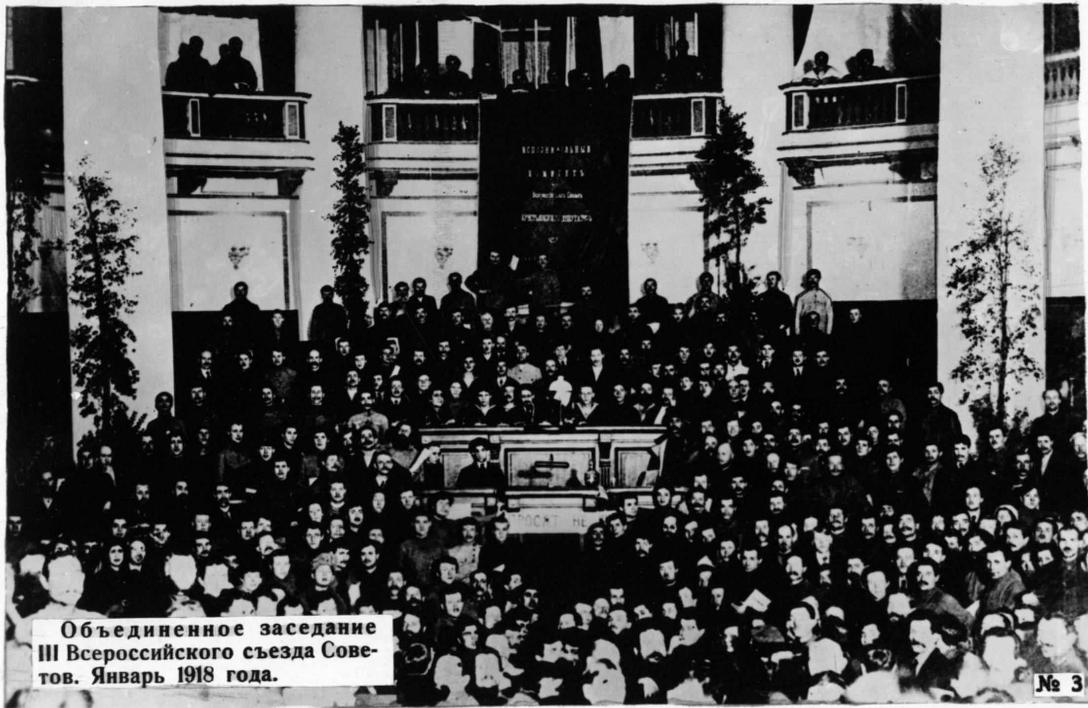
Объединенное заседание III Всероссийского съезда Советов. Январь 1918 года.