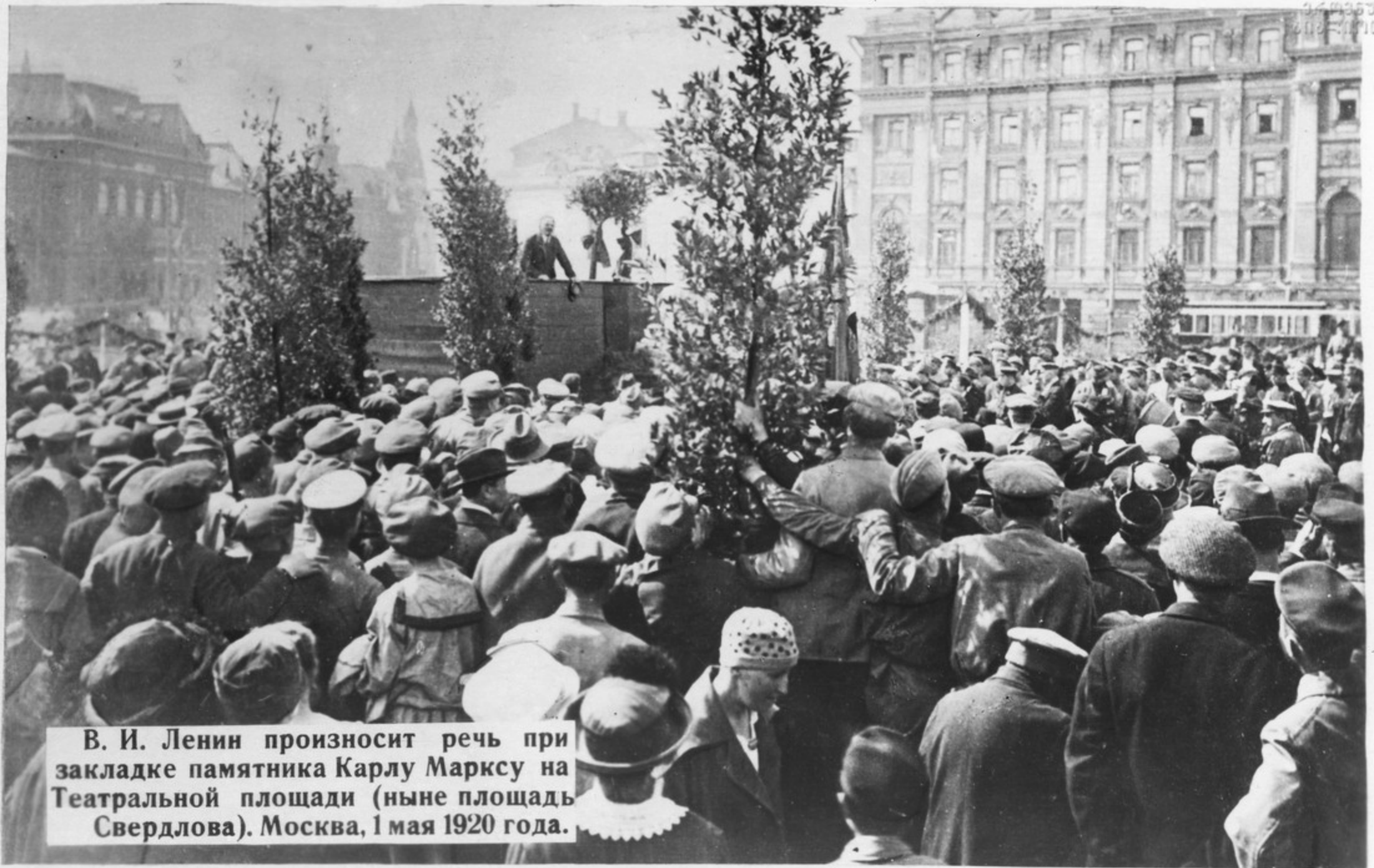
В. И. Ленин произносит речь при закладке памятника Карлу Марксу на Театральной площади (ныне площадь Свердлова). Москва, 1 мая 1920 года.

Несмотря на огромную занятость важнейшей государственной деятельностью, В. И. Ленин часто, иногда по 2—3 раза в день, выступал на митингах и рабочих собраниях.