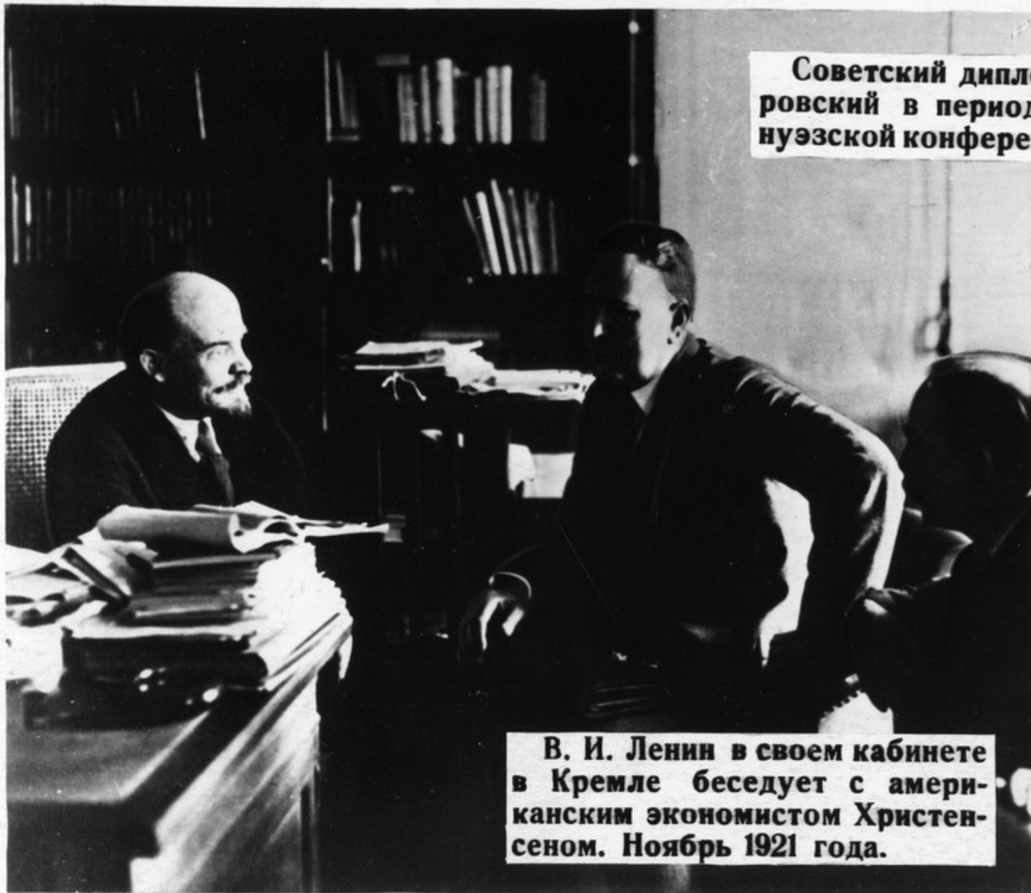
В. И. Ленин в своем кабинете в Кремле беседует с американским экономистом Христенсеном. Ноябрь 1921 года.

Великая заслуга В. И. Ленина состоит в том, что он разработал принципы внешней политики Советского государства,