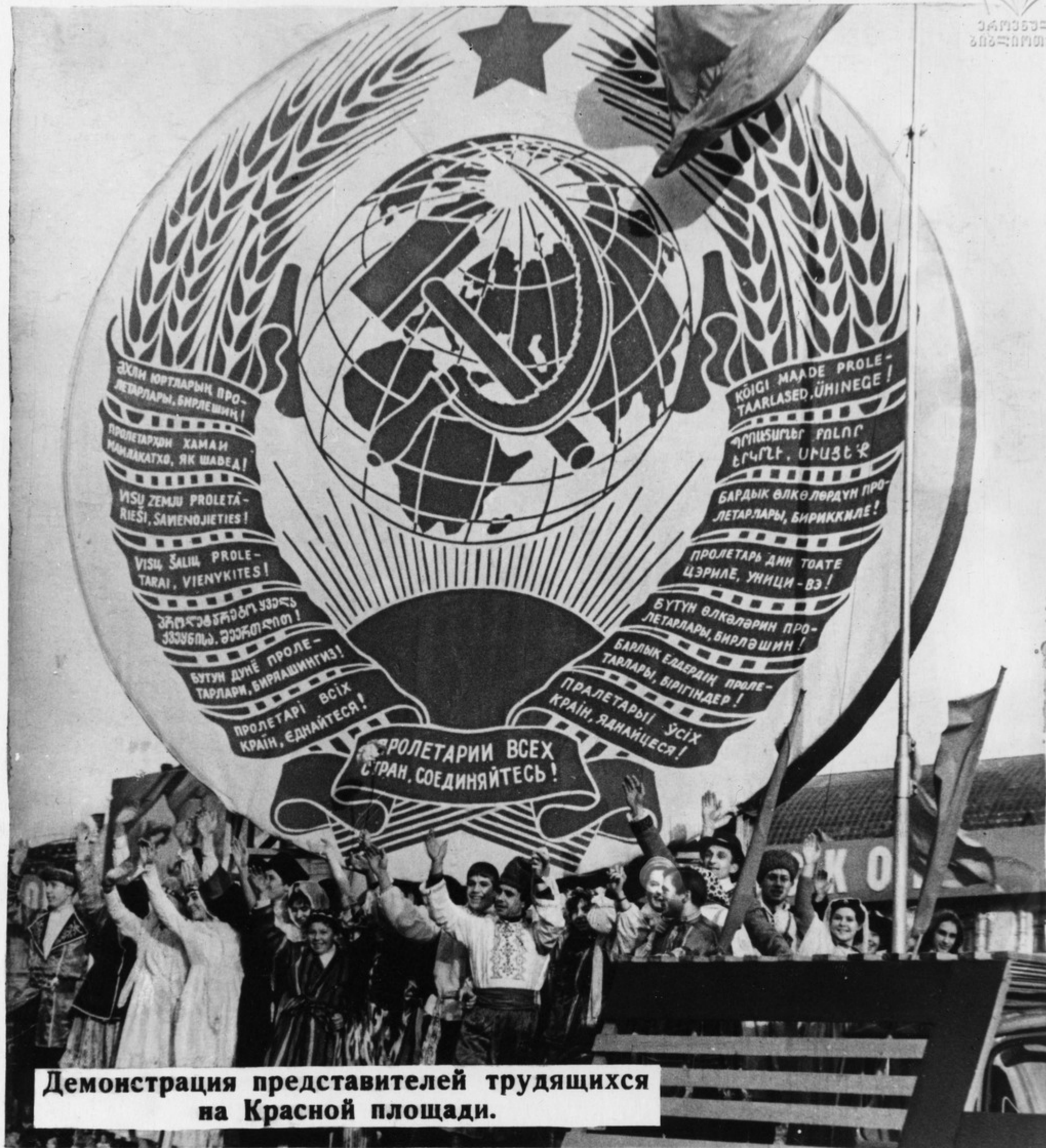
Демонстрация представителей трудящихся на Красной площади.

Осуществляя ленинскую программу по национальному вопросу, Советское государство в ходе социалистического строительства обеспечило сплочение всех наций нашей Родины в нерушимое социалистическое братство равноправных народов. Дружба народов СССР — основа могущества и непобедимости советского многонационального государства.