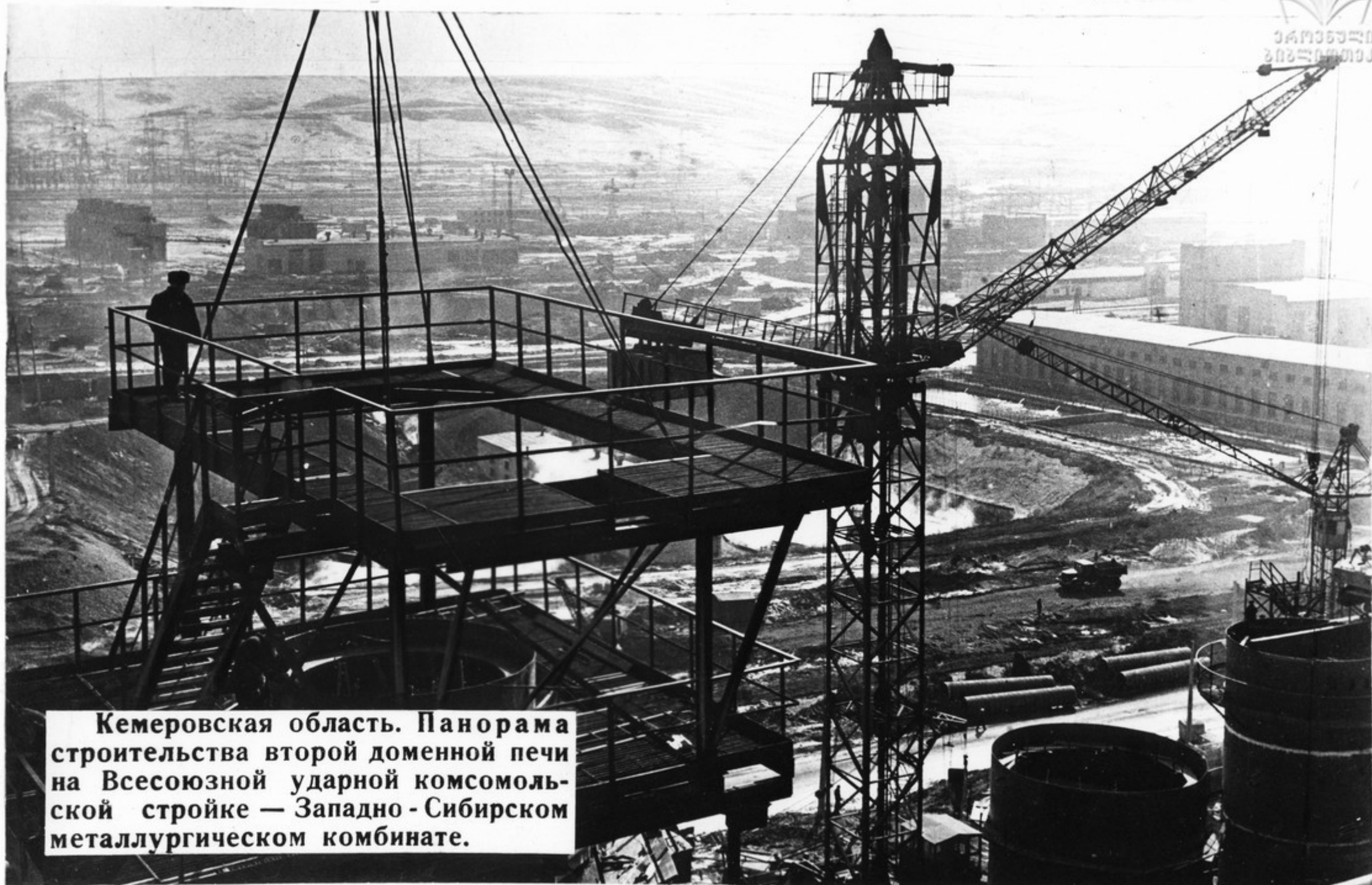
Кемеровская область. Панорама строительства второй доменной печи на Всесоюзной ударной комсомольской стройке — Западно-Сибирском металлургическом комбинате.

Советский народ под руководством Коммунистической партии претворил в жизнь ленинский план индустриализации страны.