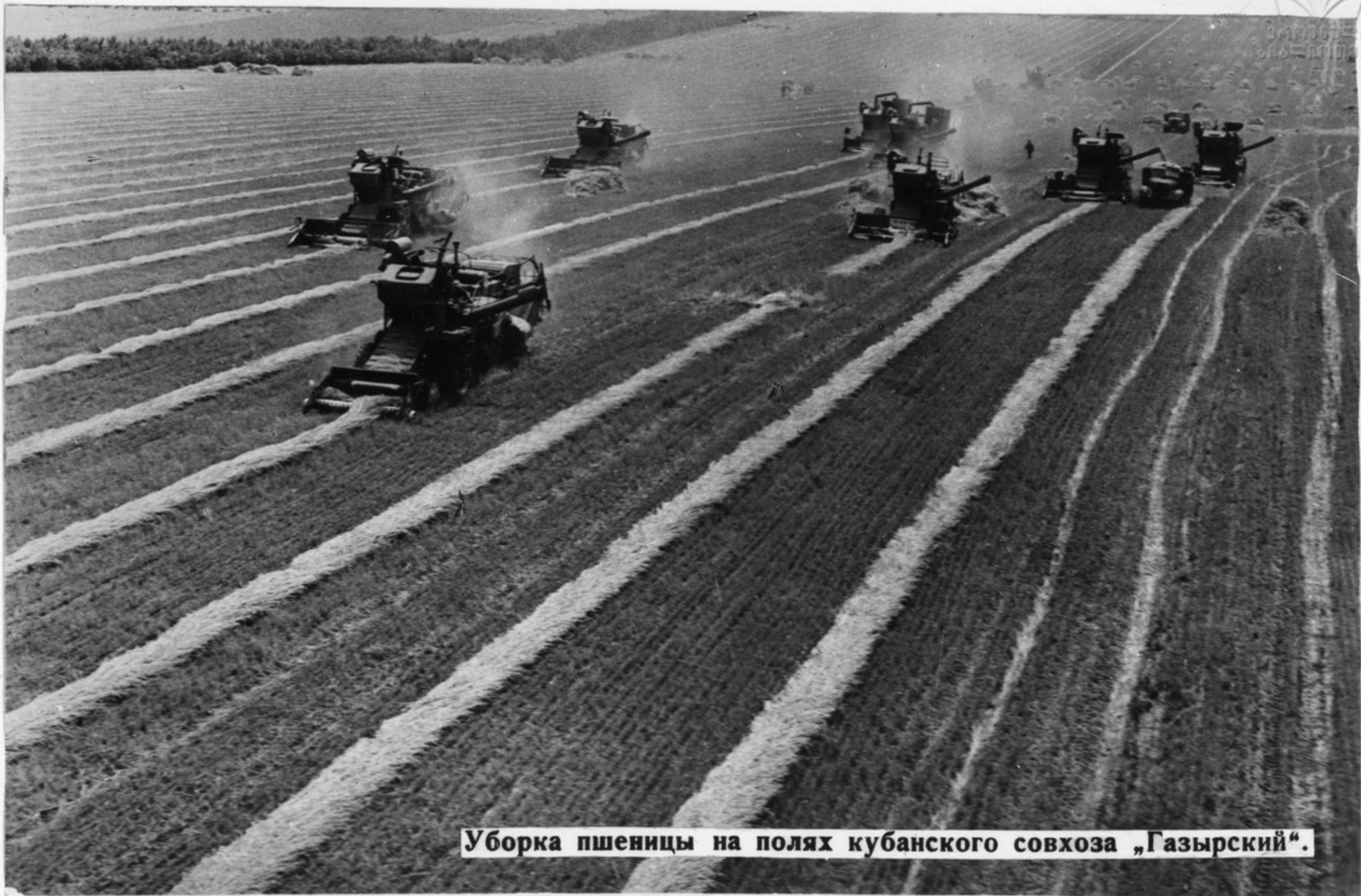
Уборка пшеницы на полях кубанского совхоза „Газырский“.

Ленинский кооперативный план был положен в основу социалистического переустройства сельского хозяйства. Миллионы мелких единоличных крестьянских производителей объединились в колхозы, стали на путь социализма. № 21