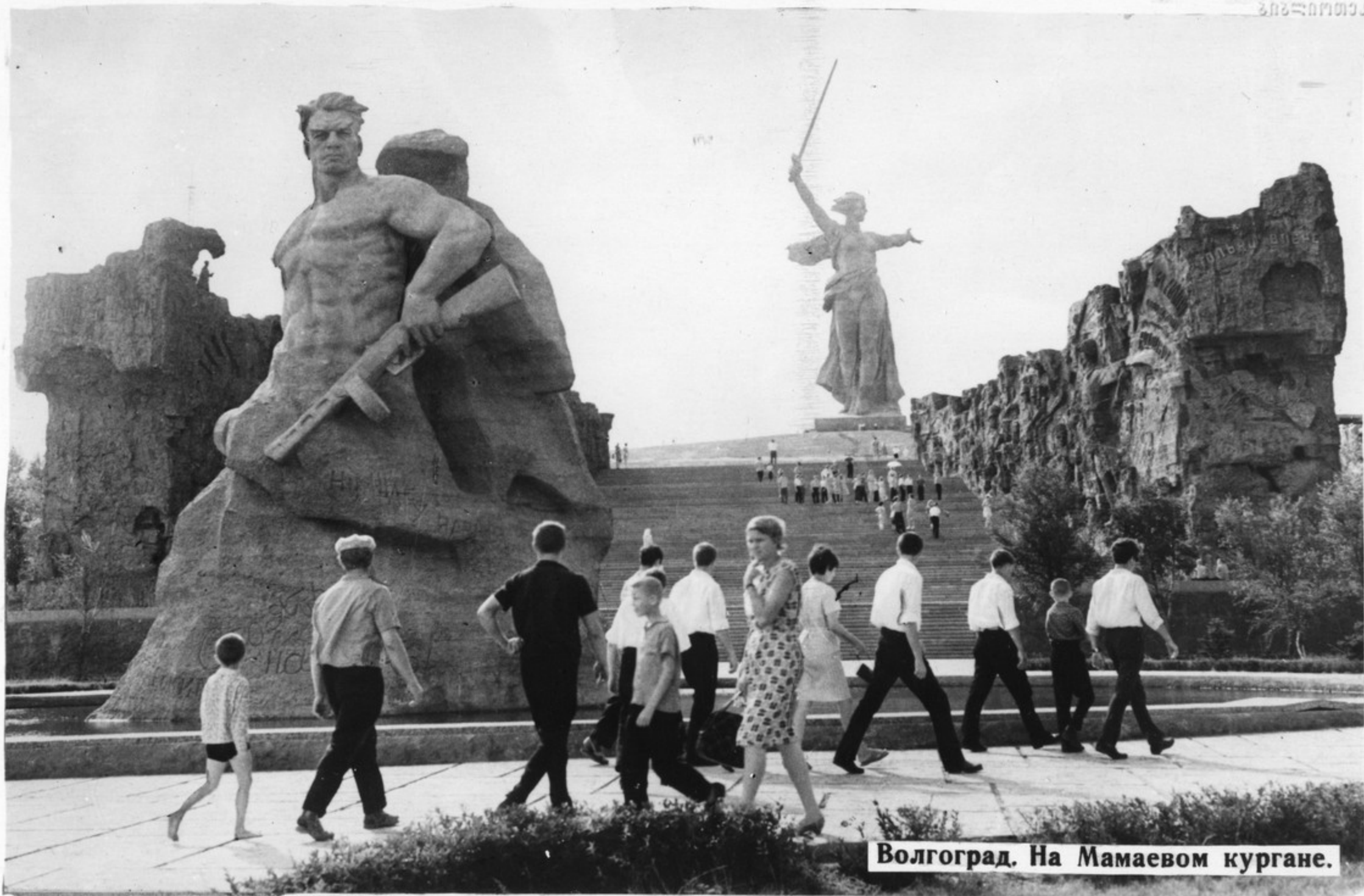
Волгоград. На Мамаевом кургане.

Великая Отечественная война явилась серьезным испытанием для советского социалистического государства. В гигантском столкновении с фашизмом победил советский общественный и государственный строй.