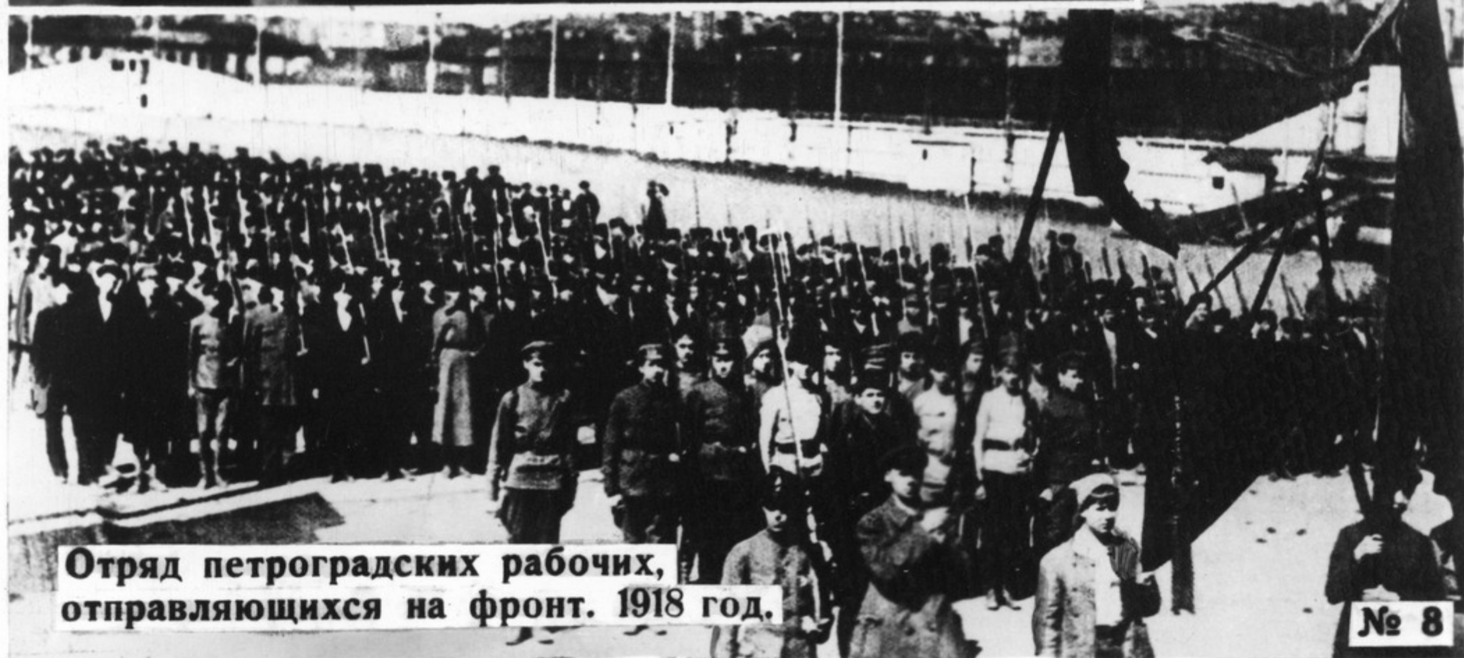
Отряд петроградских рабочих, отправляющихся на фронт. 1918 год.