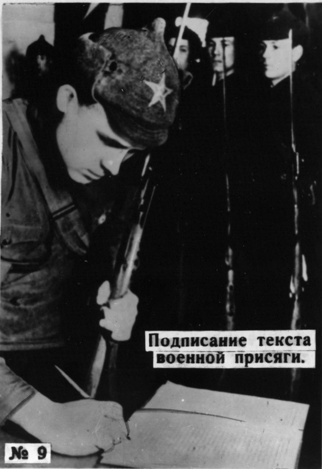
Подписание текста военной присяги.

22/7 1918. Декрет Совета Народных Комиссаров. 11 января 1918 г. г. Петроград. Старая армия служила орудием классовых интересов буржуазии. С переходом власти к рабочим и крестьянам возникла необходимость создания новой армии, которая является оплотом Советской власти в настоящее время, и фундаментом для защиты революции и борьбы за мир и демократию в Европе. В виду этого Совет Народных Комиссаров постановляет: организовать новую армию под названием "Рабоче-Крестьянская Красная Армия", на следующих основаниях: 1/ Рабоче-Крестьянская Красная Армия создается для защиты революции и борьбы за мир и демократию в Европе. Доступ в ее ряды открыт для всех граждан Российской Республики не моложе 18 лет. В Красную Армию поступает каждый кто готов отдать свои силы, свою жизнь за завоевание Октябрьской Революции, и власти Советов. Для вступления в ряды Красной Армии необходима рекомендация: Военных Комитетов или Общественных Демократических организаций, стоящих на платформе Советской власти, партийных или профсоюзных организаций или по крайности