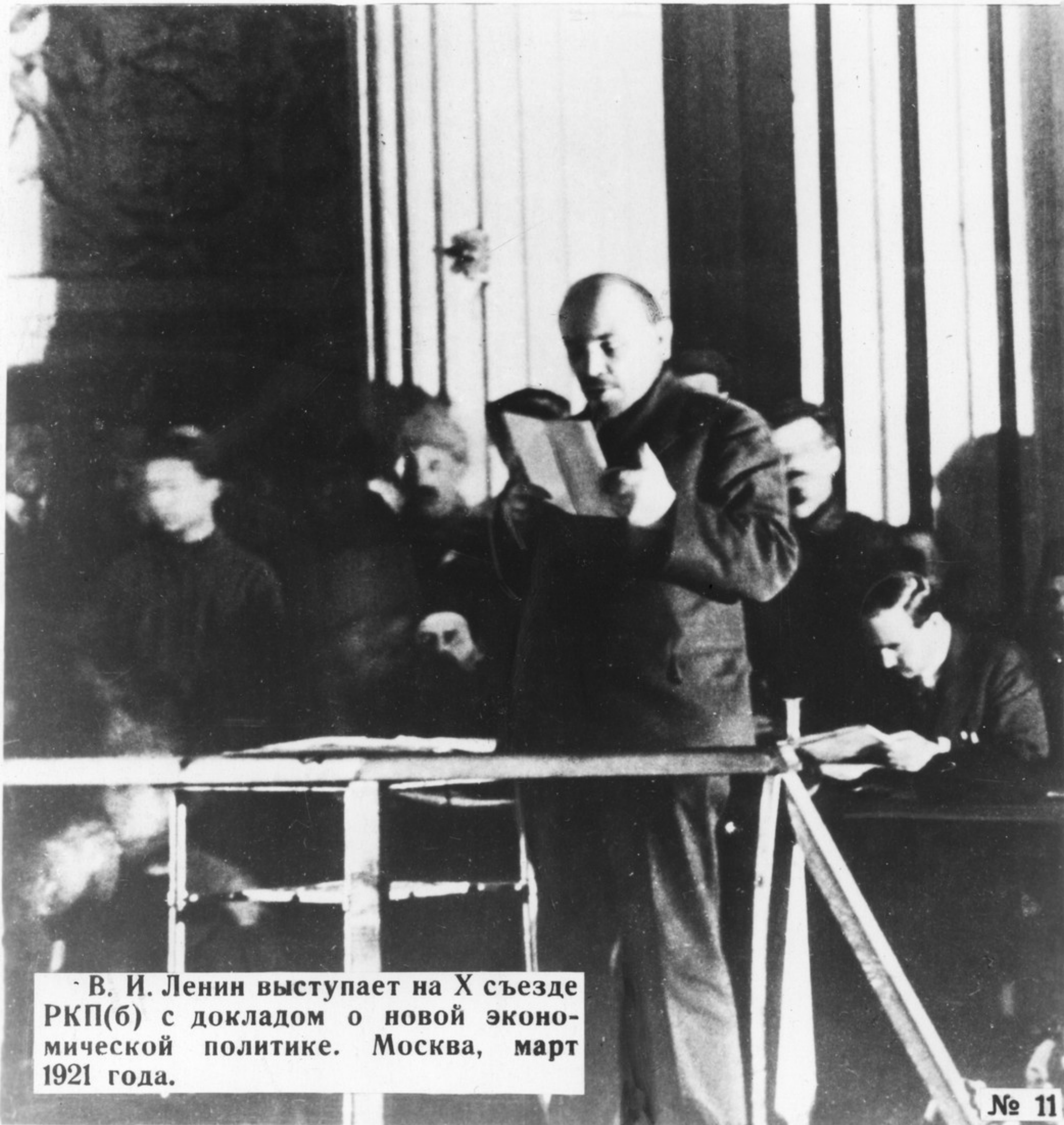
В. И. Ленин выступает на X съезде РКП(б) с докладом о новой экономической политике. Москва, март 1921 года.