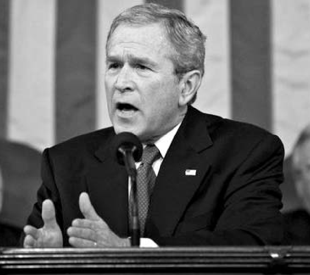
ჭორჭ ბუმის წლევედელი მიმართვა ამბიციური და ოპტიმიზმით სავსე გამოცდა.