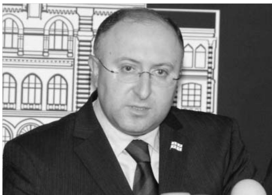
საგარეო უწყების ხელმძღვანელმა საკუთარი ხედვა და ღირებულებები გააცნო მასმედიაში.