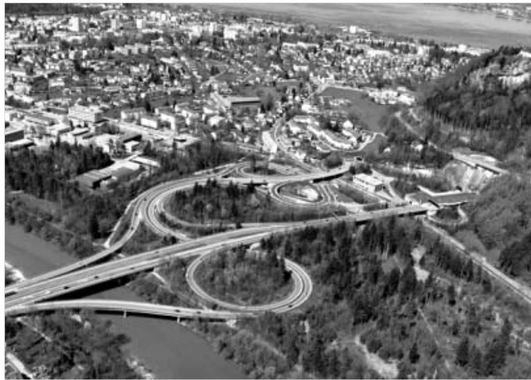
მაღე საქართველოში მსგავს ავტობანებზე ივლიან.