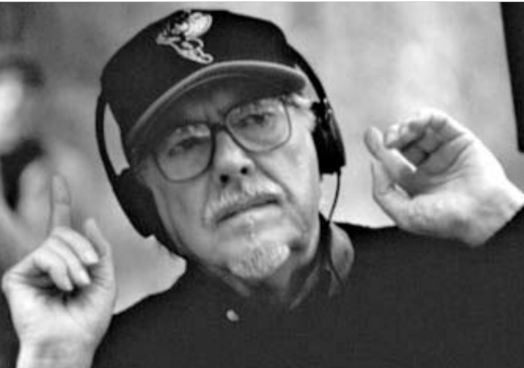
ბილმორ სტარუა სა. კორ. აპრ. 07

ცნობილი ამერიკელი კინორეჟისორმა რობერტ ოლტმენმა კინოს ფინალმდე ხუთჯერ მიაღწია - 1970 წელს ფილმ MASH-ით, 1975 წელს "ნეშვილით", 1992 წელს "მთაშით", 1993 წელს "შორტ კაუსით", 2001 წელს "გოსფორდ პარტი". ხუთივე ფილმი სხვადასხვა წარმომადგენელი დასახლებებისა და მსოფლიო კინოს ისტორიაში.