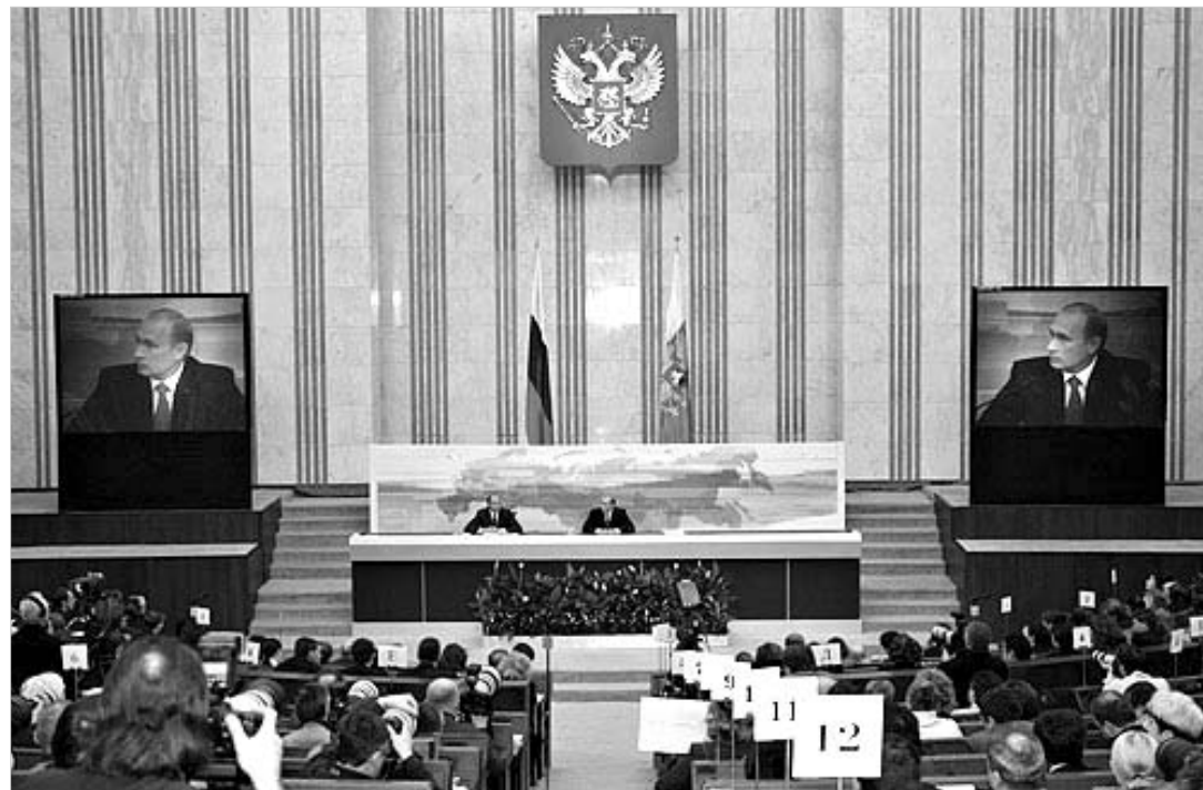
რუსი და უცხოელი ჟურნალისტებისათვის გამართულ პრესკონფერენციაზე.