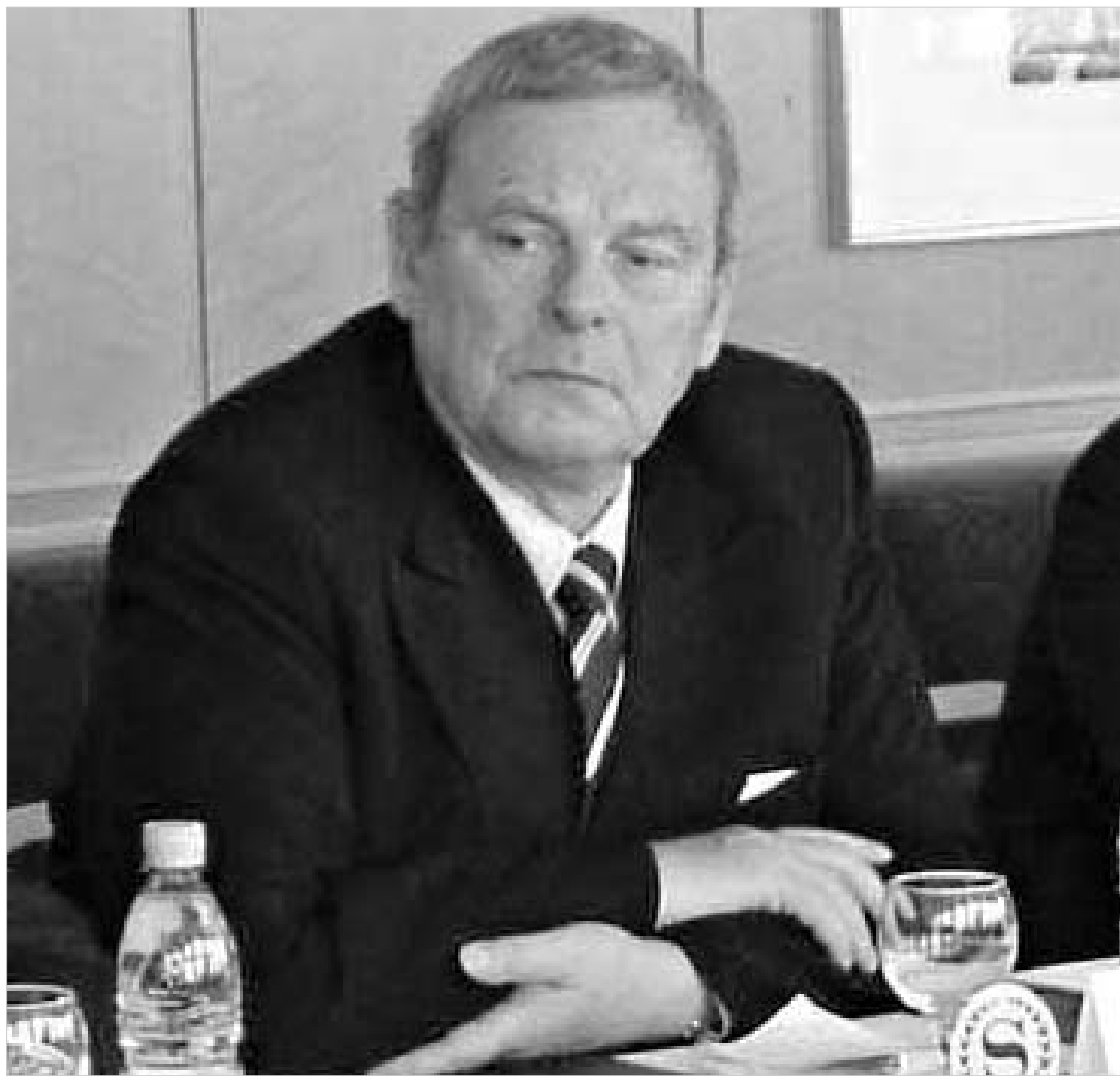
ჩვენ, ევროპელები, ქართველების გვერდზე ვდგავართ.

გერმანელი დიპლომატის შეფასებით, საქართველოსთვის ენერჯის მიწოდების უზრუნველყოფა უპასუხისმგებლო და ლარული ქმედება იყო. "უპასუხისმგებლო, რადგანაც ვინც ეს ჩაიდინა, არ უფიქრია იმ შესაძლო შედეგებზე, რასაც ამგვარი ქმედება გამოიწვევდა. ეს იყო ლარული საქციელი, რადგანაც უმეტესად საზოგადოების ყველაზე დაუცველ წევრებზე იქონია გავლენა. კიდევ ერთხელ აღვნიშნავ, რომ ჩვენ, ევროპელები, ქართველების გვერდზე ვდგავართ ამ მიმე დღეს," - განაცხადა უკვე მრამმა სამხრეთ კავკასიაში ევროკავშირის სპეციალური წარმომადგენლის პეიკი ტალეიტის გამოსამშვიდობებელ პრესკონფერენციაზე.