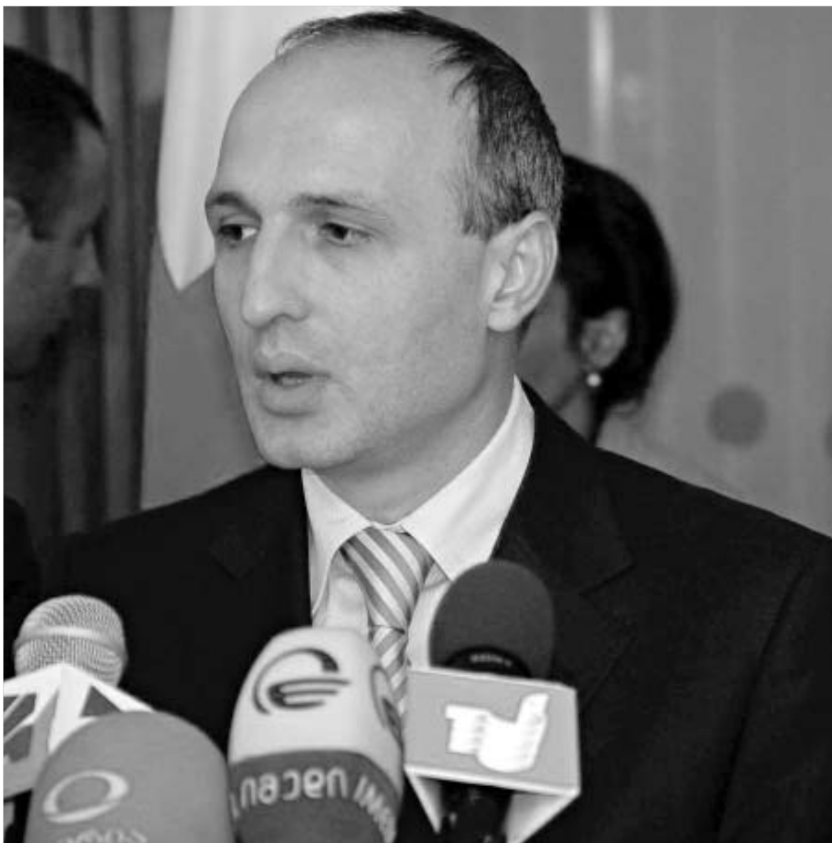
ვანო მერაბიშვილი ამყობს საკუთარი იდეით.

შს მინისტრის ვანო მერაბიშვილის პირადი ინიციატივით, ჯიბის ტელეფონების გამოყენების შესახებ ვიწროვდება. მობილური ტელეფონების ტელეფონი მოგებიანი აღარ იქნება. შს მინისტრის ინიციატივით, მოპარული მობილური ტელეფონი ქსელიდან გაითიშება და ის გამოუსადეხარი გახდება.