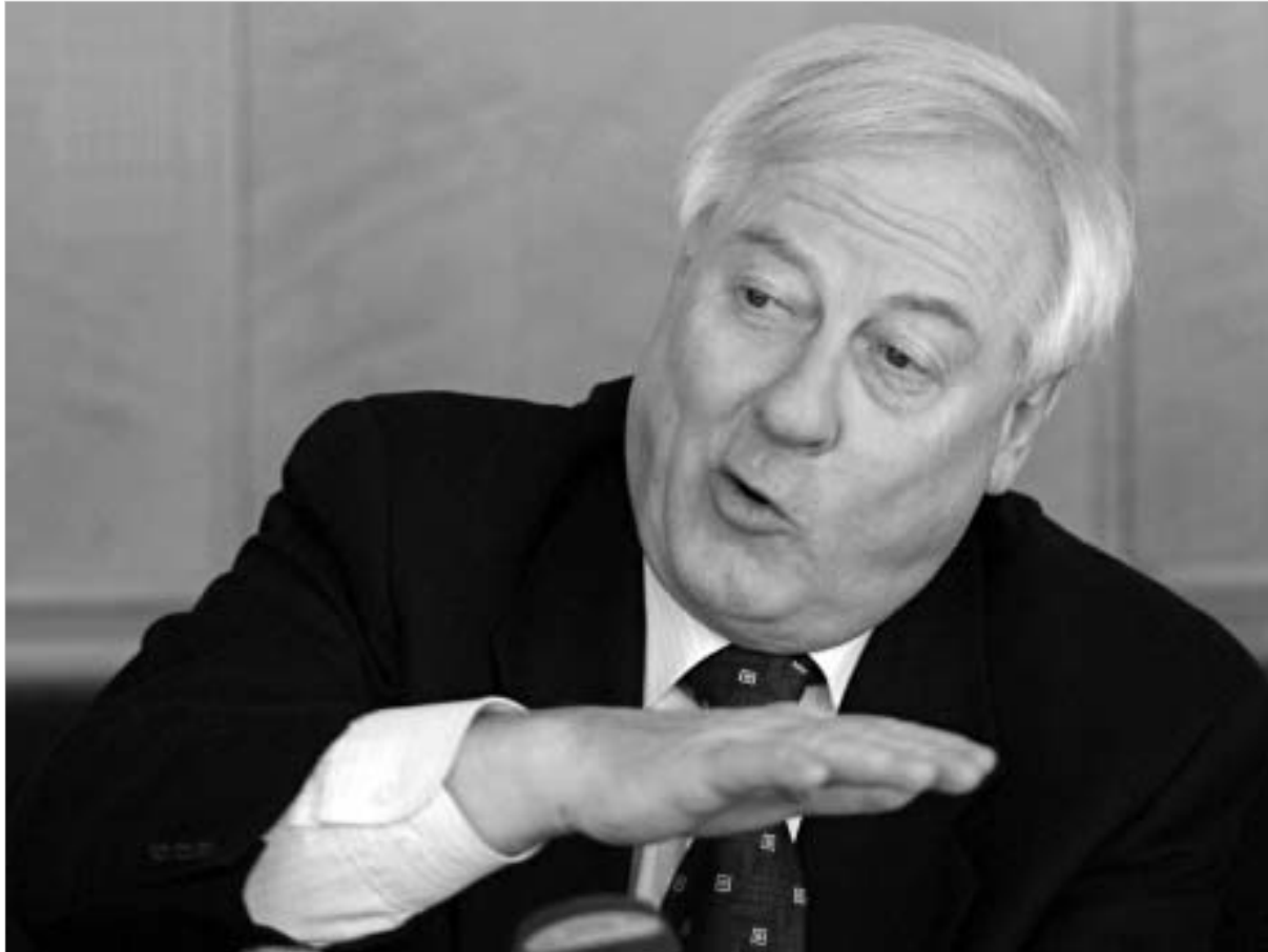
ჰეიკი ტალვიტი: გარეშე მხარეებს მხოლოდ მხარდაჭერა შეუძლიათ - პრობლემის მოგვარების ერთადერთი გზა საქართველოსა და სამხრეთ ოსეთს შორის შეთანხმების მიღწევამდე მდგომარეობა.

ჰეიკი ტალვიტის ამჟამინდელი ვიზიტი, სამხრეთ კავკასიაში ევროკავშირის სპეციალური წარმომადგენლის რანგში, უკანასკნელი გამოდგა. დაახლოებით, 2,5 წლის განმავლობაში აღნიშნულ თანამდებობაზე მომუშავე ფინელი დიპლომატის თქმით, მისი ბოლო ოფიციალური ვიზიტის მიზანი იყო, გაეროკავშირის კონკრეტულად რა როლის შესრულება შეუძლია ევროკავშირის სამხრეთ ოსეთის კონფლიქტის მოგვარებაში. "ხალხს უნდა ცვლილებების..."; "რისკი აუცილებელია..." "გარეშე მხარეებს მხოლოდ მხარდაჭერა შეუძლიათ - პრობლემის მოგვარების ერთადერთი გზა საქართველოსა და სამხრეთ ოსეთს შორის შეთანხმების მიღწევამდე მდგომარეობა, - ასეთი პათოსით დაემშვიდობა ტალვიტი ქართველ ჟურნალისტებს და, ისიც გაუმხილა, რომ მის ნაცვლად აუცილებლად მაღალი რანგის დიპლომატი ჩამოვა, რაც კიდევ ერთხელ ადასტურებს რეგიონის მნიშვნელობის ზრდას ევროკავშირისთვის.