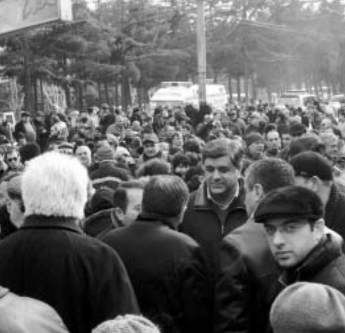
საქართველოს პარლამენტისა და თბილისის საკრებულოს წევრების ინიციატივით, დედაქალაქში, ვაკე-საბურთალოს რაიონში, 15 თებერვლიდან შესაძლოა, რუსეთის შეიარაღებული ძალების მიმართ საპროტესტო აქცია გაიხატოს. აქციის მონაწილეები აცხადებდნენ, რომ ცენტრალურ განსაღებზე მომხდარი აფეთქება რუსეთის მხრიდან საქართველოს შტაბთან საპროტესტო აქცია გაიხატოს.

საქართველოს პარლამენტისა და თბილისის საკრებულოს წევრების ინიციატივით, დედაქალაქში, ვაკე-საბურთალოს რაიონში, 15 თებერვლიდან შესაძლოა, რუსეთის შეიარაღებული ძალების მიმართ საპროტესტო აქცია გაიხატოს. აქციის მონაწილეები აცხადებდნენ, რომ ცენტრალურ განსაღებზე მომხდარი აფეთქება რუსეთის მხრიდან საქართველოს შტაბთან საპროტესტო აქცია გაიხატოს. აქციის მონაწილეები აცხადებდნენ, რომ ცენტრალურ განსაღებზე მომხდარი აფეთქება რუსეთის მხრიდან საქართველოს შტაბთან საპროტესტო აქცია გაიხატოს. აქციის მონაწილეები აცხადებდნენ, რომ ცენტრალურ განსაღებზე მომხდარი აფეთქება რუსეთის მხრიდან საქართველოს შტაბთან საპროტესტო აქცია გაიხატოს.