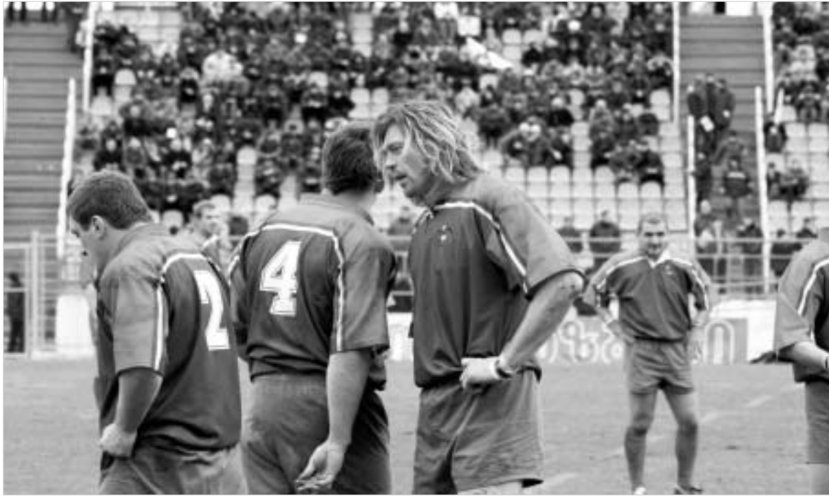
რუსი "დათვები" ზორცელაოსნებთან სათამაშოდ ემზადებიან.

4 თებერვალს თბილისში გაიმართება ერთა თასის წლებიანდელი გათამაშების პირველი მატჩი რაგბიში. ქართველი "პორცელაოსნები" რუს "დათვებს" უმასპინძლებენ. აღსანიშნავია, რომ საქართველოს ნაკრებმა გასული წლის გათამაშება პირველ ადგილზე დაასრულა და თუ წელსაც არ მოუკლებს ტემპს, მსოფლიო ჩემპიონატზე გასვლის რეალური შანსი ექნება.