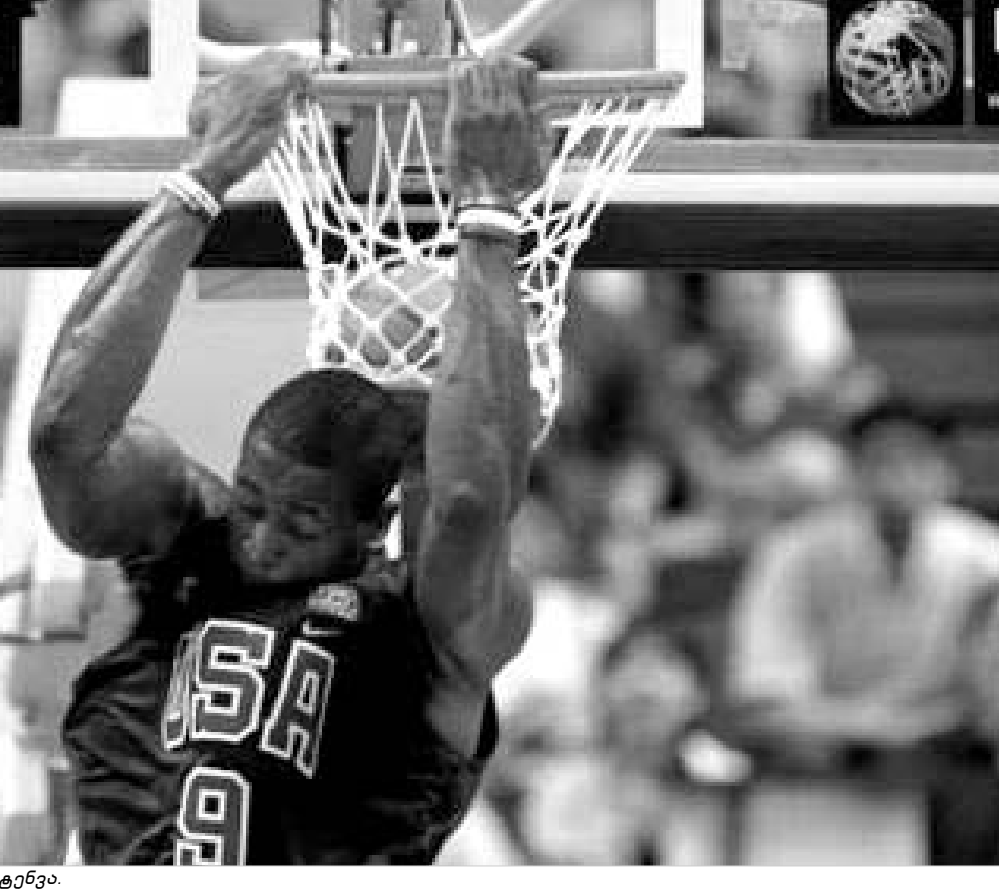
უეიდის მორიგი ჩატენა.

იაპონიაში გრძელდება მსოფლიოს საკალათბურთო ჩემპიონატი. უკვე არაერთხელ აღინიშნა, რომ ამ ტურნირზე უდიდეს ყურადღებას იპყრობს ამერიკის კალათბურთელთა ნაკრები. როგორც იცით, ეგრედ ნოდებულ "დრიმ ტიმს" კარგა ხანია არაფერი მოუგია და გასულ მსოფლიოს ჩემპიონატთან ერთად ათენის ოლიმპიური თამაშებზეც დათმო. ასე რომ, ამერიკელებისთვის იაპონიაში ოქროს მედალების მოპოვება ღირსების საკითხია. ამს-ს გუნდმა აი უკვე მესამე მატჩი გამართა და ჯერჯერობით ამ გუნდის სოლიდურ უპირატესობაში ეჭვი ვერაფერია შეიქცეს. აშჯერად ამერიკელთა მეტოქე სლოვენის ნაკრები იყო, მართალია ევროპელები შეძლებისდაგვარად გაუძლიანდნენ NBA-ს მეგავარსკვლეებით დაკომპლექტებულ გუნდს, მაგრამ ამერიკელი კალათბურთელების უმაღლესმა ოსტატობამ თავისი მაინც გაიტანა და შეხვედრა ამს-ს ნაკრების გამარჯვებით 114:95 დასრულდა. ამერიკელებმა გადაწყვეტი უპირატესობა მერე მეოთხედში მოიპოვეს, როდესაც დუეინ უეი-