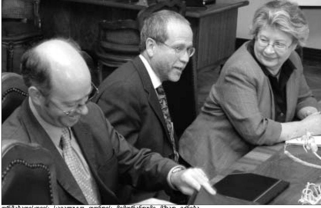
ორშაბათისთვის სავალუტო ფონდის შემორანდები მზად იქნება.