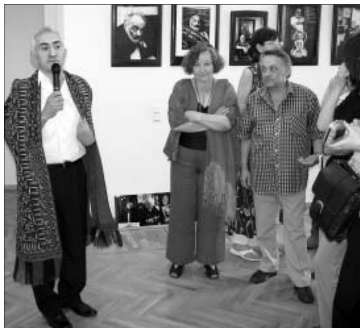
ეს ხალათი მეჩითოვმა 20 წლის წინ შეიძინა.

გოეთეს ინსტიტუტში გახსნილ ფოტოგამოფენას "ფარატანოვი - გამოფენა-მოგონება" თამამად შეიძლება იური მეჩითოვის შემოქმედების ერთერთი საუკეთესო ნიმუში ვუწოდოთ. ექსპოზიციას ძალიან მდიდარია - ლეგენდად ქცეული შემოქმედის პორტრეტები ორ და რბაზშია გამოფენილი. მათი შესახებ