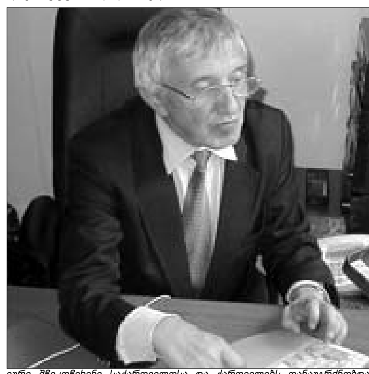
იური შრაქოვიჩი საქართველოსა და ქართველებს თანაგრძობდა.

ასე უთხრა ურნალისტებს თავის ერთ-ერთ უკანასკნელ პრესკონფერენციაზე რუსეთის დუმის დეპუტატმა, მწერალმა და ურნალისტმა იური შრაქოვიჩმა. მოსკოველმა ურნალისტებმა კარგად იცანს, რა ცეცხლსაც ეთამაშებოდა იურა - ადამიანისა და პოლიტიკოსის. ახლა ისინი გაქრება, მონებით ვაჭრობა და კორუფცია მაღალ სამხედრო