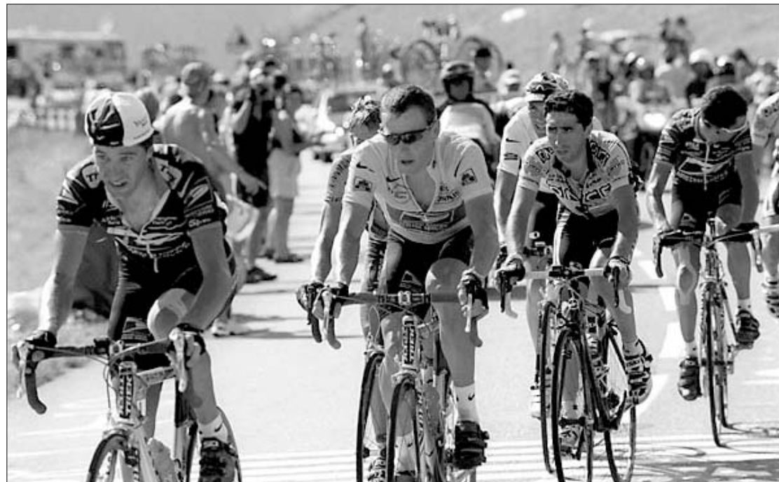
დელიდან პელოტონი საფრანგეთის გზებს გაუყვება.