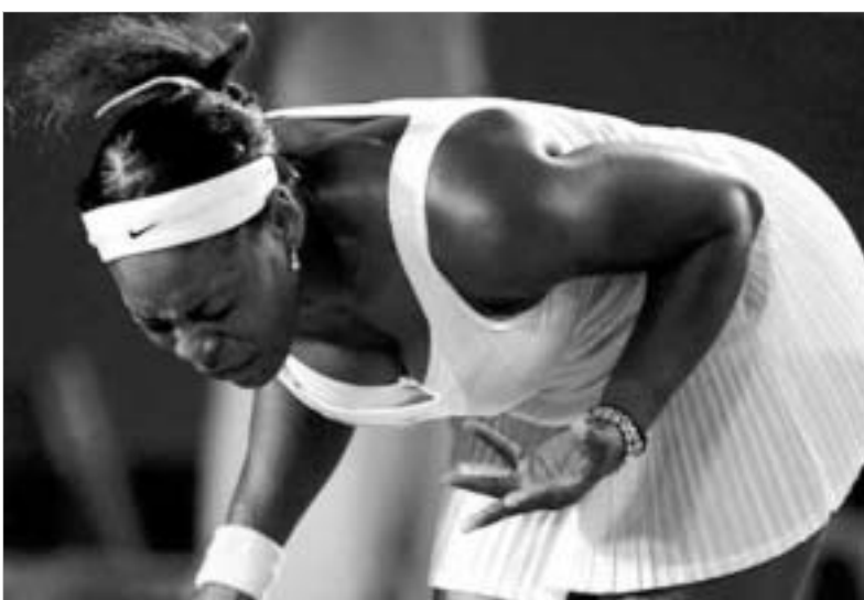
სერენა წელში გატყუხს

მელბურნის კორტებს დაემშვიდობა უილიამსაზის ოჯახის უმცროსი წარმომადგენელი - სერენა. ტურნირის მე-13 ნომერმა ორ სეტში დაუთმო გაზარეუბა სლოვაკ დანიელა პანტუჩოვას. ამერიკელს ამკარად ეტყობოდა, რომ რაღაც ნესრიგში არა იქვს. ეს ალბათ მუხლის ქრონიკული ტრავმაა, რომელიც სერენა უილიამსს კარიერის დასაწყისიდან აწუხებს და რომელმაც ჩოგბურთელს მელბურნში თეთრფალოზების საშუალება არ მისცა.