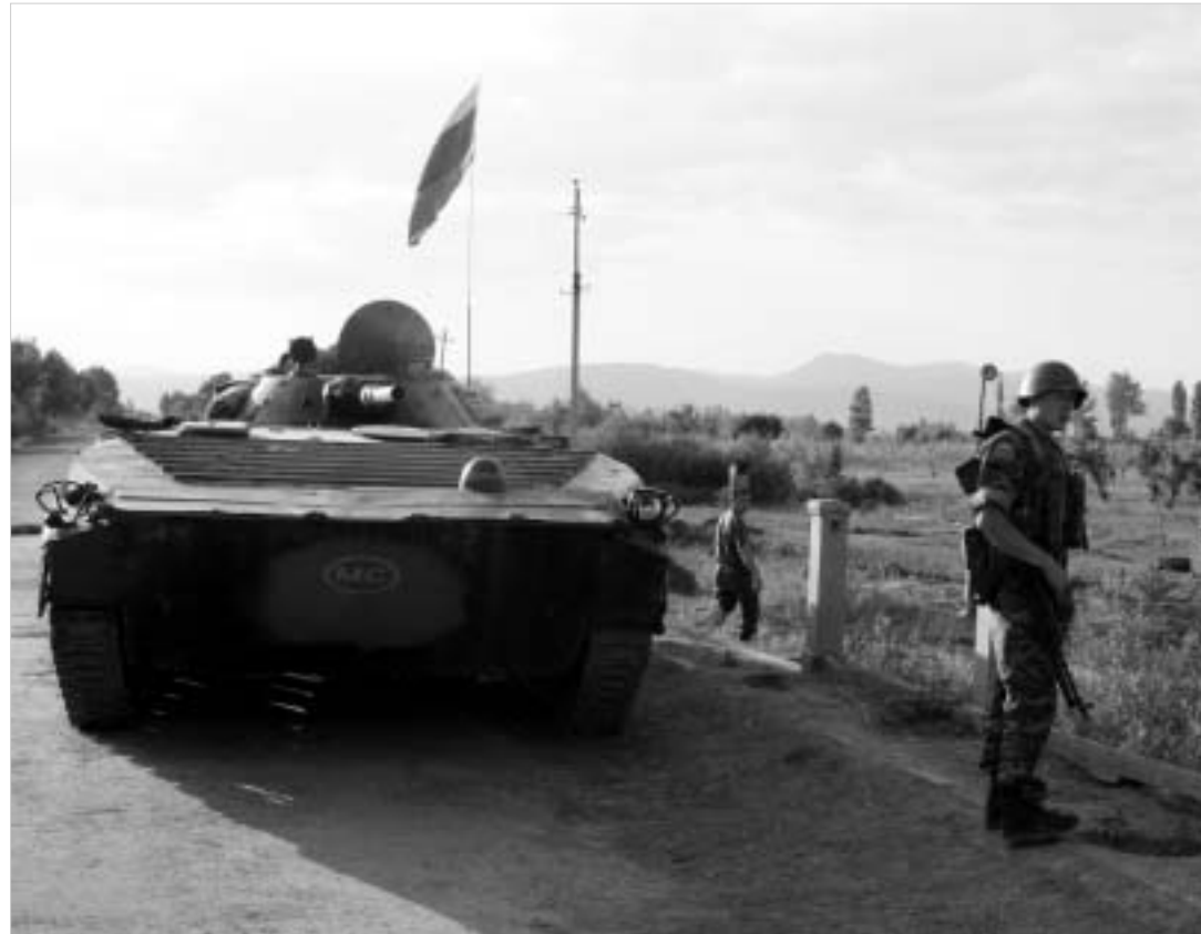
უახლოეს ხანში საქართველოს ხელისუფლება ასეთი მოსტების გაუქმებას მოითხოვს.