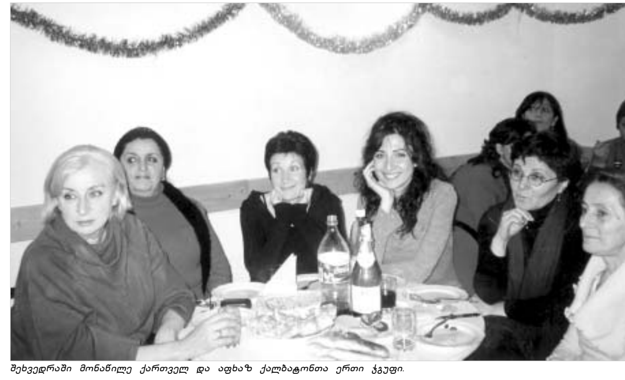
შეხვედრაში მონაწილე ქართველი და აფხაზი ქალბატონები ერთი კვლევა.