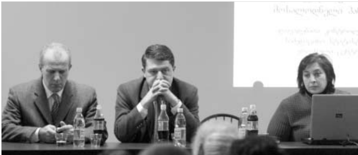
სამედიცინო უნივერსიტეტი ფრინველის კრიზისზე მსჯელობს.