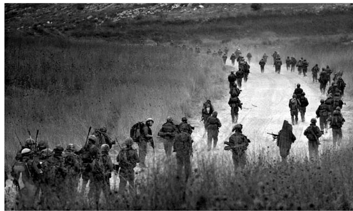
"ცაპალის" კარისკაცები მხოლოდ მას შემდეგ დატოვევენ სამხრეთ ლიხანს, რაც იქ საერთაშორისო სამშვიდობო მისია განლაგდება.

უშიშროების საბჭოს მიერ დოკუმენტის დამტკიცების მეორე დღესვე, ბერლინში მთავრობის საგანგებო სხდომა გაიმართა, სადაც მოინდუნეს მიღებული რეზოლუცია და იმედი გამოთქვა, რომ ისრაელიც თანახმა იქნებოდა მისი პირობების შესრულებაზე. თვით "ჰეზბოლამაც" კი მზადდებოდა გამოეთქვა დემოკრატიის რეზოლუციის მოთხოვნებს, რადიკალური მოძრაობის ლიდერმა პასან ნასრალამ შაბათს განაცხადა, რომ მისი შეიარაღებული დაჯგუფება მზადაა მხარი დაუჭიროს ცეცხლის შეწყვეტაზე შეთანხმებას, თუკი იგი გაერო-ს შუამავლობით დაიდება.