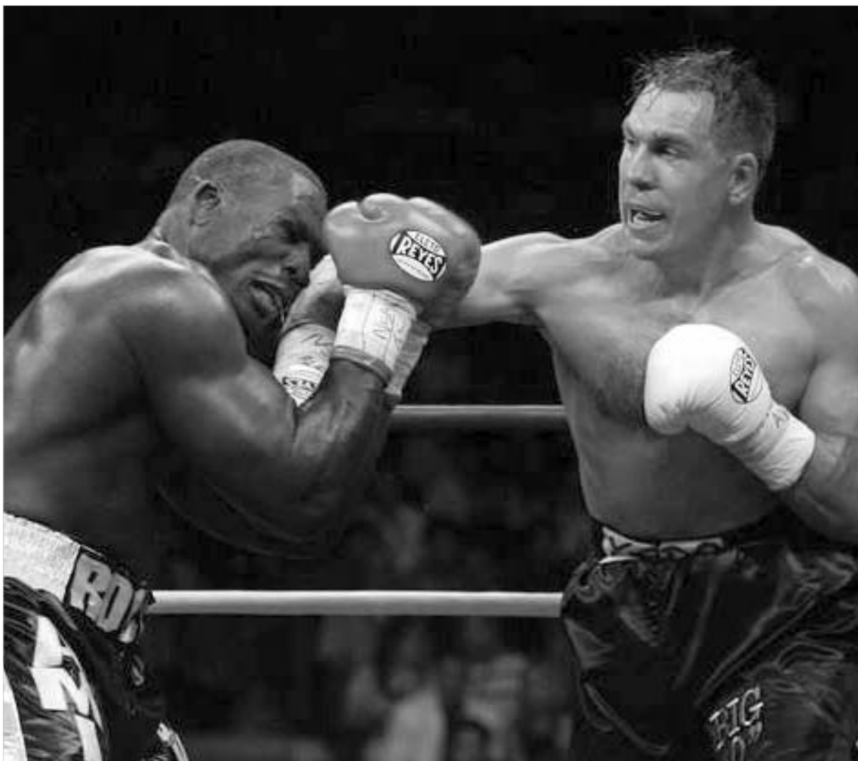
რაჰმანი ამერიკის იმედი გაუცრა.

დრო: შაბათისა და კვირის გასაყარი. ადგილი: კრივის მექა, ლას ვეგასი. ბრძოლის ველი: "ტომას & მაკ სენთერი". მოქმედი გმირები: მიმე წონაში ამერიკელთა უკანასკნელი მოპოვანი WBC მსოფლიოს ჩემპიონი აფრო-ამერიკელი ჰასიმ რაჰმანი. ტიტულის მოცილე ყაზახეთში დაბადებული და 1995 წელს ოკეანის ვალმა გადაბარებული წითელი არმიის ყოფილი ოფიცერი ოლეგ მასკაევი. და კიდევ, 12 რაუნდს გაგრძელებული ჩხუბი და ამერიკელთა მომტირალი სახეები.