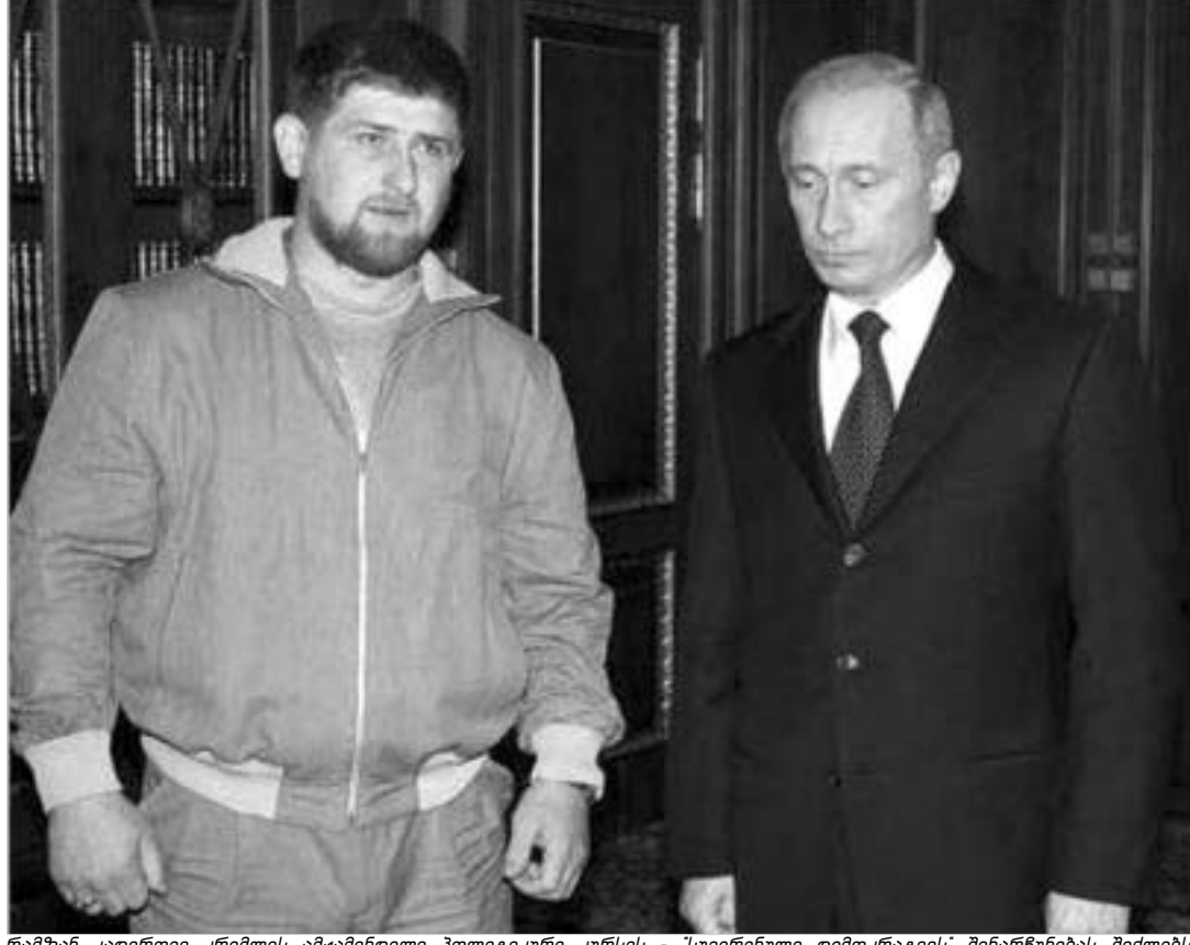
რამიზვილის კადრები კრემლის ამგანინდელი პოლიტიკური კურსის - "სეკრეტული დემოკრატია" შენარჩუნებას შეძლებს.