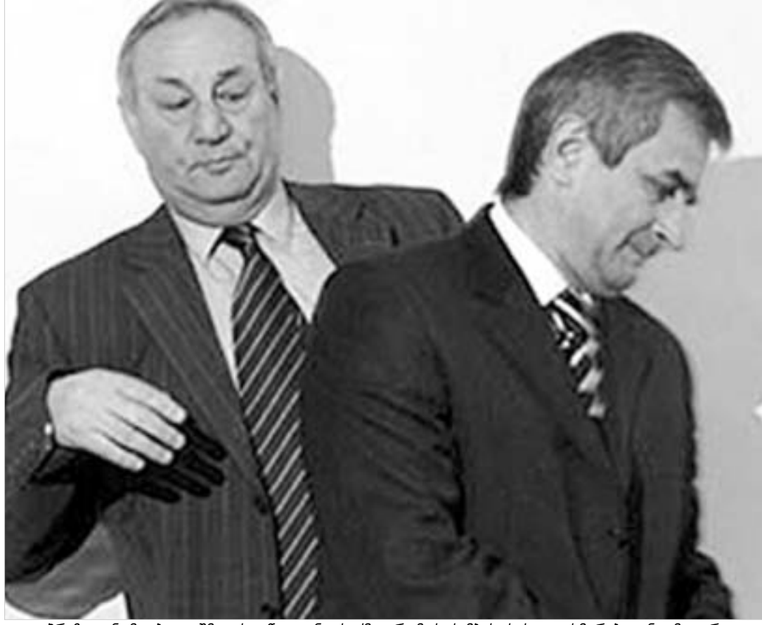
სერგეი ბაგაფისა და რაულ ხაჯიმბა ერთად. რომ ხაჯიმბას სახელი ხმარებიდან ამოვიარდა.