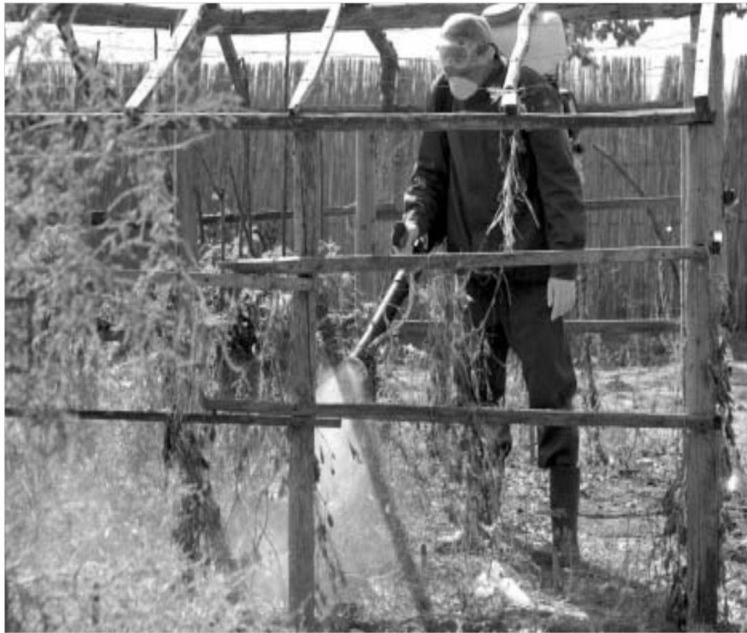
ფრინველის დახოცვის ადგილას, ლაბორატორიული კვლევის შედეგად ტარდება დეზინფექცია.