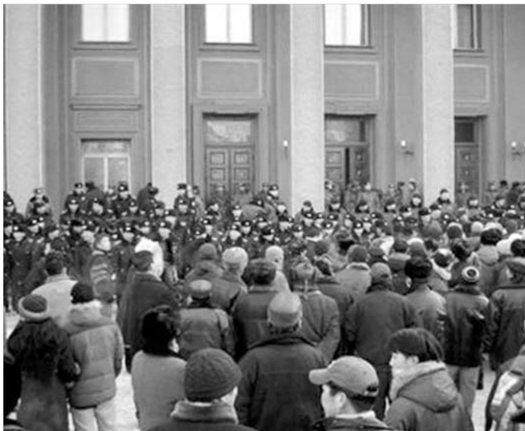
ყოფილი კომუნისტების მიერ მთავრობის დატოვებას სახალხო მღელვარება მოჰყვა.