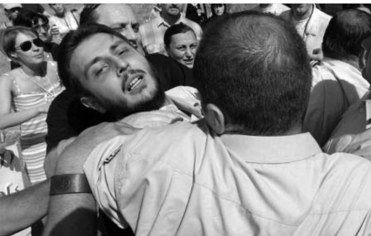
ინციდენტი არასამთავრობოებსა და მინდატურებს შორის.