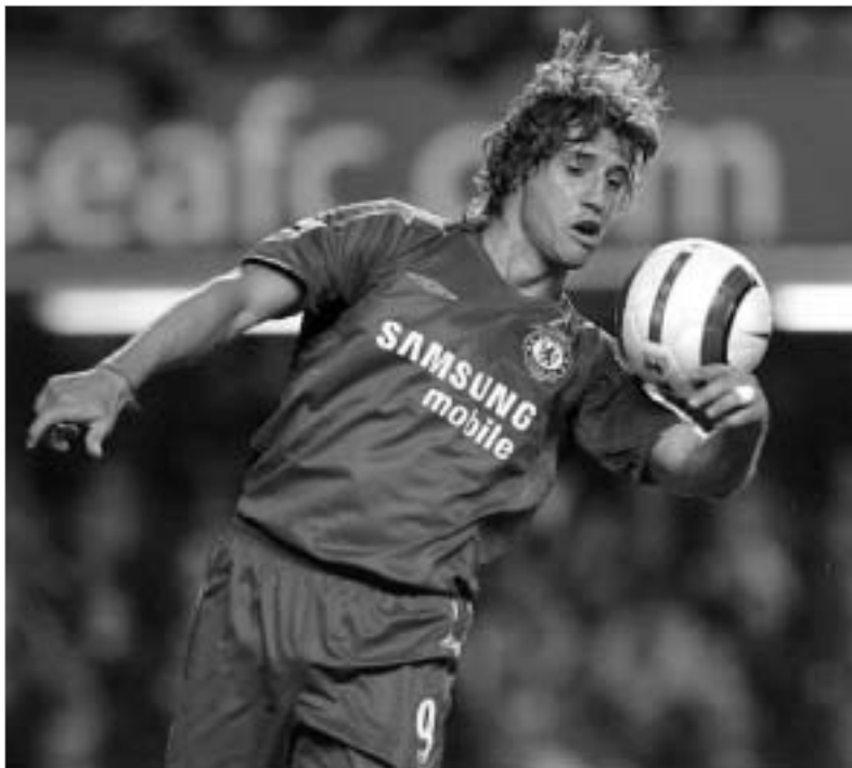
კრესპო "ინტერმა" ნიკყანა.

ერნან კრესპო ყველაფერზე თანახმა იყო, მათ შორის ხელფასის შემცირებაზეც, ოღონდ ლონდონის "ჩელსი" თანახმა ყოფილიყო მის გაშვებაზე. როგორც იქნა, ფეხბურთელის სურვილი დაკმაყოფილდა - ლონდონელმა არგენტინელი ისევ იქ გაუმეც, საიდანაც სამი წლის წინ თავად შეიძინეს. საუბარია მილანის "ინტერზე", რომელთანაც კრესპომ ორწლიანი კონტრაქტი გააფორმა, თუმცა თუ "არისტოკრატებს" მოესურებათ, 2006-07 წლების სეზონის დასრულებისთანავე ფეხბურთელს კვლავაც "სტემფორდ ბრიჯზე" დააბრუნებენ. 2003 წლის აგვისტოში რომან აბრამოვიჩმა არგენტინელის სანაცვლოდ "ნერიიპურის" ხელმძღვანელობას 16,8 მილიონი ფუნტი სტერლინგი ჩაუთვალა. თუმცა, ფეხბურთელმა ვერაფრით ვერ მოიკიდა ფეხი ლონდონური კლუბის შემადგენლობაში და მას მერე სულ უკმაყოფილო იყო "ჩელსიში" თამაშით. ახლა კი, როცა "სტემფორდ ბრიჯზე" "მილანის" ექსთავდამსხმელი ანდრეი შვეჩენკო მივიდა, ცხადი გახდა, რომ კრესპოს ადრინდელზე უფრო ხშირად მოუწევდა სკამზე ჯდომა. ამიტომაც ქვა აავდო და თავი შეუფიქრა - მილანის "ინტერში" გაშიშვითო. ცოტა ხნის წინ ერნან კრესპომ იტალიის მოქალაქეობა მიიღო და ამან კიდევ უფრო გაუმძაფრა სერია ა-ში თამაში სურვილი. "იტალიაზე უკონოდ ვარ შეყვარებული. ამ ქვეყანასთან ბევრი დაუფიქრარი მოკონება მაკავშირებს. ფული და წარმატება არაფერ შუაშია. ყველაფერზე თანახმა ვარ, ოღონდ ისევ "სან სიროზე" დაბრუნდებოდი. იტალია ის ადგილია, სადაც ცხოვრებით და თამაშით ბედნიერი ვარ. პენსიაზე გასვლა, საც სწორედ აპენინებზე ვაპირებ", - ამბობდა არგენტინელი. იტალიასთან ერნან კრესპოს მართლაც ბევრი მოკონება აკავშირებს. მისი საფეხბურთო კარი-