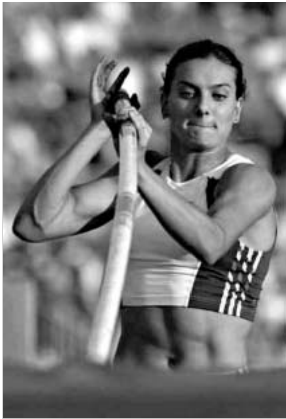
ელენა ისინბაევა და ვირგილიუს ალენკა ევროპაში საუკეთესოებად სცნეს.

2004 წელს რუსული მძლეოსნობის სიმბოლოდ შერაცხულ, მსოფლიოსა და ათენის ოლიმპიური თამაშების ჩემპიონს, ერთი სიტყვით, რუს ჭოკით მბტომელ ელენა ისინბაევას, რომელიც შარშან მსოფლიოს საუკეთესო მძლეოსნად დასახელდა, ახლახან ასეთივე უღებდა ევროპაშიც მიანიჭეს. ზებური კონტინენტის საუკეთესო ვაჟი მძლეოსნის წოდება კი ლიტველ ბადროს მტყორცნულს, ათენის ოლიმპიური ჩემპიონს, ჰელსინკის მსოფლიო ჩემპიონატის გამარჯვებულს ვირგილიუს ალენკას დარჩა (ალენკა ათენის ოლიმპიური თამაშებზე თავდაპირველად "ეგრესიული" დააჯილდოვეს, მაგრამ რადგან უნგრელი ჩემპიონი რობერტ ფაზეკასი მოვიანებით დოპინგზე გამოიჭირეს, ჩემპიონად სწორედ ლიტველი ბადროს მტყორცნული ცნეს.-რედ.). საგულისხმოა, რომ ორივე ევროპის საუკეთესო მძლეოსნებად პირველად დასახელდეს.