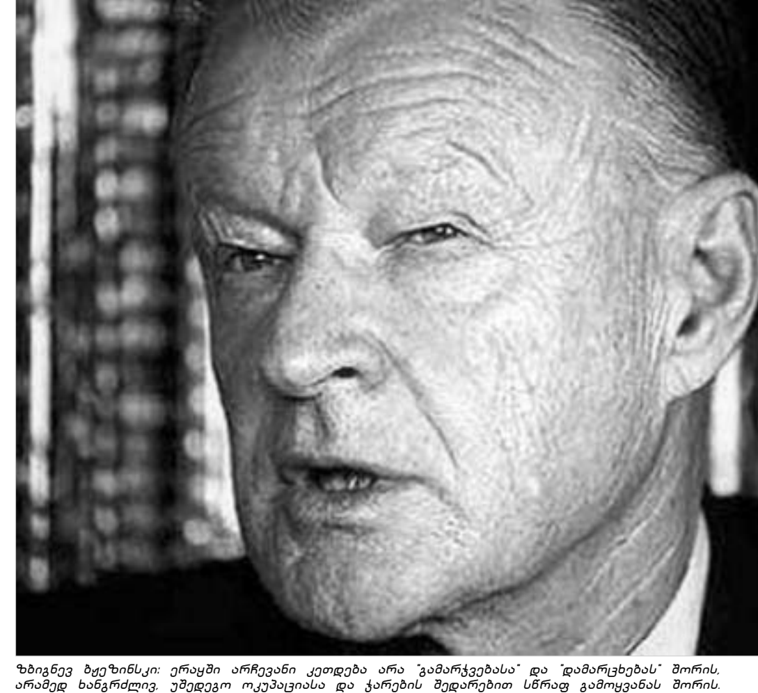
ზბიგნევი ბჟეზინსკი: ერაყში არჩევანი კეთდება არა "გამარჯვებასა" და "დამარცხებას" შორის, არამედ ხანგრძლივ, უშედეგო ოკუპაციასა და ქარების შედარებით სწრაფ გამოყვანას შორის.

ერაყიდან ჭარის გამოყვანა სულაც არ ნიშნავს აშშ-ს დამარცხებას ცნობილი ამერიკელი პოლიტოლოგი, აშშ-ს ყოფილი პრეზიდენტის, ჯიმი კარტერის ყოფილი მრჩეველი ეროვნული უშიშროების საკითხებში ზბიგნევი ბჟეზინსკი ჯორჯ ბუშს ერაყში შეერთებული შტატების მიზნების გადახედვის კენ მოუწოდებს. გაზეთ "ვაშინგტონ პოსტში" გამოქვეყნებულ სტატიაში ბჟეზინსკი ბუშს სთავაზობს აღიაროს, რომ ერაყში არჩევანი კეთდება არა "გამარჯვებასა" და "დამარცხებას" შორის, როგორც ეს ოფიციალურ დოკუმენტებშია აღნიშნული, არამედ ხანგრძლივ, უშედეგო ოკუპაციასა და ჯარების შედარებით სწრაფ გამოყვანას შორის, რომელიც სულაც არ ნიშნავს აშშ-ს დამარცხებას. იგი აღნიშნავს, რომ "გამარჯვება", რომელსაც ადმინისტრაცია ესწრაფვის - ერაყის შეიარაღებული ძალების დახმარებით გაანადგუროს აჯანყებულები და ერთიან ერაყში სტაბილური საერო დემოკრატია შექმნას - არსებულ პირობებში მიუღწეველია. ბაზრძალაბა A3 ბაზრძალა