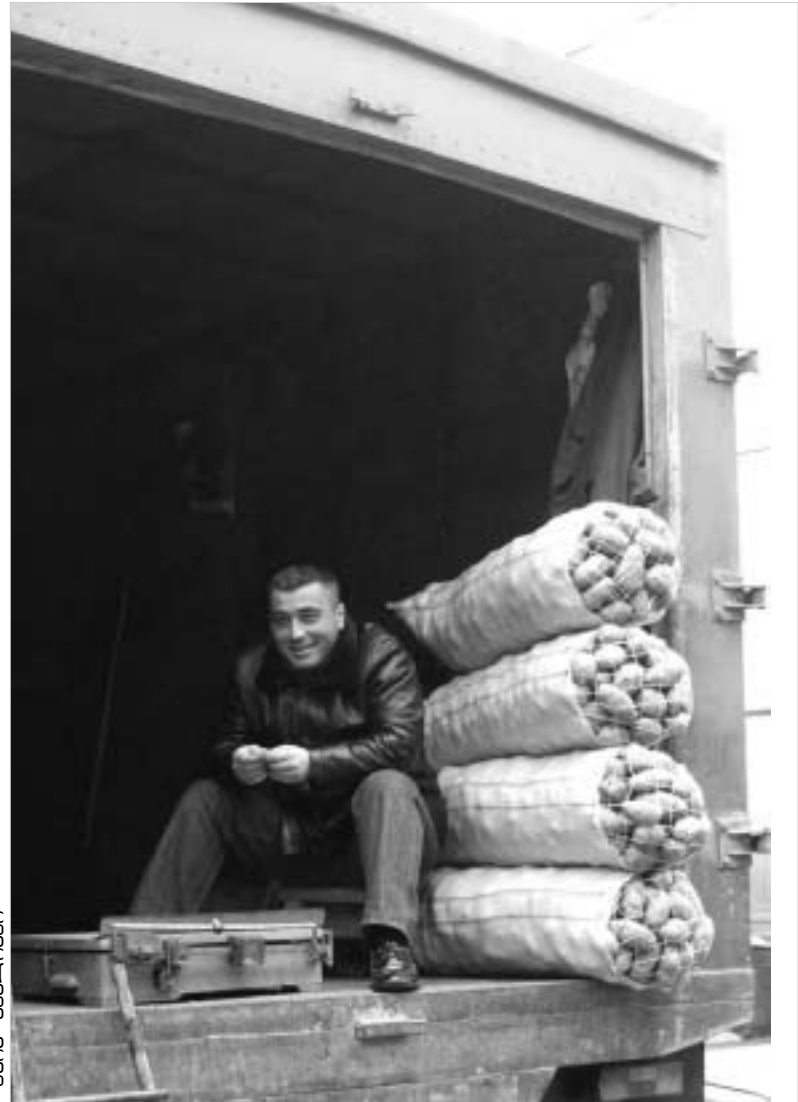
სამცხე-ჯავახეთის გლეხებისგან 25 თეთრად ნაიღ კარტოფილს გადაამყიდველები 60 თეთრად ყიდიან