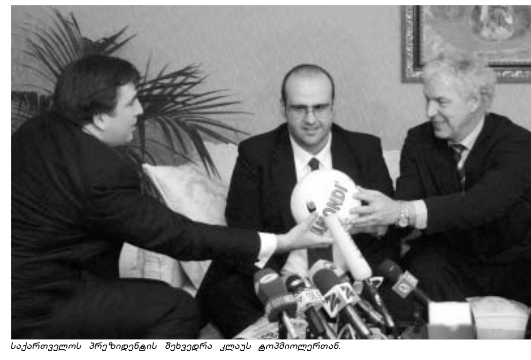
საქართველოს შრეზიდენტის შეხვედრა კლას ტომპილერთან.

მიხეილ აბიშვილი გილოცავთ: გუშინ, სასტუმრო "თბილისი მარიოტში", მოხდა კონტრაქტის გაფორმება საქართველოს ფეხბურთის ფედერაციასა და კლას ტომპილერს შორის. ეს სახელოვანი და მთელს მსოფლიოში უდიდესი ავტორიტეტის მქონე გერმანელი სპეციალისტი, სულ მცირე, მომდევნო ორი წლის განმავლობაში საქართველოს ეროვნულ ნაკრებს განვრთნის. ბოლო 12 წლის მანძილზე არაერთხელ მოგვისმენია ფუჭი დაპირებები საქართველოს ფეხბურთის ფედერაციის ხელმძღვანელებისა და მათი რჩეული მწვრთნელებისგან. ბაზრძალაბა A6 ბაზრძალა