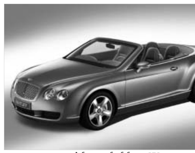
ბენტლი კონტინენტალ GTC