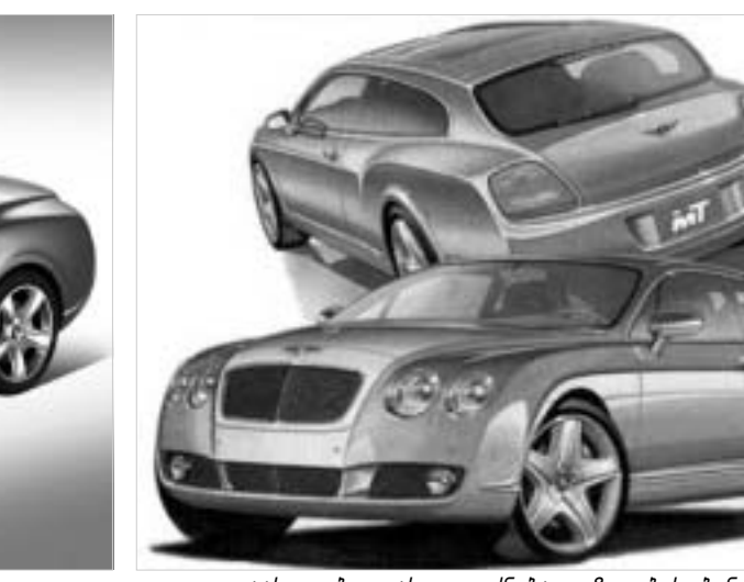
დაახლოებით ასეთი იქნება უკანა ნაწყვეტი ბენტლი

წლის დასაწყისში ლოს ანჯელესის ავტოსალონზე "ფოლკსვაგენის" ჯგუფის შემავალმა ინგლისურმა კომპანია "ბენტლიმ" წარმოადგინა კონცეპტუალური კაბრიოლეტი "არნაჟ დროჰედ კუპე" (არნაჟის თანამდებობა კუპე), პარალელურად კი გამოცხადდა, რომ აღარ განახლებიდა პოპულარული მოდელი "აზურის" წარმოება.