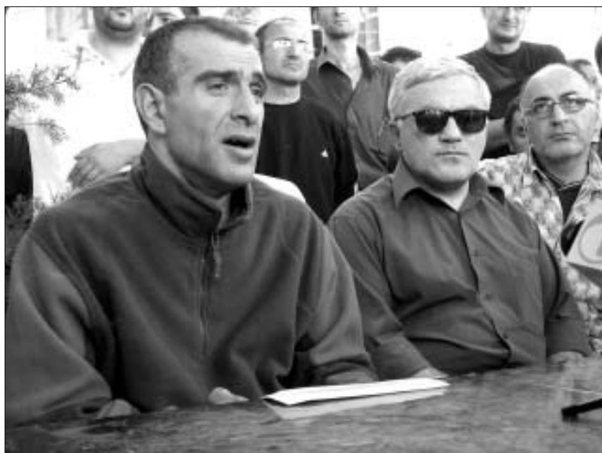
ხელისუფალთა დაპირებამ მოშიმშილეებს სულზე მიუსწრო.

შეზღუდული შესაძლებლობების მქონე პირთა შიმშილობის აქცია, რომელიც ექვსი დღის განმავლობაში მიმდინარეობდა პარლამენტთან, გუშინ შეწყდა. "ხელისუფლება დაგვიპირდა, რომ პარლამენტში ჩვენს პროექტს პარასკევიდან განიხილავდნენ. იმედი ვიქონიოთ, რომ პირობა შესრულდებოდა. თუ ასე არ მოხდება, ორშაბათიდან ჩვენი აქცია პოლიტიკურ ხასიათს მიიღებს. ახლა კი ყველას დიდი მადლობა თანადგომისთვის", - მოშიმშილეები დღის სამი საათისთვის ამ სიტყვებით დაიშალნენ. მათი მონაცემებით, ფინანსთა სამინისტროსთან შეთანხმებული პროექტის ვარიანტი კანცელარიის გზას ადგას.