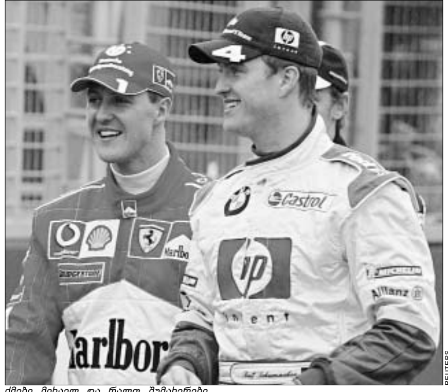
მები მიხაელ და რალდ შუმასერები

ბევრს მაინც, რომ სამშობლოში ასპარეზობა დიდი წინების ქვეშ მიმდინარეობს, მაგრამ პირადად ჩემზე ასეთი რამ არ მოქმედებს. პირიქით, როდესაც დიდ მხარდაჭერას ვგრძნობ, ცდილობ, რაც შეიძლება, უკეთ გამოვიყურებოდე. ახლაც მოვიმდენა დედი ნიურბურგრინგის ეტაპს. რაც