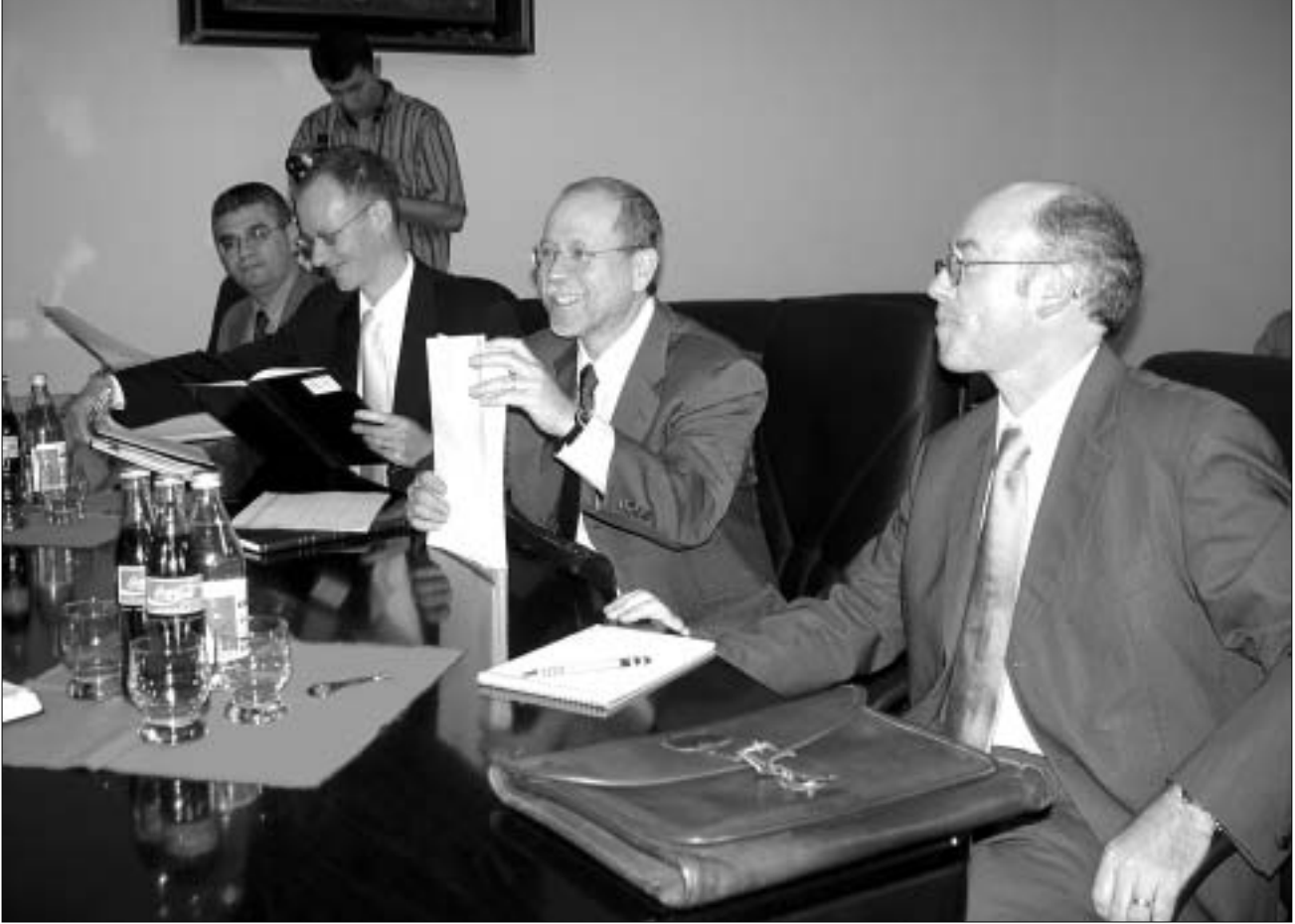
სავალუტო ფონდის მისია ფინანსთა სამინისტროში.

ფინანსთა მინისტრის ინფორმაციით, ჯერჯერობით, მხოლოდ ხარჯების 85 მილიონი ლარით შეკვეცის გეგმა განიხილება. მირიან გოგიაშვილის განცხადებით, საგადასახადო შემოსავლების კუთხით, გარდა აჭარისადმი გადმოურიცხავი თანხებისა, პრობლემა არ არსებობს. "პრობლემა იქნება დავალიანებების დაფარვის საკითხი. წლის ბოლომდე ფონდის სახელმწიფო და საჯარო დავალიანებების დაფარვის ზუსტად განკარგვის გეგმა უნდა წარუდგინოთ," - აცხადებს გოგიაშვილი. სახელმწიფო მინისტრთან გამართული შეხვედრის შემდეგ ფინანსთა მინისტრი საკმაოდ ოპტიმისტურად გახლდათ განწყობილი. მისი თქმით, "გაცილებით უფრო მეტ დამაბულობას მოველო-