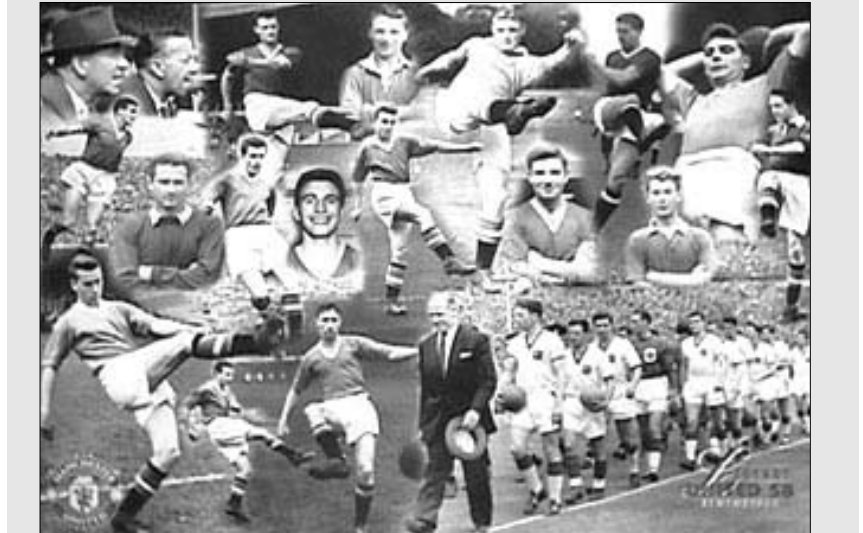
ასეთი იყო 1958 წლის ლეგენდარული "მანჩესტერ იუნაიტედი"

პირველ ცდაზე თვითმფრინავი ვერ აფრინდა. მიზეზად ერთ-ერთი ძრავის