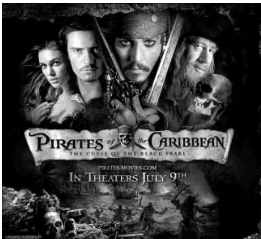
ახალი ფილმის პლასკატი

საქმეს ართულეს ისიც, რომ ბოროტი მეკობრეები დანაშაულები არიან. მათზე კვლავა მოქმედებს უძველესი წყევლა, რის გამოც მუდამ სიკვდილ-სიცოცხლის ზღვარზე ცხოვრობენ. თუ დღისთე წყევლებრივი ადამიანები არიან, ღამით, მთვარის შუქზე საშინელ ჩონჩხებად იქცევიან და მახინჯ მონსტრებს ემსგავსებიან. ფილმი სასვეს მძაფრი ეპ-