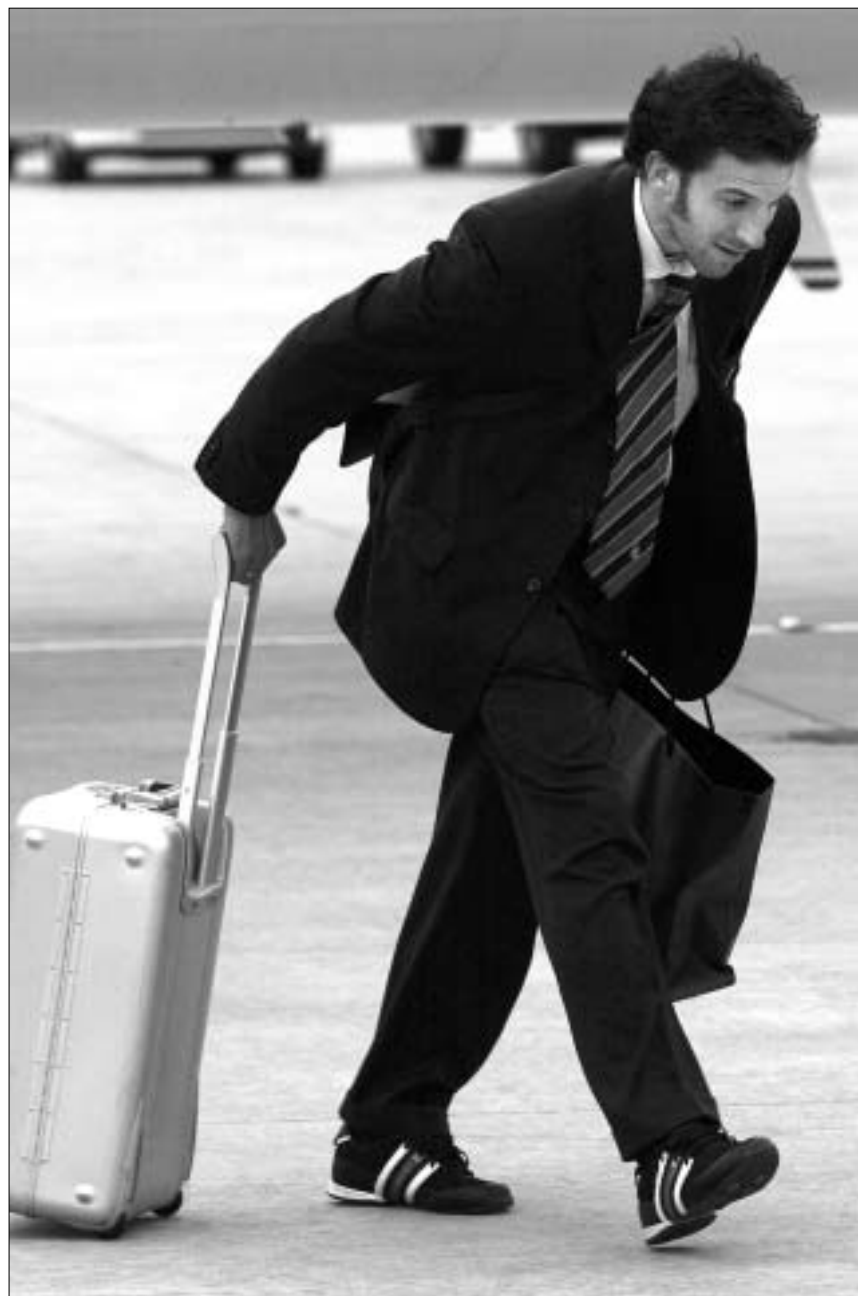
დელ პიერო თავის ბარგს არავის ანდობს.

ალი ბაბასი არ ვიცი, მაგრამ რაც ამ ცენტრის არსებობის შესახებ ვიცი, ისეთი შთაბეჭდილება გამიჩნდა