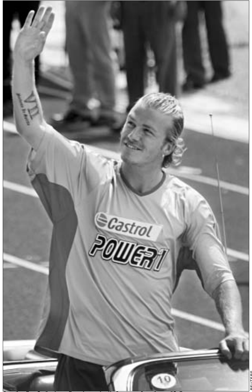
მადრიდში ხერვები ახყედათ. ბექშიტი კი ახიურ ტურნეშია