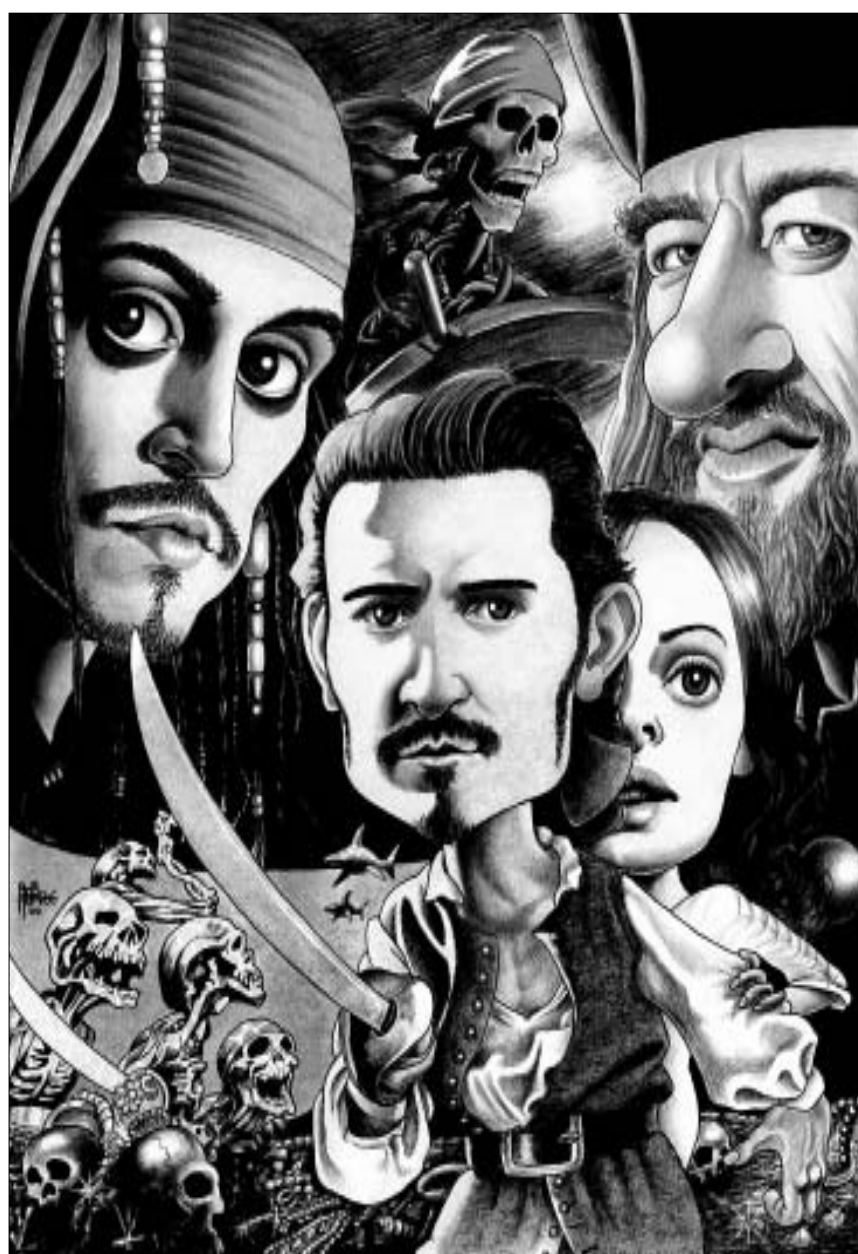
ფილმი დიდ თავგადასავლებს გვპირდება.