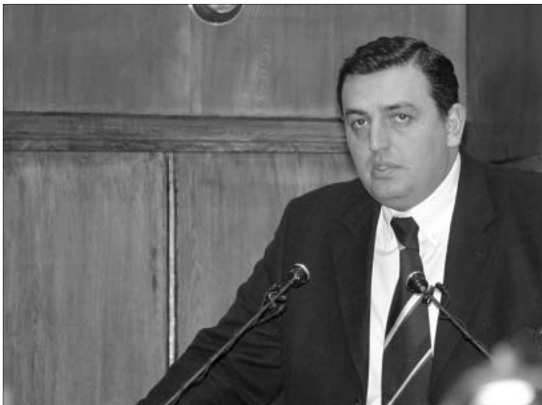
სულხან მოლაშვილის მიერ სალექი რეზინის ხსენებამ სახელმწიფო მინისტრს წონისწონობა დააკარგვინა.

ამ გაუგებარი განცხადებების გარდა, ედუარდ შევარდნაძემ სსფ-ზე საუბრისას გააკეთა ერთი მინიშნება, რომელიც ვის-ვის და, ავთანდილ