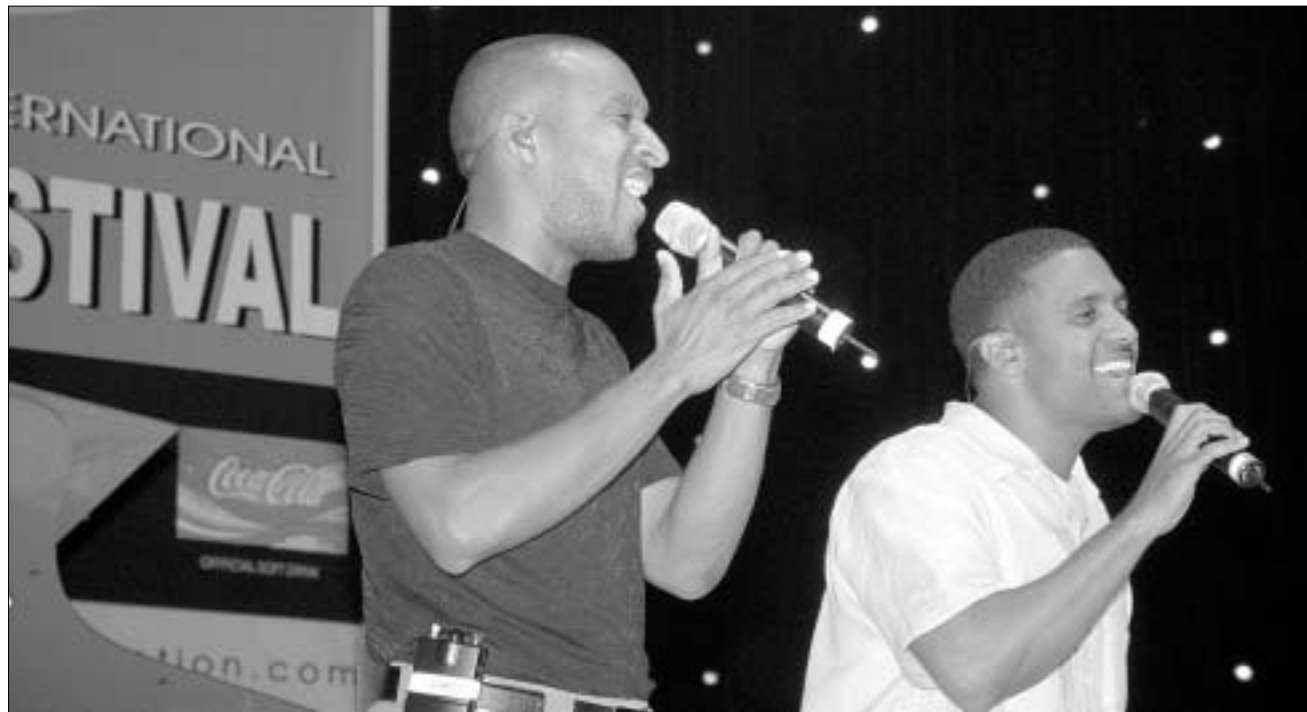
Take 6-ის კომპოზიცია - დასკვნითი აკორდი.