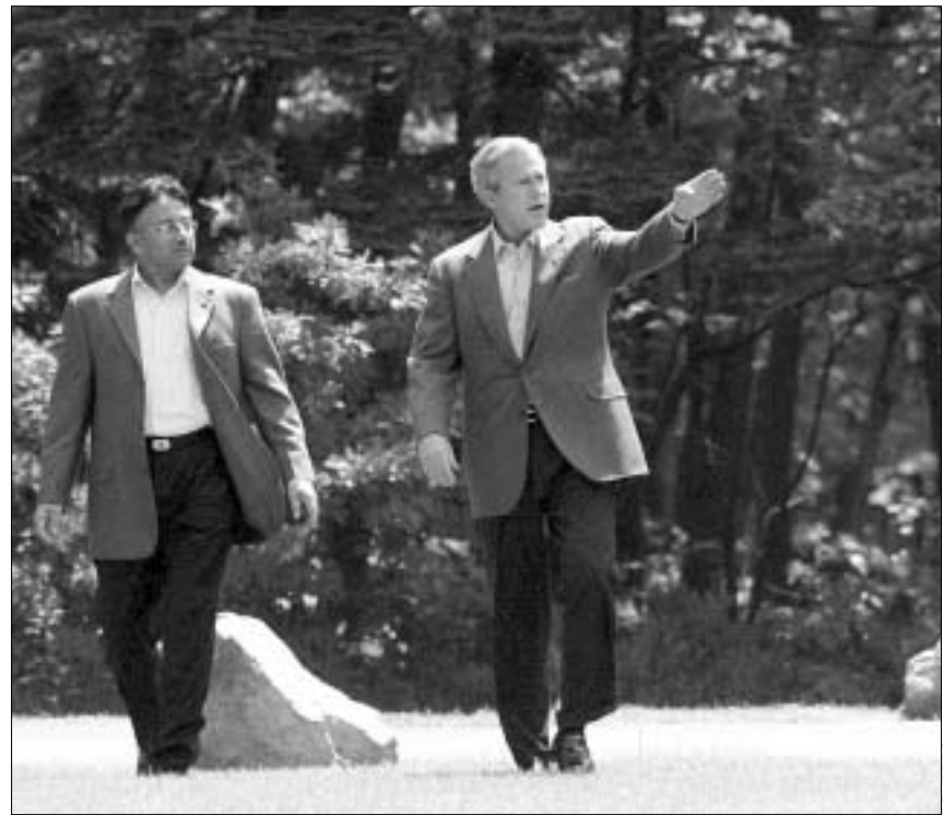
აშშ-სა და პაკისტანის პრეზიდენტები - ბუში და მუშარაფი.

გუშინ პრეზიდენტმა ბუშმა პაკისტანს, დახმარების სახით, 3 მილიარდი ამერიკული დოლარი შესთავაზა. არადა, ჯერ კიდევ ორი წლის წინ, ბირთვული იარაღის შექმნის გამო, ვაშინგტონმა ისლამაბადის წინააღმდეგ სანქციები დაწესა.