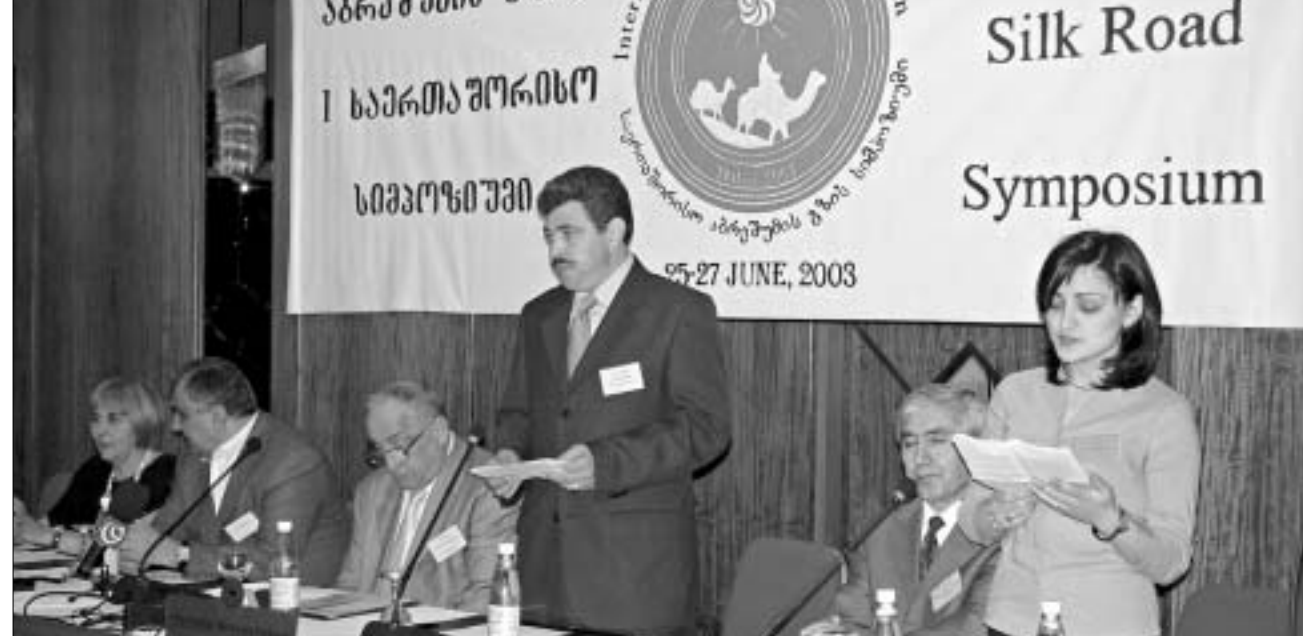
სიმპოზიუმი “აზრეთუმი გზის” მეცნიერულ-კულტურულეკიურ პრობლებებს მიეძღვნა. მაგრამ პოლიტიკას მაინც შეეხო.

მორიგე ბატალიონის მომზადების შემდეგ ინსტრუქტორების შეცვლა ხდება. კრის სტერლინგის თქმით, თითოეუ-