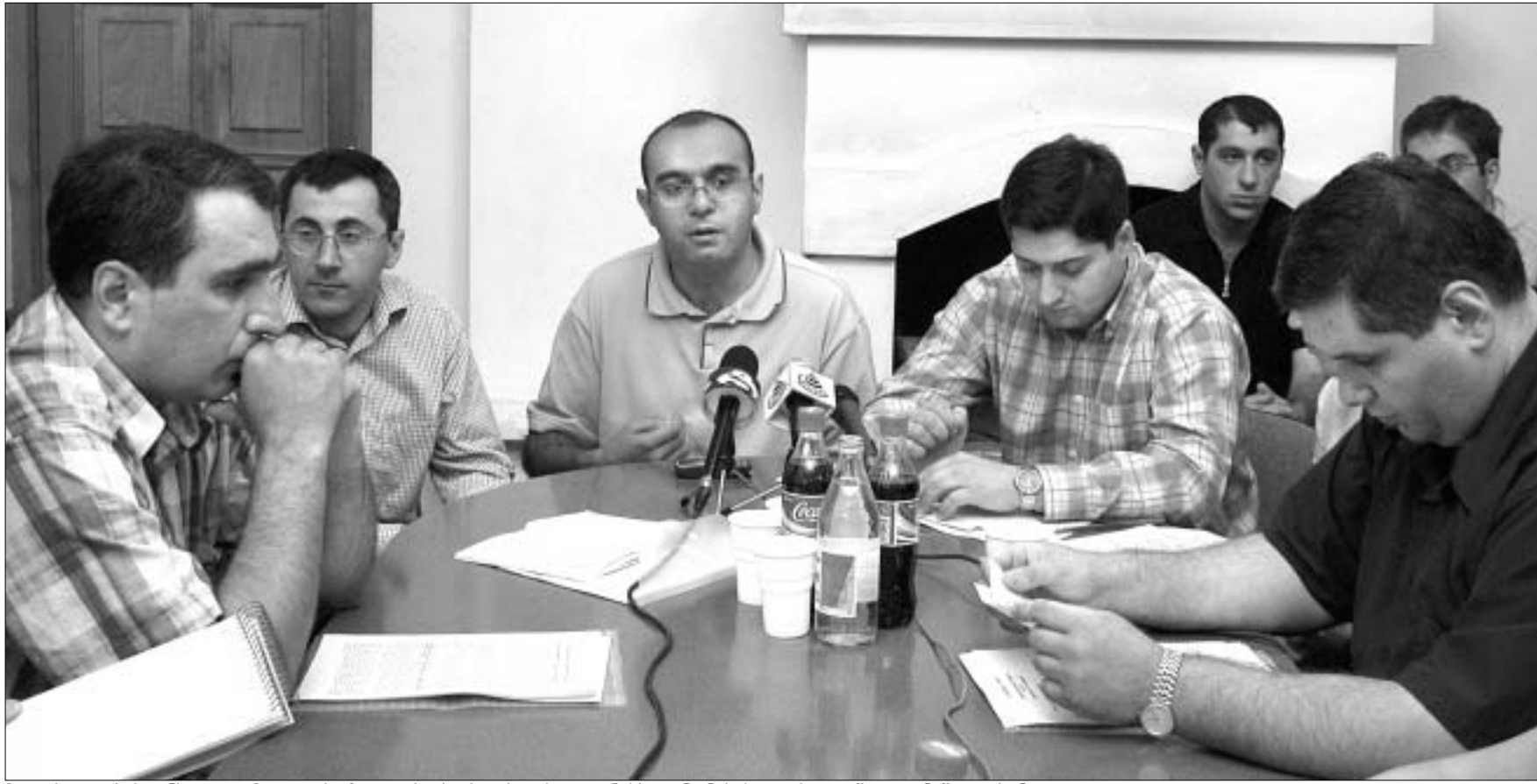
“თავისუფლების ინსტიტუტი” და ოპოზიციური პარტიები ძალგვანებს კანონების დარღვევაში ადანაშაულებენ.

“კმარას” რამდენიმე სტუნდენტი-აქტივისტი აცხადებს, რომ თსუ იურიდიულ ფაკულტეტზე, სადაც ისინი სწავლობენ, დადის უშიშროების თანამშრომელი და ფაკულტეტის დეკანისგან მათ შესახებ ინფორმაციას აგროვებს.