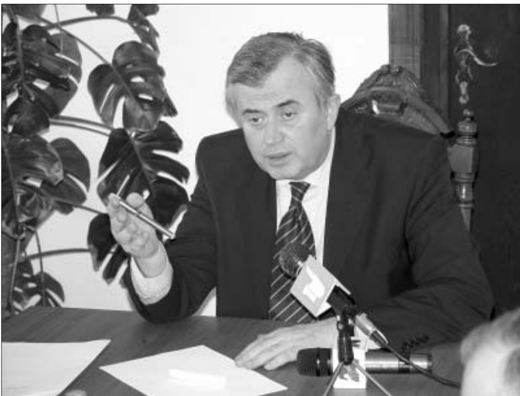
ავთანდილ კობახიძე აცხადებს, რომ ადენი ბრალდების პირობებში მუშაობა შეუძლებელია.

მთავრობის გუშინდელი სხდომის მთავარი საკითხი სიღარიბის დაძლევის პროგრამა გახლდათ, რომელიც მთავრობის გასულ სხდომაზე ანტიკორუფციული ბიუროს ხელმძღვანელის კატეგორიული პოზიციის გამო გადაიდო. ეს პოზიცია ანტიკორუფციული და სახელმწიფო მინისტრის შორის დაპირისპირების ერთ-ერთ საბაბად იქცა და მან გაგრძელდა მალე - უშიშროების სამსახურზე ჰპოვა, როცა ავთანდილ ჯორბენაძე და კახა უფულავა უკვე ფინანსური ლეგიონისთვის უფლებამოსილებების გაზრდის საკითხზე დაუპირისპირდნენ ერთმანეთს. თავად ეს დაპირისპირება კი სახელისუფლებო კულურებში იმთავითვე ფინანსთა და სახელმწიფო მინისტრის დაპირისპირების გამოძახილად იქნა აღქმული. ამ ფონზე შევარდნაძემ ისევ სიტუაციის დაბალანსება სცადა. სამშაბათს