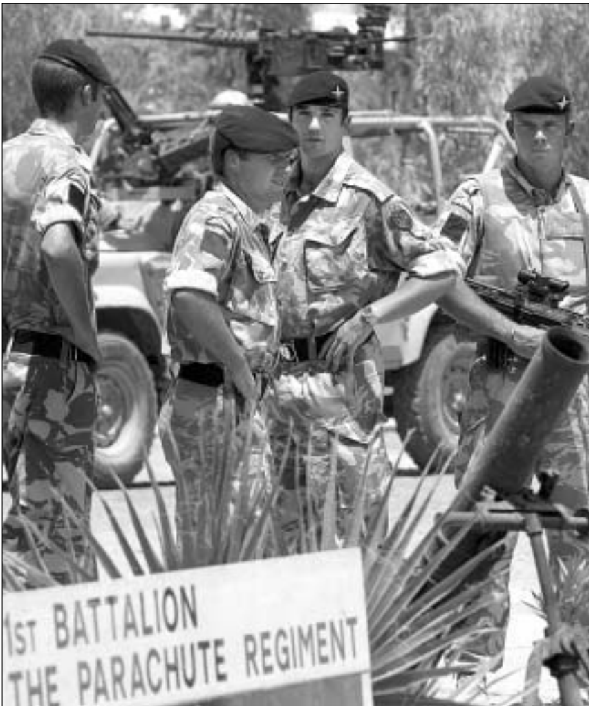
ბრიტანელი სამხედროები მკვლელობის ადგილას.

სააგენტო "როიტერმა" გაავრცელა ინფორმაცია, რომლის თანახმადაც ბრიტანელი ჯარისკაცები ერაყის მშვიდობიანმა მოქალაქეებმა მოკლეს, რომლებიც ბრიტანელების მიერ სოფლებში იარაღის ძებნაში გააღიზიანა. ანალოგიური ინფორმაცია, ოღონდ სხვა მოტივით, სხვა წყაროდანაც დასტურდება. კერძოდ, სააგენტო "ასოშეიტედ პრესის" თანახმად, ბრიტანელი ჯარისკაცები მშვიდობიანმა მცხოვრებლებმა მოკლეს, რომლებმაც, იმავე დღეს საპროტესტო დემონსტრაციის დროს ბრიტანელებს დასაჯეს.