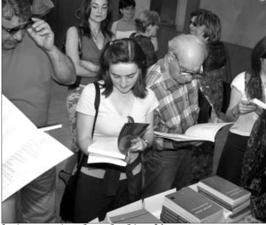
მკითხველი ფილოსოფიურ ლიტერატურას ეგებნება

მული სხვა კრებულებიც წარმოუდგინეს. საგანგებო პრეზენტაცია კი გერმანელი ფილოსოფოსის, დიტრის ფრაიბერგელის "ტრაქტატი ნეტარი ჭვრეტის შესახებ" და "ფილოსოფიურ განაზრებას" მოუწვევს. ეს უკანასკნელი, სადაც დაბეჭდილია როგორც ქართული, ისე გერმანული ფილოსოფოსების ორიგინალი შრომები, სამეცნიერო საზოგადოებამ პროფესორ გურამ თევზაძის 70 წლის იუბილეს მიუძღვნა. დიტრის ფრაიბერგელის "ტრაქტატი ნეტარი ჭვრეტის შესახებ", რომელიც ლათინურ-გერმანულ ენებზეა, პროფესორმა ბურგარდ მიოზიშმა თარგმნა. მისი წყალობით ფილოსოფიის ფაკულტეტი გამომცემლობა "შერიდიანთან" ერთად, ამ წიგნის გამოცემის ექსკლუზიური უფლებით სარგებლობს.