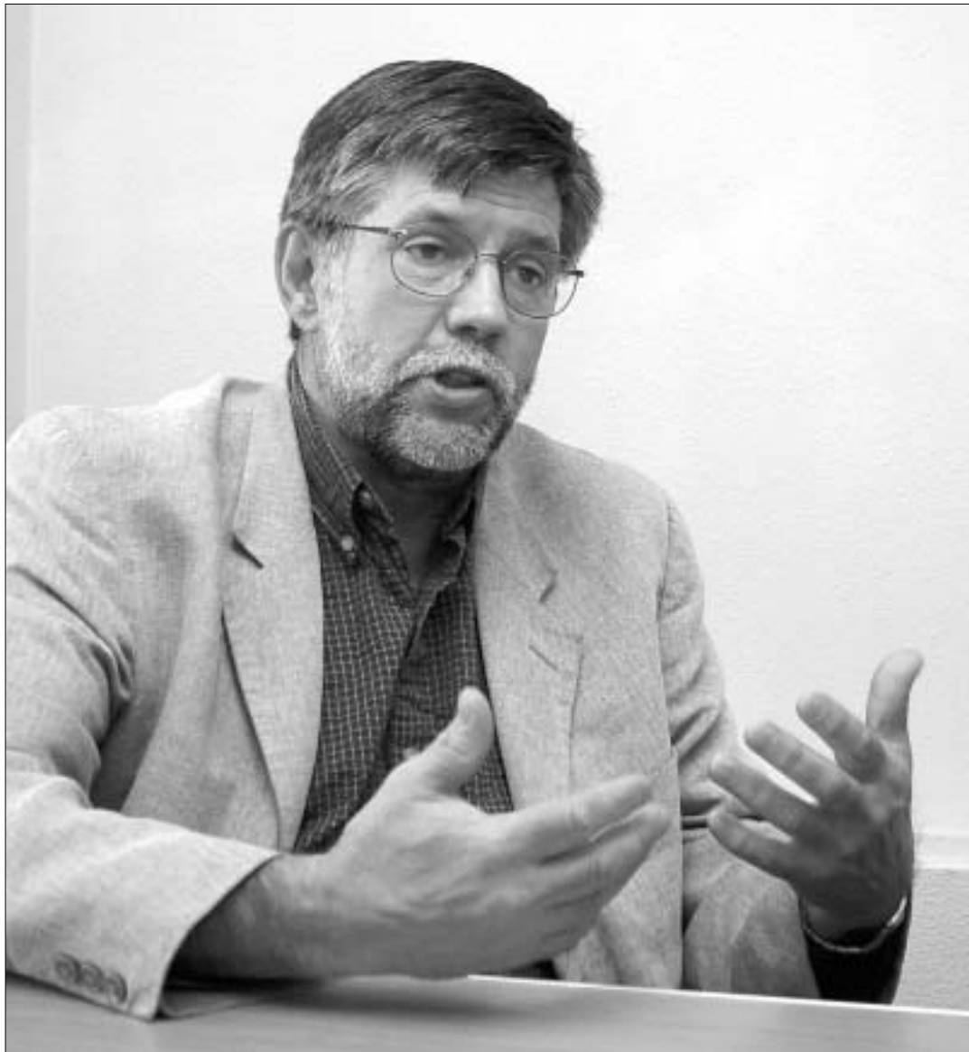
უიინ დ. ფილდზი

რა ჯობია ქვეყნის განვითარებისთვის - იყო ძველი დემოკრატიისა და ახალგაზრდა კულტურის თუ ახალგაზრდა დემოკრატიისა და ძველი კულტურის ქვეყანა... სხვათა შორის, ორივე ამ ტიპის სახელმწიფოს ბევრი პარალელური პრობლემა აქვს - როგორ თანაირსებონ მშვიდობიანად და სად არის თითოეული ადამიანის ადგილი არსებულ სამყაროში... ამგვარი საუკუნეობრივი საკითხები ისეთ ქვეყანაშიც კი თავსატეხს წარმოადგენს, როგორც ამერიკა. ოლონდ, „მცირე“ განსხვავებით - ეს ფილოსოფიური კითხვები ამერიკას მხოლოდ ორი საუკუნეა აწუხებს. ჩვენ კი - 30 საუკუნე და ახლახან აღმოჩნდა, რომ შეიძლება 31 საუკუნის წინაც კი სახელმწიფო გვექონდა... ჩვენი დღევანდელი სტუმრები „ამერიკა-კავკასიის სტრატეგიული და კულტუროლოგიური კვლევების ინსტიტუტის“ ამერიკელი წარმომადგენლები - სენტ ლუისის ვაშინგტონის სახელობის უნივერსიტეტის პროფესორები, ფსიქოლოგი ჯეიმზ ვ. უერნი და მწერალი უიინ დ. ფილდზი არიან. პროფესორი უერნი, ამ უნივერსიტეტის საერთაშორისო ურთიერთობების პროგრამის ხელმძღვანელია, ხოლო პროფესორი ფილდზი ამერიკული კულტურის შემსწავლელ პროგრამის ხელმძღვანელობს.