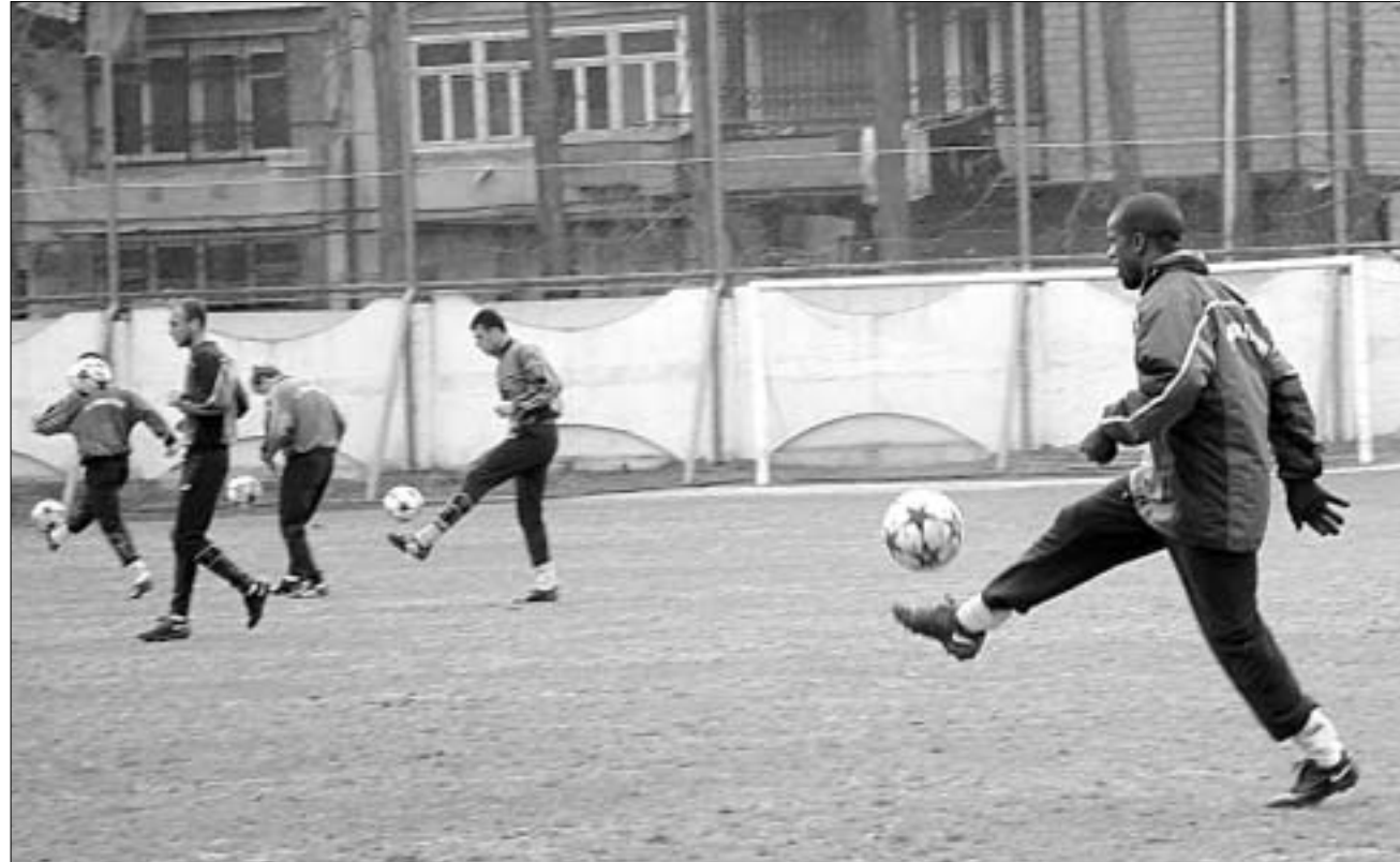
დინამო ჩემპიონთა ტურისთვის ემზადება