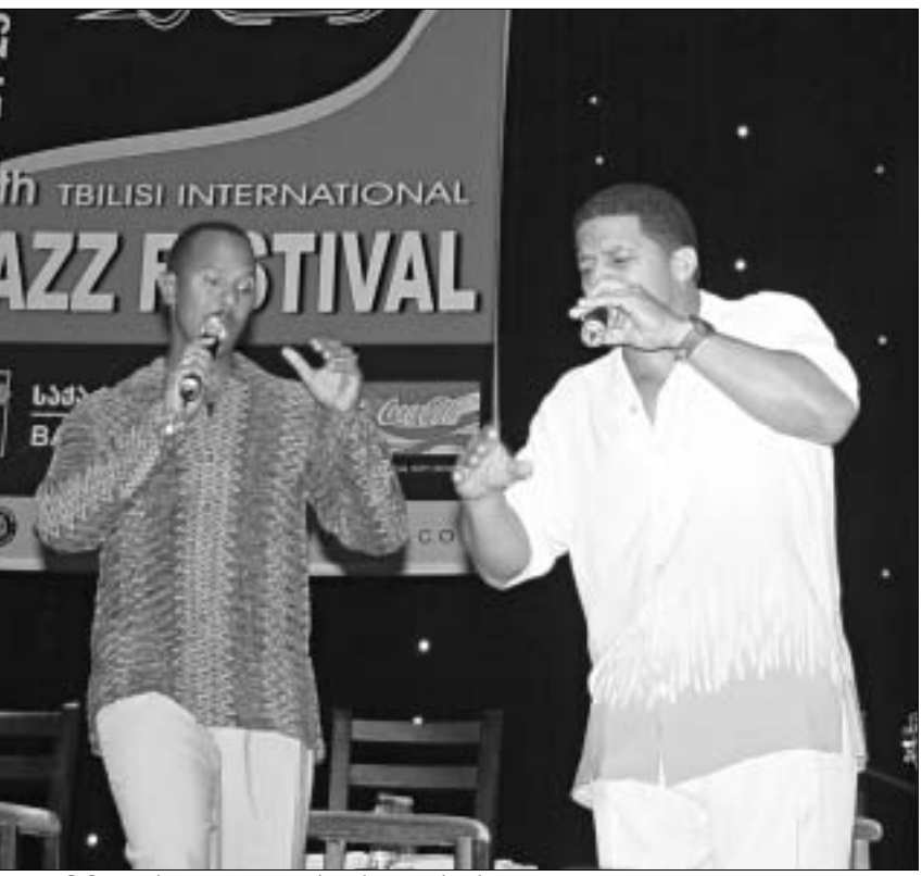
Take 6-მა ფესტივალის ეფექტურად დახურა

Take 6 თბილისის მეშვიდე საერთაშორისო ჯაზ-ფესტივალის ბოლო აქორდი