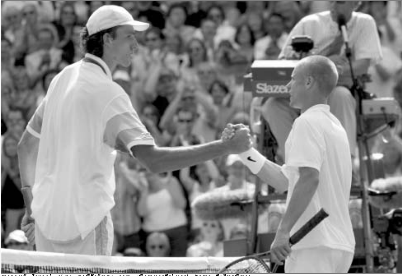
ლეიტონ ჰოუიტს ისღა დარჩენოდა ივო კარლოვიჩისთვის ხელი ჩამოერთვა

"ეს ნამდვილი ფანტასტიკაა. სიზმარშიც ვერ ვიოცნებებდი, რომ უიმბლდონის ტურნირზე თვით ლეიტონს დავამარცხებდი. როგორც ჩანს, ძალიან მინდოდა და ყველაფერი ჩემთვის სასიკეთოდ აეწყო. სიმართლე