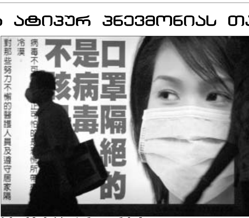
ჰონგ-კონგში ნიღბებით სიარული აღარ მოუწევს.

ლობდნენ. მოსამსახურე გოგონამ მოისმინა, რომ სადამს უდრისათვის ნაძვლების მოგროვებას და მეზობელ სირიამში მის გაყვანას სთავაზობდნენ. როგორც ცნობილია, უდრი, რომელიც 1996 წელს თავდასხმის დროს დაჭრეს, მუდმივ მკურნალობას საჭიროებს. 6 აპრილს, დაახლოებით, ღამის ორის ნახევარზე, სადამმა, ქუსქემ, ქუსქის ორმა შვილმა და მამაშვიდმა ეს ადგილიც მიატოვეს. ამ დღეს მოსამსახურე გოგონამ სადამს უკანასკნელად იხილა. მეორე დღეს ის ისევ თიქრითის ფერმასში ნაიყვანეს. 8 აპრილს, როდესაც სადამის მოკვლის მიზნით, ამერიკელებმა ბაღდადის მაიკრობული დაბომბვა დაიწყეს, ერასის პრეზიდენტი ფერმასში დარჩენილი იქნებოდა, რომელიც “ხმელეთი-ხმელეთი” ტიპის რაკეტების შედეგად დაბომბვას შეუძლებდნენ. იმავე დღეს მოვიდა პუსეინის ძმისშვილი მიგადა და ტერილი დაიწყო. “ბაღდადი ნებდება, არმია გარბის”, - სლუკუნით ამბობდა იგი. 24 აპრილს გოგონას ბაღდადში დაბრუნების ნება დართეს. მანამდე კი, მოსამსახურე გოგონ-