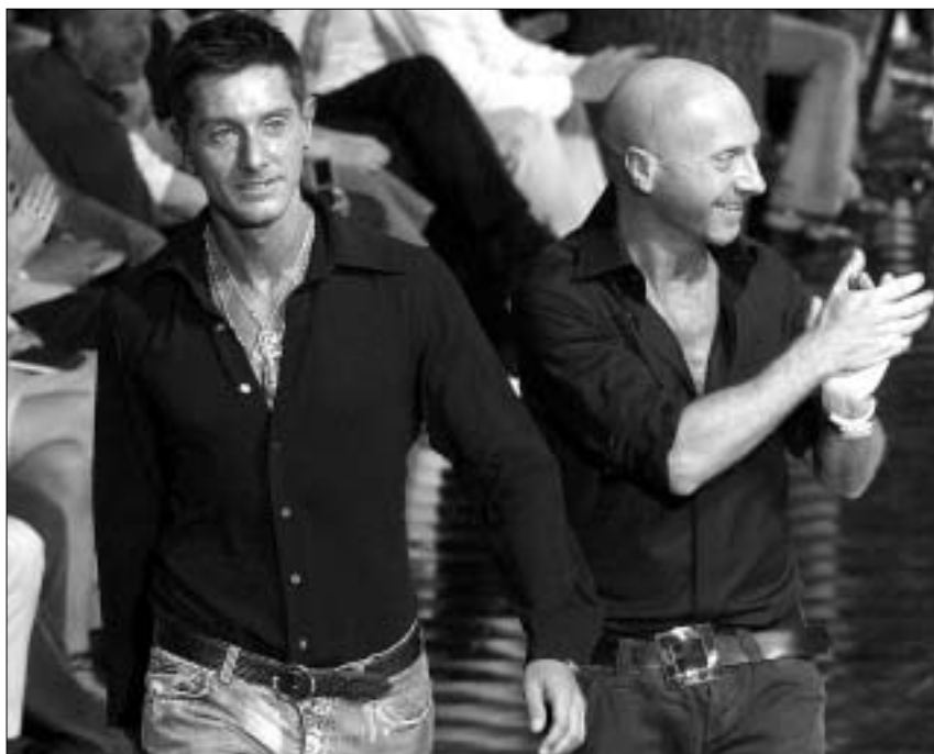
მილანის მოდის კვირეულის ექსცენტრიული გმირები: დომენიკო დოლჩე, სტეფანო გაბანა და ვივიენ ვესტვუდი