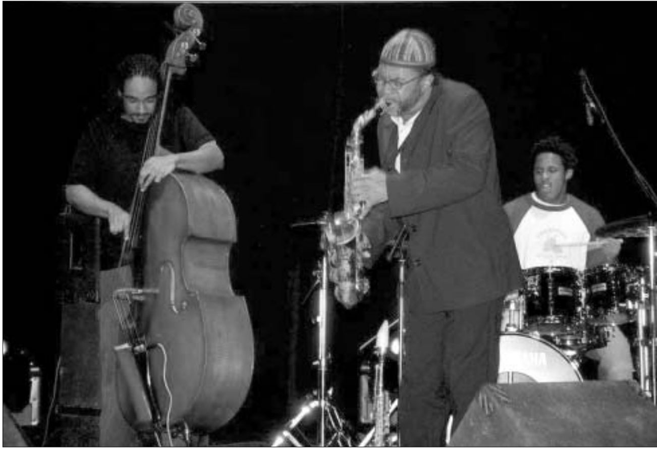
კენი გარეტი თბილისში

ეს არ იყო ჩვეულებრივი კონცერტი ჩვენთვის. თბილისში მსგავსი სიაზონებმა იშვიათი ფუფუნება. გარეტი არც იმაში იყო დარწმუნებული, რომ მის მუსიკას კარგად მიიღებდა აქაური მსმენელი, მაგრამ მან არ იცოდა, თბილისში რამდენი თავყავისმცემელი ელოდა. კენი გარეტის ჩანაწერები არაა უცხო ჩვენი მელომანებისთვის. კენი გარეტის სახელი საკმაოდ მნიშვნელოვანია საქართველოში ჯაზის უამრავი მოყვარულისთვის. ამის დასტურია გუმბირდელი კონცერტი, რომლის მოსასმენად მოსულმა მაყურებელმა თითქმის შეავსო ოპერისა და ბალეტის აკადემიური თეატრის დარბაზი. არ ვიცი, შეკრებილი საზოგადოებიდან რამდენი მოიყვანა კონცერტზე გარეტის წარსადგენად ამრობირებულმა სარეკლამო ხერხმა: რომ ის მაილს დევისის ერთ-ერთი უკანასკნელი მოსწავლე, ლეგენდარული ჯაზმენის ფავორიტი, თანამედროვეობის აღიარებული საქაფონისტი, Worner Brosers -ის მუსიკოსია და ა.შ. მაგრამ, ფაქტია, რომ არცერთ შემთხვევაში ქართველი მსმენელის მოლოდინი არ გაცურებულა. გუმბირდელი თეატრის საზოგადოება საათნახერის განმავლობაში ტრადიციული ჯაზის ტყეობაში იყო.