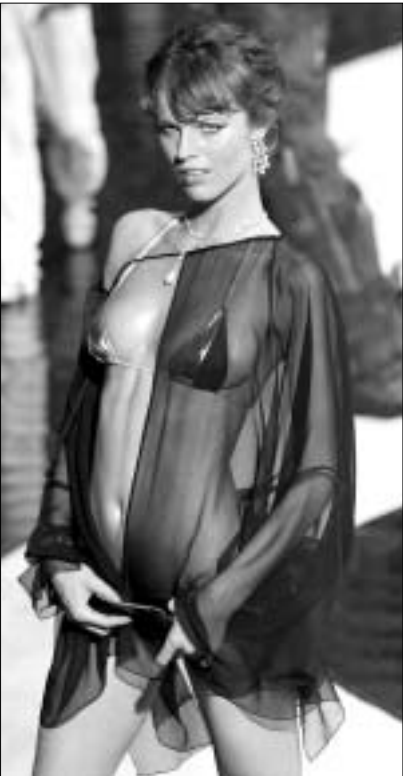
მოდელი ნარმოადგენენ წამყვანი დიზაინერების ახალ კოლექციებს