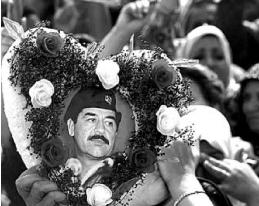
სადამს ერასში ჯერ კიდევ ბევრი მომხრე ჰყავს.

და ამჟამად ჩვენებებს აძლევს. ავტოკოლონა თიქრითში ერთ ფერმასთან გაჩერდა, რომელიც სადამის ერთ-ერთ ნათესავს ეკუთვნოდა. ერასის პრეზიდენტი ცალკე მოვიდა. რამდენიმე ხნის შემდეგ, სადამმა თავის ორ შვილთან და მამაშვილთან ერთად ფერმა დატოვა, ხოლო ერთი საათის შემდეგ კი, უდრის გარეშე დაბრუნდა. ფერმის ტერიტორიიდან ამჯერად უკვე ექვსი მანქანა გავიდა. ამ კოლონაში სადამთან შესახებ არაფერი გავიდა. კოლონა სადამს სადამის სხვა ნათესავის სახლისკენ გაემართა, რომელიც ბაღდადის ჩრდილოეთით ეთ-თარმანში მდებარეობს. დანიშნულების ადგილას ისინი სადამის ცხრა საათისათვის იყვნენ. რეზიდენციის კარებთან მდგარმა მცველმა პრეზიდენტს და მისი თანმხლებნი პირები ვერ იცნო, რადგან ისინი ტრადიციულ არაბულ სამოსში იყვნენ გამოწყობილები. მამაშვიდა რეგულარული ამოლო და მცველს მარცხენა მხარში ესროლა.