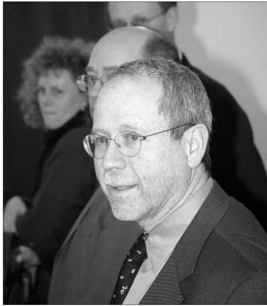
პაოლო ნუშაუზი დღეს ეროვნული ბანკის პრეზიდენტს შეხვდება.

საერთაშორისო ექსპერტთა შეფასებით, ქართულ ეკონომიკაში გამოკვეთილი აშკარა დადებითი ტენ-