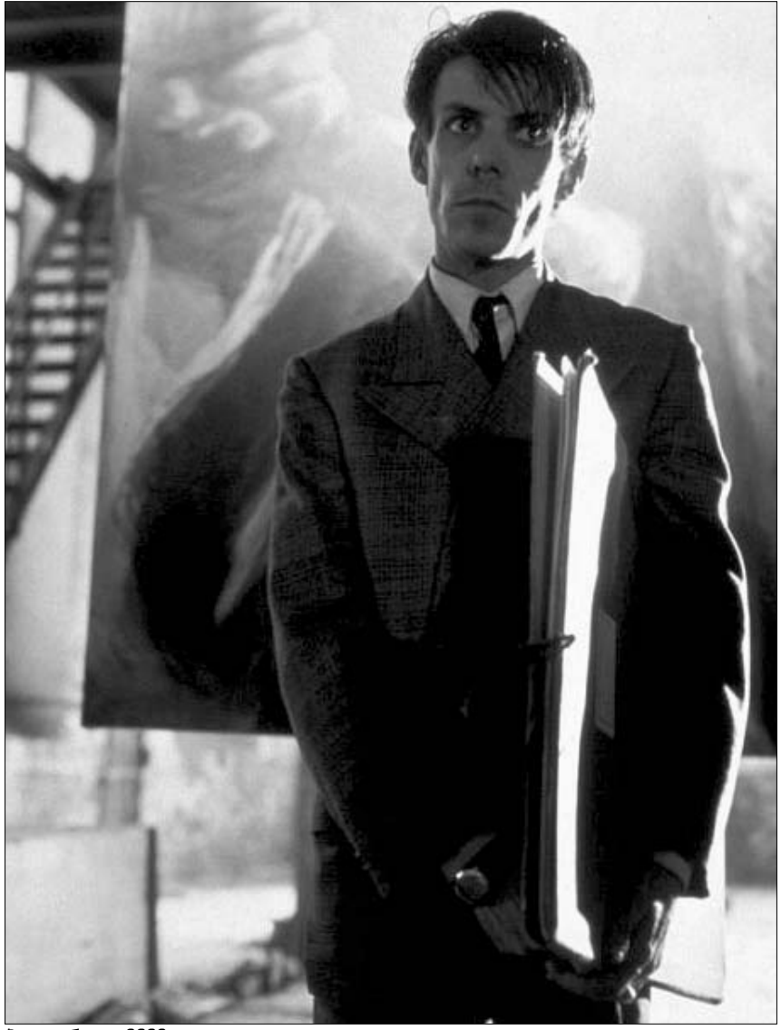
პიტლერი - 2002

რების მიერ შექმნილი პერსონაჟი – ძირითადად, ერთგვაროვანია, სქემატური. ეს პერსონაჟი გაკვრით მაინც ყოველთვის გვხვდება ომის თემაზე შექმნილ ფილმებში. უმეტესწილად პიტლერის გმირი კაცობრიობის დაუძინებელი მტერია, საშობი, ყველასათვის საძულველი. მისი გარეგნული თუ ხასიათის თავისებურებები ყველა სურათში დაახლოებით იდენტურია: ისტერიული შეძახილები, მზრძანებლური ტონი, რაც ხშირად სასაცილოდაც კი ჟღერს, წყვეტილი, ძალის ყეფის მსგავსი სახეობი, თმის კომიკური ვარცხნილობა, პატარა უღვაშები და სიარულის უცნაური მანერა.