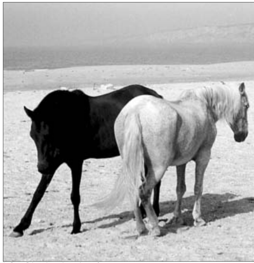
ბენეტონის ერთ-ერთი რეკლამა

ჯანდაცვის მსოფლიო ორგანიზაციის მოღვაწეობის მხარდასაჭერად კომპანია "ბენეტონმა" გლობალური კამპანია წამოიწყო, რომელიც ძალადობის თავიდან აცილებას ისახავს მიზნად. პროექტის ოფიციალური პრეზენტაცია ბრიუსელში შედგა, ის მსოფლიოს ოც ქვეყანას მოიცავს. ამ კამპანიის მიზანია საზოგადოებრიობის ყურადღება ადამიანთა ყოველდღიური ტანჯვისკენ მიმართოს და ამგვარად თანამედროვე საზოგადოებაში ზნეობრივი კლიმატის შეცვლა სცადოს.