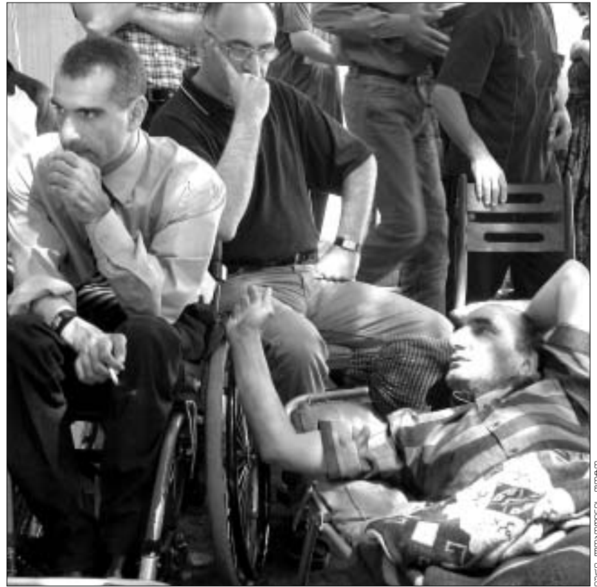
ჩვენ აქციას არ შევწყვეტთ! - ამბობენ მოშიშვლებები.

პარლამენტის თავმჯდომარე შეხვედრის შედეგებით კმაყოფილი იყო. “მე მადლობელი ვარ ამ ადამიანების, რომ მშრალს მიმშობლობა შეწყვიტეს. ეს მათთვის ძალიან მძიმე ასატანი იქნებოდა. ისინი საკითხების პარლამენტში განხილვას ითხოვენ და ამაზე ჩვენგან სრული თანადგომა მიიღეს. შეთანხმდით, რომ თუ ფინანსთა სამინისტრო ამ კვირაში წარმოადგენს შესაბამის დოკუმენტს და მას კომიტეტებიც გაეცნობიან, მომავალ კვირაში საკითხს პარლამენტი განიხილავს”, - ამბობს ნინო ბურჯანიძე.