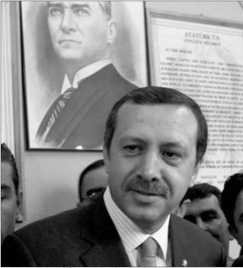
თურქეთის პრემიერ-მინისტრი საბერძნეთის სამიტზე გამოსვლისას.

ევროკავშირში განწევრიანების ერთ-ერთ მთავარ მოთხოვნას საზოგადოებრივი და პოლიტიკურ ცხოვრებაში სახელმწიფოს როლის შემცირება წარმოადგენს. თურქული მედიის ცნობით, რეფორმების შემდეგ პაკეტს მთავრობა პარლამენტის წინაშე მალე წარადგინებს, რომლის თანახმად, სახელმწიფო სამედიცინო-სამხრეთში სახელმწიფო ყოფნა ეკრძალებოდა. ამჟამად, ყველა საბჭოში სახელმწიფო წარმომადგენელი