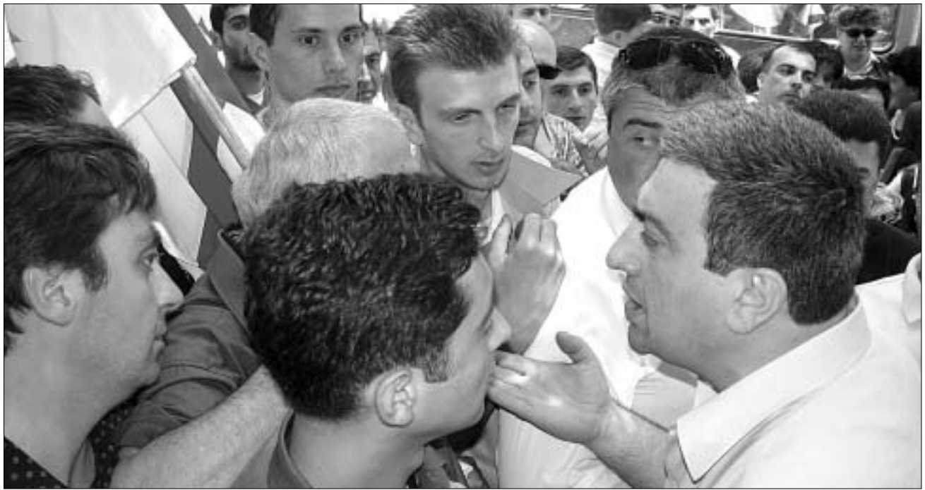
„ლეიბორისტებს“ და „ნაციონალისტებს“ შორის საუბარი, სოციალური პრობლემებიდან. პოლიტიკური ბრალდებებში გადაიზარდა.