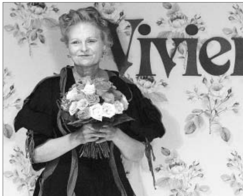
გაბანა და ვივიენ ვესტვუდი

სანამ ვივიენ ვესტვუდი წარმოადგენდა თავის ირონიულ შოუს, მამაკაცებს ახლებური იმიჯი დოლჩე-გაბანას წყვილმა შესთავაზა. კოლექციას თან ახლდა მათთვის ეუბნებოდა: ნუ გვიწინათ, ამჯერად არაფერს გავნებთ... თუმცა, მან ჩვეულებას მაინც ვერ უღალატა და საკმაოდ შესამჩნევი დოზებით თავის კოლექციას ირონია მაინც ჩააქსოვა. ირონიული იყო, აბა, რა, შოუს ის ნაწილი, როდესაც პოდიუმზე გამოვიდა ნიუტელუდ მამაკაცი, უსახელო მაისურითა და მოკლე წითელი ტრუსით, უკანაღზე კი და-