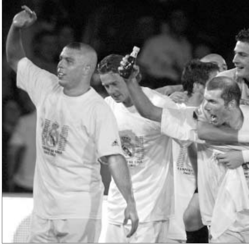
“რეალი” ესპანეთის ჩემპიონია

გუშინდელმა ფიესტამ კი 300 ათასამდე (!) ადამიანს მოუყარა თავი. ვინ იფიქრებდა, რომ “რეალის” ჩემპიონობა უკანასკნელ ტურში გაიკეთებოდა, ვინ იფიქრებდა, რომ “სოსიედადი” უკანასკნელ დღემდე იბრძოლებდა “პრემიეროსთვის”? ესპანეთის წლებანდელი ჩემპიონატი სიურპრიზებით იყო აღსავსე. სახელოვანი “ბარსელონა” ფსკერზე ჩაეშვა და მხოლოდ ბოლო ტურში მოახერხა უფვას საფურის მოპოვება, თანაც, ამას კატალონიელები “რეალს” უნდა უმადლოდნენ. კვირას მადრიდელებს ბილბაოს “ატლეტიკოსის” რომ ვერ მო-