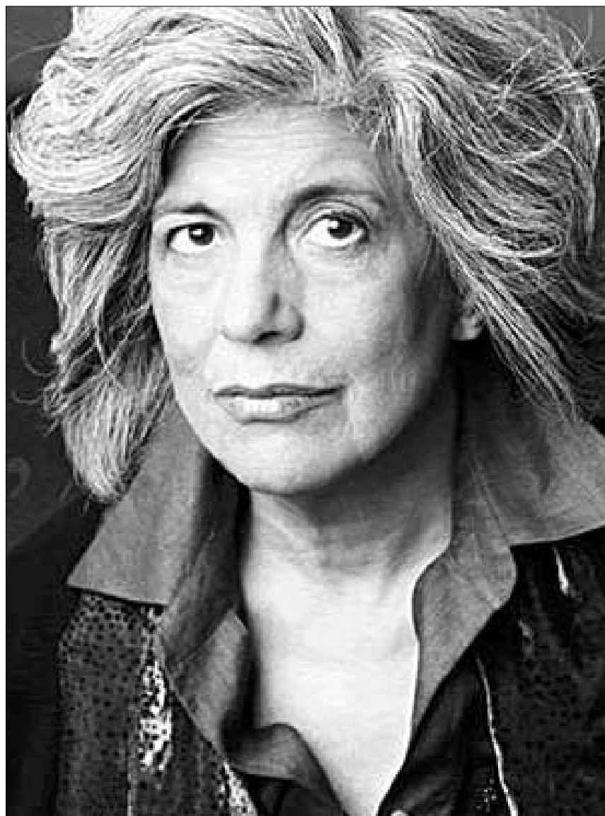
სიუზენ სონტაგი - თავისუფლება შორს არ არის

ამის მაგალითი თუნდაც 2001 წლის 11 სექტემბრის შემდგომი გამოსვლაა. მაშინ სონტაგი, რომელიც მსოფლიო საგაქრო ცენტრის შენობასთან სულ ახლოს ცხოვრობს და მუშაობს, ცეცხლოვანი კრიტიკის როლი მოგვევლინა. მან ტერორისტული აქტების კომენტარებსა და პოლიტიკოსთა და მედიების მიერ წამოწყებული კამპანიის უწოდა, და ბრძანა, რომ მათი მიზანი საზოგადოების გაბრიყვება იყო. მან თქვა, რომ სინამდვილეში ეს ტერორისტული აქტი ის არაა, რასაც ბუშის მთავრობა ამტკიცებს - ის არაა მიმართული ცივილიზაციისა და თავისუფლების წინააღმდეგ. 11 სექტემბრის ამბავი ამერიკის სუპერძალაუფლების მოპოვების პოლიტიკის შედეგია, - ხსნის სონტაგი. ცხადია, ეს სიტყვები მის სამშობლოში არამატრიოტულად იყო მიჩნეული, იქ ხომ საერთოდ ყველაფერი არამატრიოტულად მიიჩნეოდა, გარდა სიტყვებისა - "მე ჩემი პრეზიდენტის ზურგსუკან ვდგავარ!" ამასთან დაკავშირებით მას კონსერვატორთა საყვირის, გახუთი ნივთიერების კორექციონის შედეგია: "რა აქვთ საერთო ოსამა ბინ ლადენს, სადამ ჰუსეინს და სიუზენ სონტაგს?" პასუხი ასეთი იყო: "სამივეს ამერიკის დახურვა უნდა". ასეთივე შემართებით გამოვიდა სონტაგი 20 წლის წინათაც, როდესაც პოლონეთის შესახებ იყო საუბარი: "კომუნისმი ფაშისმია".