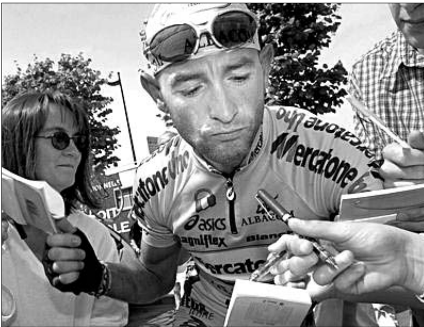
მარკო პანტანი საავტორიტეტო აღმოჩნდა

იტალიელი ველომობლი მარკო პანტანი ერთ-ერთი იმ სპორტსმენთაგანია, რომელსაც დომინგ-სკანდალმა საბოლოოდ დაუწერია სპორტული კარიერა და პირადი ცხოვრება. ვინ არ ვახსობდარა მკაცრი ნარკო-კონტროლის მსხვერპლი, ფეხბურთელებით დაწყებული და მოცურავეებით დამთავრებული. საზოგადოებას დღემდე კარგად ახსოვს ლევერკუზენის "პაიერის" ექს-თავკაცის, კრისტოფ დაუმის კოკაინ-სასამართლო პროცესი. არც გერმანელი ველომობლის, პანტანის კოლეგის, იან ულრიხის ტრავედია დავინდება ვინმეს. თუმცა, ორივე გერმანელი იტალიელზე ბევრად ძლიერი აღმოჩნდა. კრისტოფ დაუმმა ყველაფერს გაუძლო, თავის გამართლებაც შეძლო და კარიერის განაგრძობაც; თავზარდაცემული იან ულრიხიც მალე მოვიდა გონს. ერთნაირად დისკვალიფიკაცია ვაჟაკურად მოხიდა, დაქორწინდა და შეიღობა შეიძინა. შემდეგ კი ძველი პოზიციებში დაბრუნებულ დაიწყო ფიქრი, მიუხედავად იმისა, რომ მისი გუნდი ფინანსურ კრიზისში ჩავარდა და ლამის ტურ დე ფრანსზე უარის თქმა მოუხდა. "ელეფანტინოს" წოდებულ მარკო პანტანის კი, სამწუხაროდ, ასეთი ძლიერი წერვები არ აღმოაჩნდა. მან ვერ გადაიტანა ვერც ტურნირიდან მოხსნა, ვერც სასამართლოს წინაშე თავის მართლება და, წერვებდამწყვეტილმა, პადუას კლინიკაში აიყიო თავი.