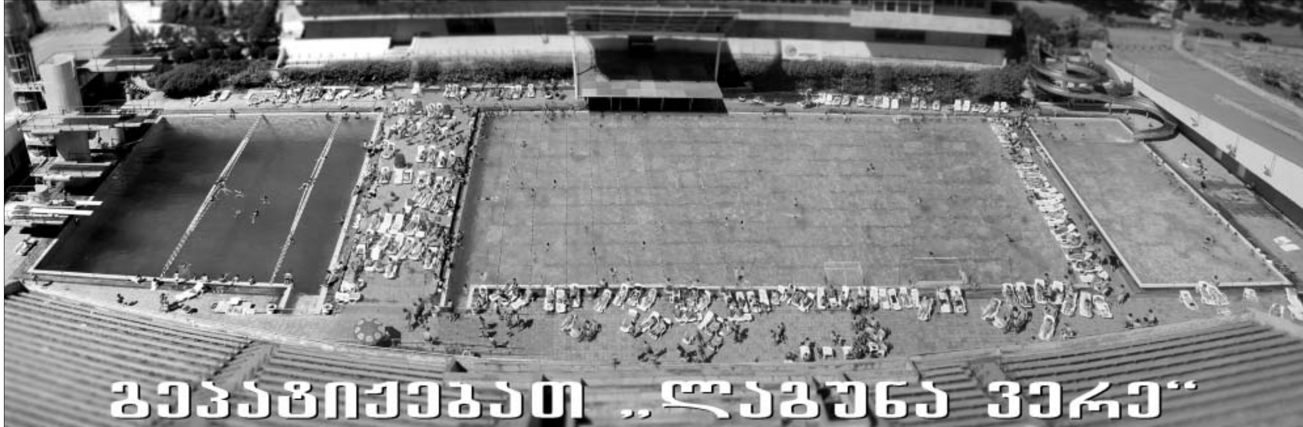
გეგმაპიქსი... „ლაგუნა ვიკი“

“დინამო” სამშობლოში 12 ივლისს დაბრუნდება.