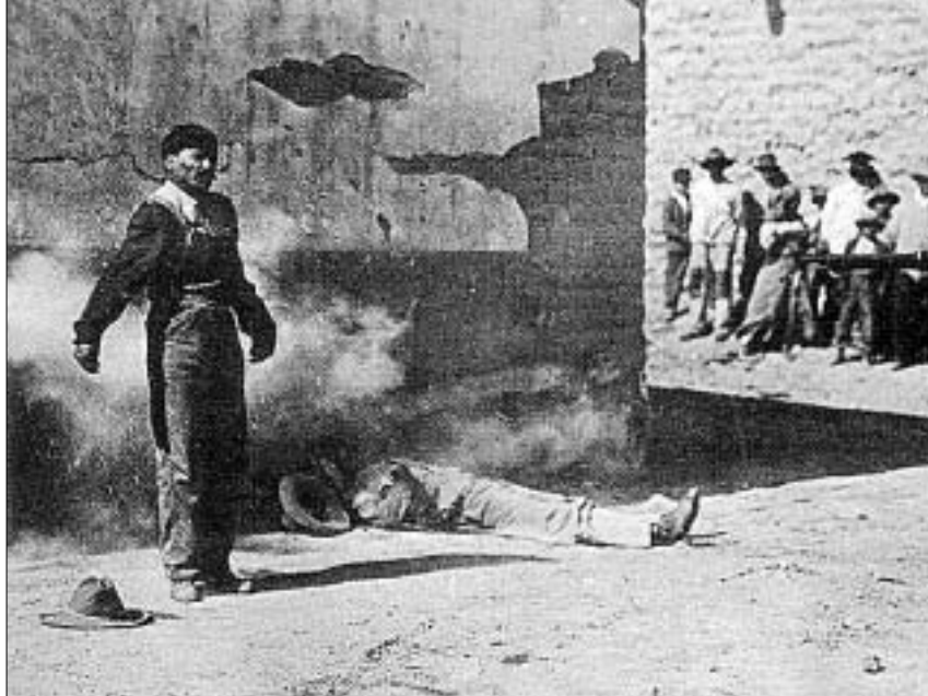
სიკვდილის დასა დახვრეტით

იუტას შტატში სნაიპერებს ეძებენ - არა მკვლელებს ან სპორტსმენებს, არამედ მოხალისე ჯალათებს. ძებნა მაისის ბოლოს დაიწყო, როდესაც სასამართლომ სასიკვდილო განაჩენი გამოუტანა ორ ბოროტმოქმედს, რომელთაც სიკვდილით დასაჯის ფორმად დახვრეტა აირჩიეს. იუტა აშშ-ს სამი შტატიდან ერთ-ერთია, სადაც დახვრეტას სიკვდილით დასაჯის "ალტერნატიულ" ფორმად იყენებენ. ორი დანარჩენი შტატი აიდაჰო და ოკლაჰომაა. ამ სამი შტატიდან დახვრეტა რეალურად მხოლოდ იუტაში იყო გამოყენებული და მხოლოდ აქ მოხდა ეს სიკვდილისჯილის თხოვნით. ოკლაჰომაში დახვრეტა მხოლოდ იმ შემთხვევაშია გათვალისწინებული, თუ ელექტრონული სკამის ან სასიკვდილო შხამის გამოყენება ანტიკონსტიტუციურად იქნება გამოცხადებული, აიდაჰოში კი - თუ სიკვდილით დასაჯის ამ ფორმებს "არაპრაქტიკული" მიიჩნევენ (ისე მაგისტ, როგორც გაგიანგვანთ). მართალია, აიდაჰოში ისინი ჯერჯერობით პრაქტიკულად აღმოჩნდა.