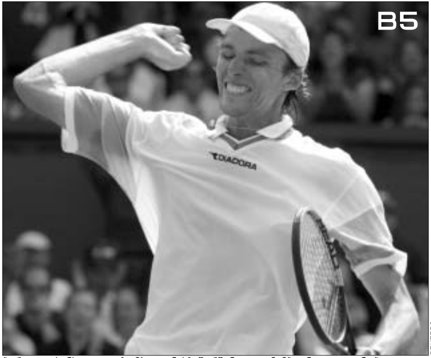
პირველი სენსაცია - უიმბლდონის მარშანდელი ჩემპიონი ლეიტონ ჰუიტი ტურნირის პირველივე წრეში გამოეთიშა.