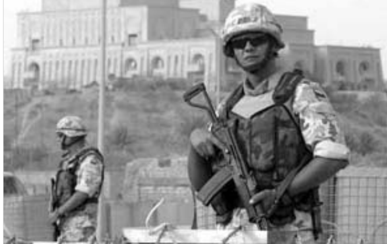
ერაყში მხარე გაკვეთილი აღმოჩნდა პოლონელებისთვის. მაგრამ ისინი გაქცევას არ აპირებენ.

პოლონეთის ახალმა მთავრობამ გადაწყვიტა, ერაყში პოლონური სამხედრო კონტინგენტის ყოფნის ვადა 2006 წლის ბოლომდე გააგრძელოს. მიუხედავად იმისა, რომ მემარცხენე პარტიების წარმომადგენლებისგან ფორმირებული პოლონეთის წინა მთავრობა ერაყიდან ჯარების გამოყვანას 2005 წლის ბოლომდე აპირებდა.