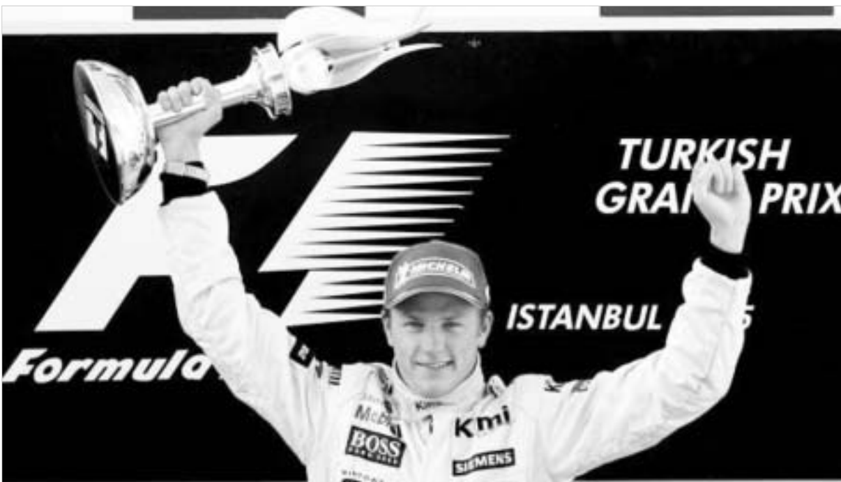
რაიკონენთან მოგება "ტოიოტას" უნდა.

ფინელით სხვა გუნდებიც დაინტერესებულან. რაც შეეხება "მაკლარენისა" და ძრავებით მათ მომმარაგებელ "მერსედესს" შეფობას, მათ ფინელთან ხელშეკრულების გაგრძელება განუზრახავთ, მაგრამ ვითარებას ამბავრებს ის ვარაუდობენ, რომ ცოტა ხნის წინათ "ვერცხლისფერმა ისრებმა" ხელშეკრულება გააფორმეს მსოფლიოს ჩემპიონ ფერნანდო ალონსოთან. ესპანელი კი, როგორც მაკლარენელთა ბოსი რონ დენი-სი აცხადებს, 2007 წლიდან "ვერ-