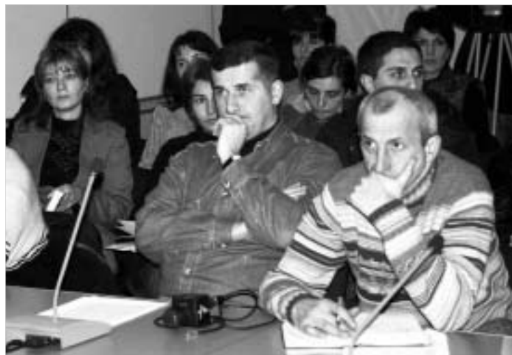
ტელევიზიის მონაწილენი თბილისში.

ქართულ-ოსური კონფლიქტის მოწესრიგების შერეული საკონტროლო კომისიის ხსენებზე, რომელიც გუშინ მოსკოვი დასრულდა, რაიმე ახალი შეთანხმება მიღწეული არ იქნა. დიდი მოლოდინის მოუხედავად, მხარეთა პოზიციების დაახლოება ვერ მოხერხდა.