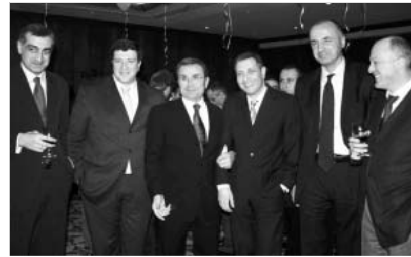
ბიზნესელიტა ქალაქის მერის და პრემიერ-მინისტრის კომპანიაში

"თქვენ ხართ ის ადამიანები, რომლებზეც საქართველოს ხელისუფლება დგას და რითიც ეს ხელისუფლება ამყარებს." - მიმართავდა სააკაშვილი შეკრებილ ბიზნესმენებს.