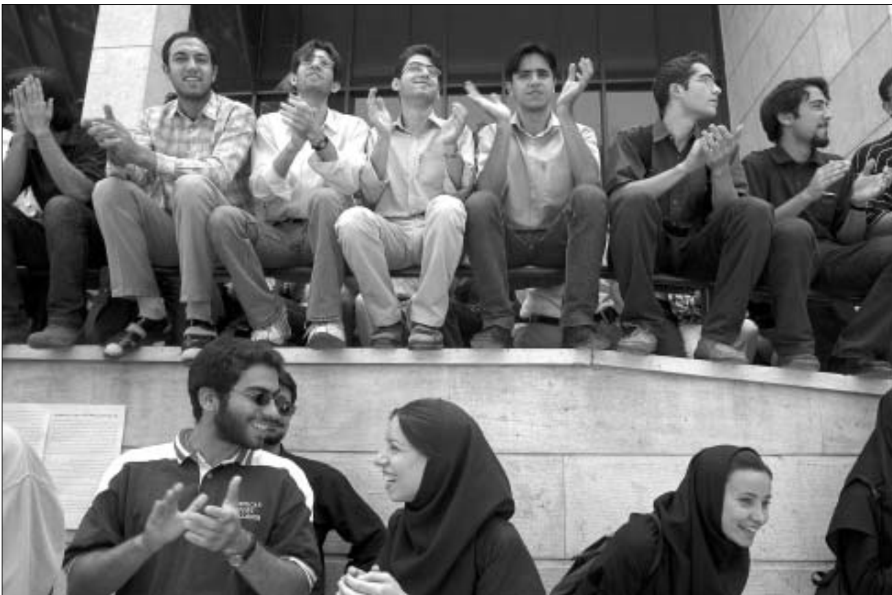
უკვე ცხრა დღეა, სტუდენტები თეირანის უნივერსიტეტში საპროტესტო აქციებს აწყობენ.

გამიზნობის იმედოვნებენ, რომ შესაძლოა, აიათოლების რეჟიმის დასაშობად აშშ-ს პირდაპირი ჩარევა არც გახდეს საჭირო. ირანში სერიოზული რეფორმისტული მოძრაობა არსებობს, რომლის ავანგარდშიც სტუდენტები დგანან.