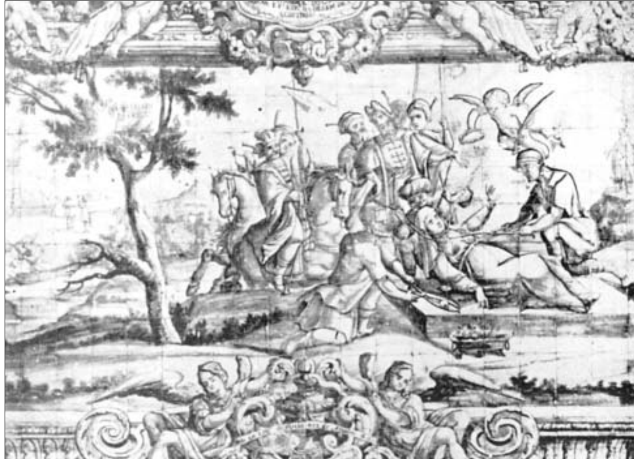
ქეთევან დედოფლის წამება შირაზში. 1624 წლის 24 სექტემბერი