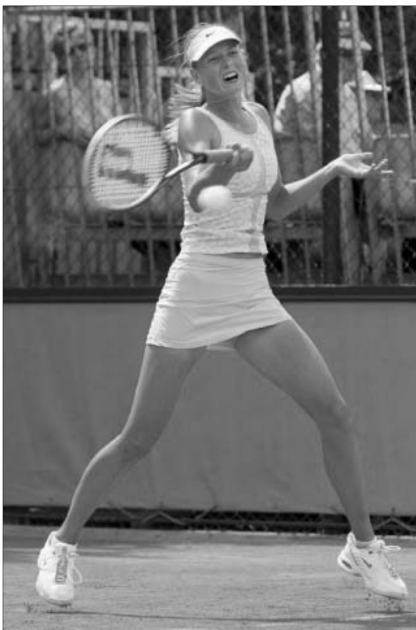
მარია შარაპოვა - "ახალი ანა"

ის მხოლოდ 22 წლისაა, მაგრამ უკვე საბუზუუმო ექსპონატად იქცა. უკვე დიდი ხანია, ჩოგბურთის სექს-სიმბოლო ანა კურნიკოვა ველარაგის აკვირვებს თავისი ნარუმატებლობით. მის უიბლდონას ყველა შეეჩვია. ახლა სპორტის მოყვარულებს ის უფრო გააოცებდათ, რაიმეს მოგება რომ მოეხერხებინა. ის და ნაგება ხომ, კარგა ხანია, განუყოფელ ცნებებად იქცნენ. წლევეანდელ სეზონში ანამ ათი მატჩი თამაშა და მხოლოდ ერთის მოგება შეძლო. ქრონიკულ პრობლემად ქცეული ზურვის ტკივილის გამო მან უიმბლდონის ტურნირზეც უარი თქვა. საბაგიროდ, აქამდე არეულ-დარეული პირადი ცხოვრებისთვის მოიცალა და მთელი მსოფლიო გააოგნა, როცა ცნობილ მომღერალთან, ენრიკე იგლესიასთან იქორწინა. სპორტული კარიერა დროებით გვერდზე დარჩა. რა გაეწყობა, თავს ზემოთ ძალა არ არის - ანა მხოლოდ სექს-სიმბოლოა და არა კარგი ჩოგბურთელი.