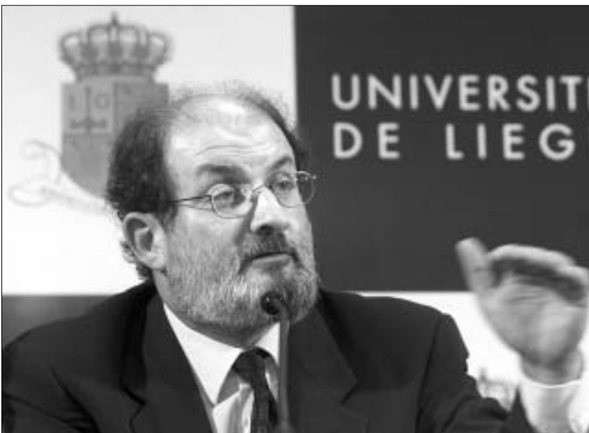
სალვან რაბი ლიეჟის უნივერსიტეტში

თითქმის იმავე დროს ისლამური რესპუბლიკის სასამართლომ ირმაში სასიკვდილო განაჩენი გამოუტანა პაშუმ აგვაჯარის – ომის ცალფეხა ვეტერანს, ჯერ კიდევ ისლამური რეოლუციის გაროქრაფზე თეირანში ამერიკის საელჩოს ალყის მონაწილეს – იმისთვის, რომ მან მოვლების მთავრობის გაკრიტიკება გახედა. იმისთვის, რომ სიკვდილით დასჯა დაიმსახურო, ირანში სულაც არაა აუცილებელი, მანინსწრემეტყველის განსჯის მიმართ გამოიჩინო უპატივცემლობა.