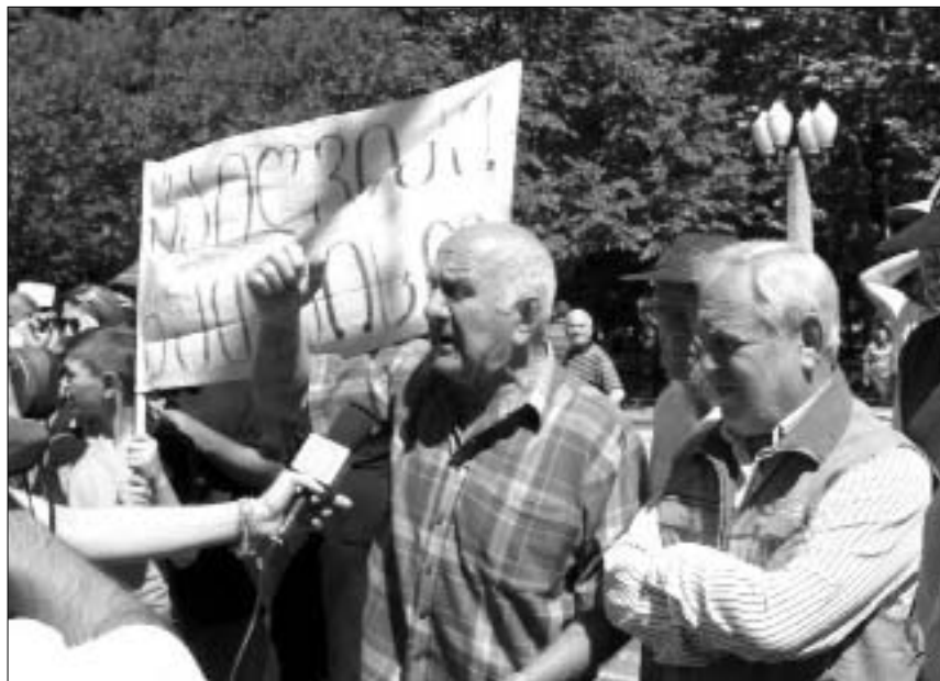
განაწამები ქუთაისელები ცხოვრების ელემენტარულ პირობებს ითხოვენ.

გუშინ ლესელიძის ქუჩის მაცხოვრებლებმა რაჭა-ლეჩხუმისკენ მიმავალი გზა მორებით ჩახერგეს. ლესელიძის ქუჩაზე, რომელსაც ჭომახაც ეძახიან, 10 დღეა შუქი თვალთ არ უნახავი; არ მიეწოდებათ წყალიც. შეიძლება ითქვას, რომ ჭომახელები ბუნებამაც განირობა და ხელისუფლებამაც. მოსახლეობას პრობლემები ჯერ კიდევ მაშინ გაუჭნადა, როდესაც რონძესის კაშხლის მარჯვენა ნაწილში მდინარემ კალაპოტი იცვალა და 200 კვ.მეტრი მინაჩა-