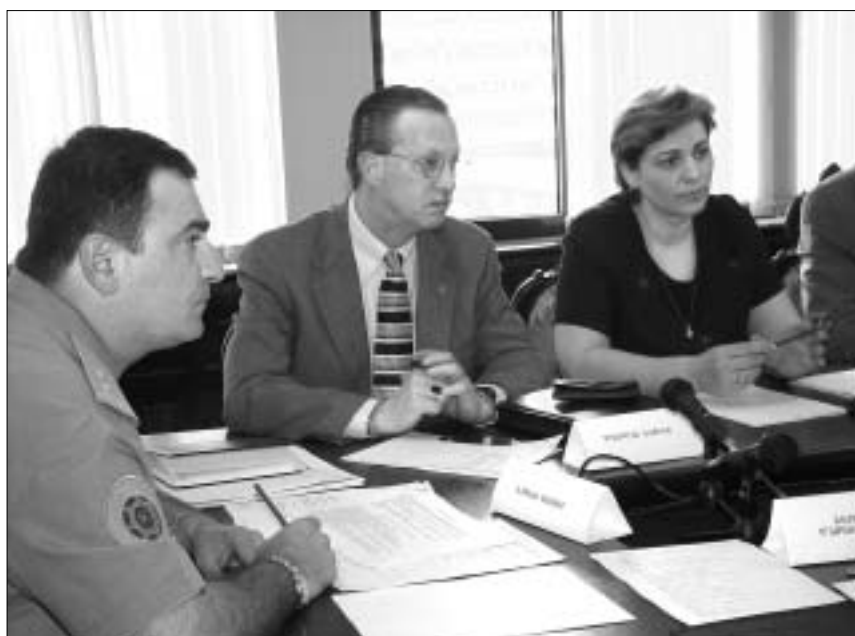
დეგლას სკოტი (შუაში) გენერალური ინსპექციების შექმნას კორუფციასთან ბრძოლის ეფექტურ საშუალებად მიიჩნევს.

გენერალური ინსპექციების ხელმძღვანელთა თქმით, კორუფციასთან მებრძოლი ანალოგიური საშაზურები სხვა სამინისტროებსა და სახელმწიფო უწყებებშიც შეიქმნება მას შემდეგ, როცა პარლამენტი "გენერალური ინსპექციების შესახებ კანონს" მიიღებს. თუმცა, გუშინდელ შეხვედრაზე მაინც ბუნდოვანი დარჩა, რა ნიშნის მიხედვით გაერთიანდნენ ძალიანია სტრუქ-