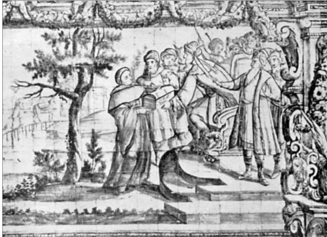
მამა ამბროზიო დუშ ანჟუში თეიმურაზ პირველს გადასცემს ქეთევან დედოფლის წმ. ნაწილებიან ყუთს