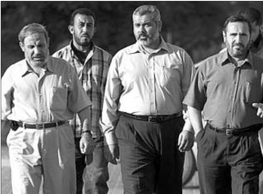
პამასის ლიდერები უკან არ იხივენ.

ლობდნენ, ისრაელის მხარე ლაზას სექტორში განხორციელებული ქვესი სარაკეტო დარტყმის უქმედგობაში დაერწმუნებინათ.