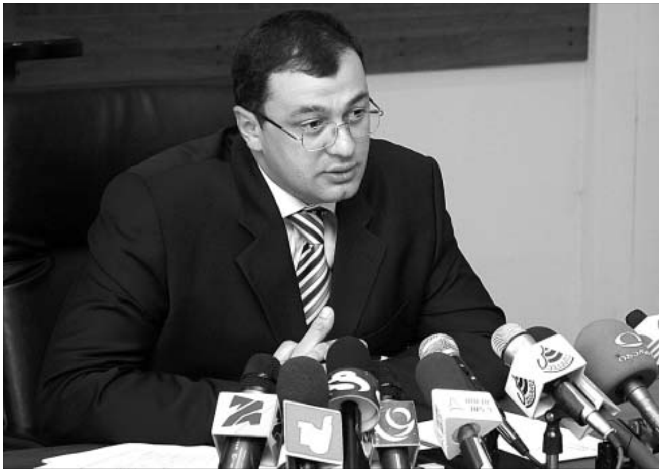
გოგიაშვილი ისე მხნედ ვეღარ გამოიყურებოდა, როგორც - წინა დღეს.