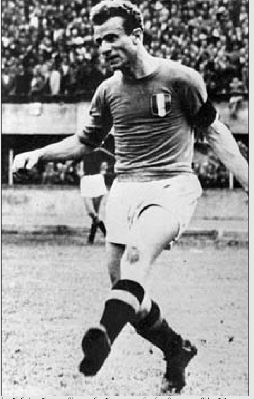
"ტორინოს ტრაგედიაში" ლეგენდარული ვალენტინო მაკოლა იმსხვერპლა

1949 წლის 4 მაისს ისინი ლისაბონიდან ბრუნდებოდნენ, სადაც მორიგ გამარჯვებას მიაღწიეს ადგილობრივ "ბენფიკასთან". ბორტზე სულ 28