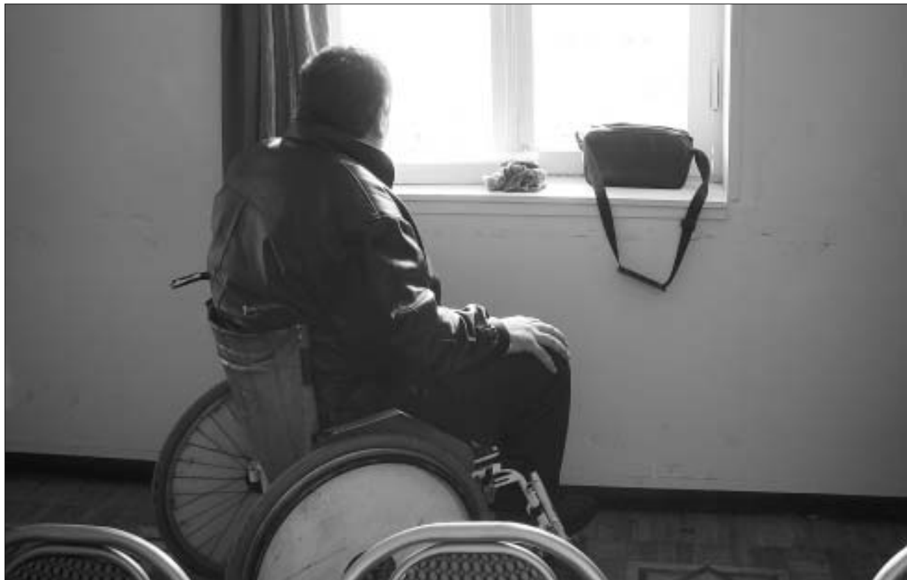
მოსახლეობის ერთ-ერთი ყველაზე დაუცველი ფენა ხელისუფლებამ ისევ მოატყუა.

ბიუჯეტო შემოსავლების აღრიცხვით ხელისუფლების პირველი პირები - პრეზიდენტი ედუარდ შევარდნაძე, პარლამენტის თავმჯდომარე, ნინო ბურჯანაძე, სახელმწიფო მინისტრი, ავთანდილ ჯორჯენაძე - საქართველოს უნარშეზღუდულ პირობებსა და ომის შეტერაზე სულ რაღაც ექვსი თვის წინათ ფლარბონის დიდ საკონცერტო დარბაზში, მათ პირველ ყოვლისაზე ეუბნებოდნენ. საქართველოს ხელისუფლებას ამჯერადაც მიკვლევს ხეობა ადამიანები.