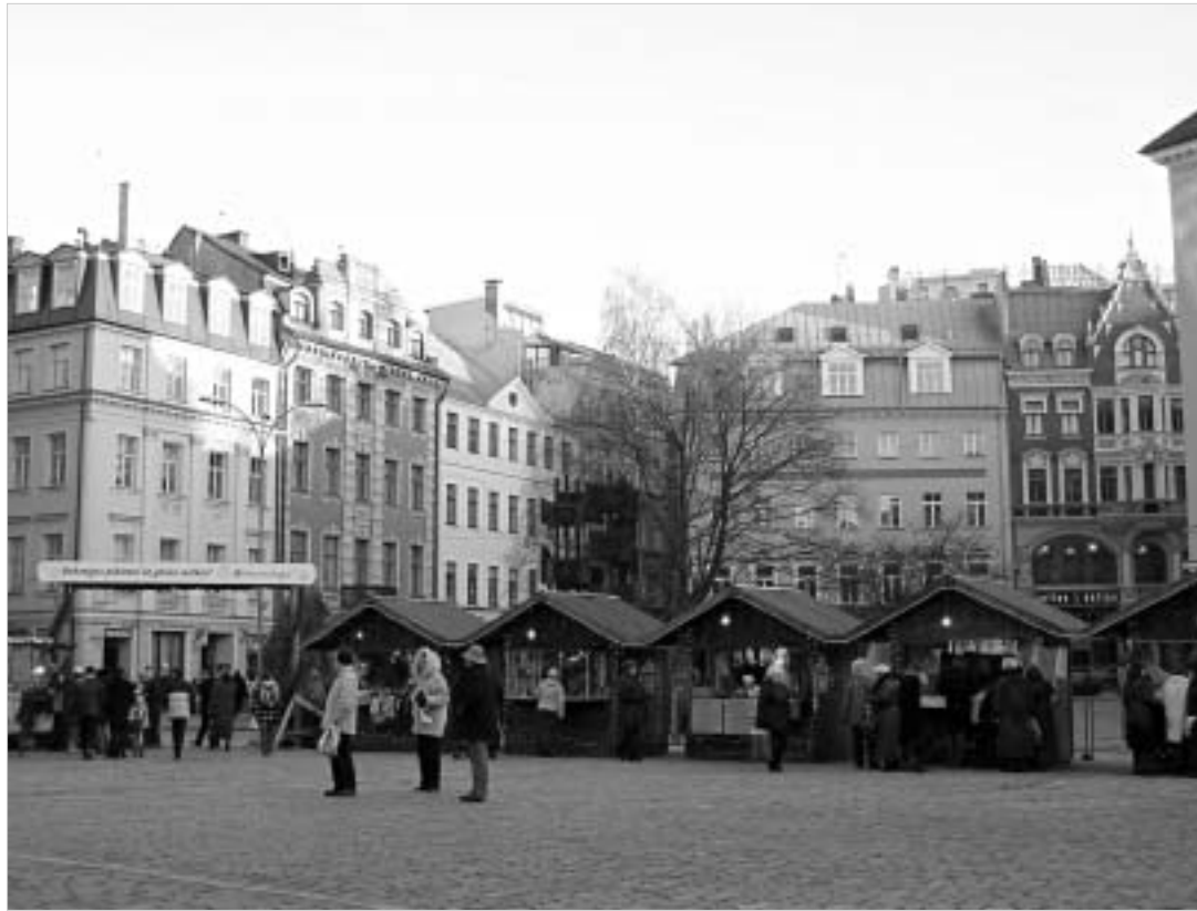
წინასაშობო ბაზრობა რიგის ცენტრში.

მიუხედავად თავიდანვე არჩეული მკვეთრი პოლიტიკური კურსისა ევროინტეგრაციის მიმართულებით, ევროკავშირში გაწევრიანებას ლატვიის მიერ არსებული საკმაოდ ბევრი მონინალდმდევე გა-