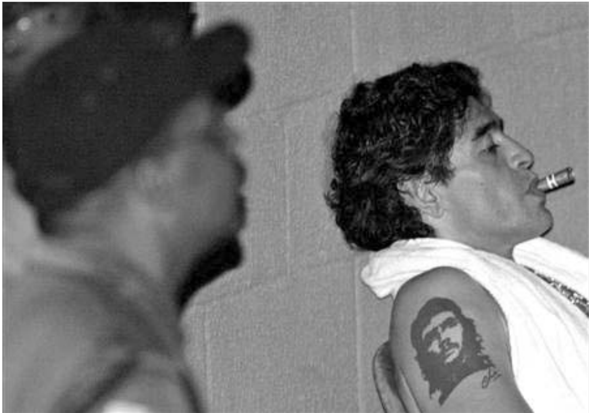
საქველმოქმედო მატჩის შემდეგ მარადონამ კუბური სიგარაც გააბოღა.

როი დე უაინეროდან ბუენოს აირესში მიმავალი ფეხბურთის ლეგენდა, 1986 წლის მსოფლიო ჩემპიონატის ტრუმფატორი დიეგო მარადონა რიის საერთაშორისო აეროპორტში დააკავეს.