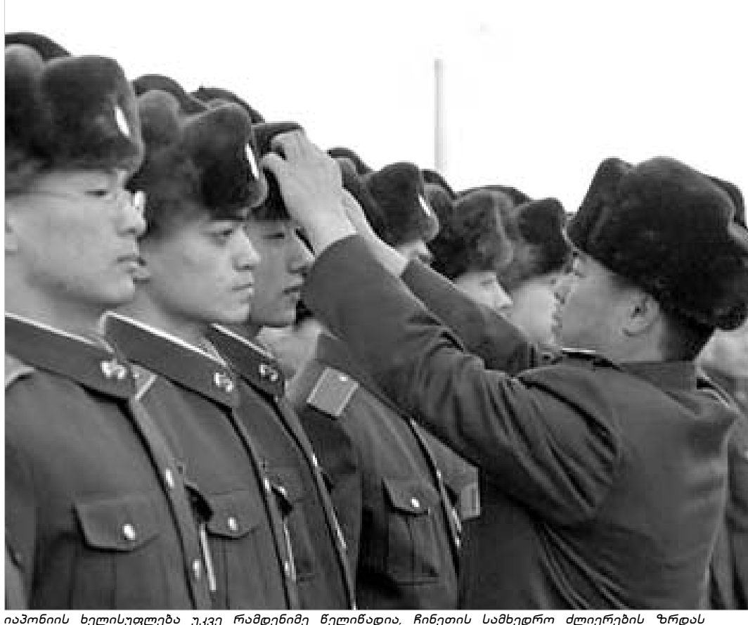
იაპონიის ხელისუფლება უკვე რამდენიმე წელიწადია, ჩინეთის სამხედრო ძლიერების ზრდას ნომერ პირველ საფრთხედ აღიქვამს.