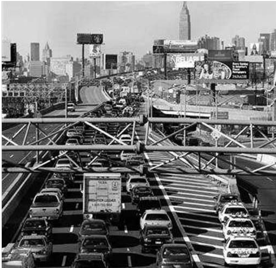
მუნიციპალური ტრანსპორტის გაჩერება მეგაპოლისის ყოველდღიურ ცხოვრებას აფერხებს.