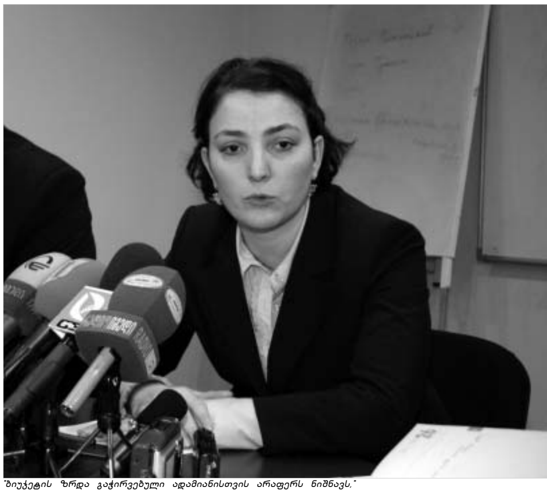
ბიუჯეტის ზრდა გაჭირვებული ადამიანების არაფერს ნიშნავს.