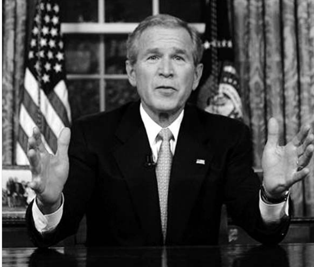
ბუშის თქმით, ათი ერაყელიდან შეიძენ მიარჩია. რომ ქვეყანაში არსებული ვითარება სასიკეთოდ იცვლება.