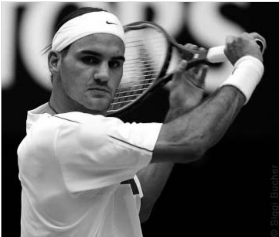
წლის საუკეთესო ჩოგბურთელები: როფე ფედერერი და კიმ კლისტერსი.