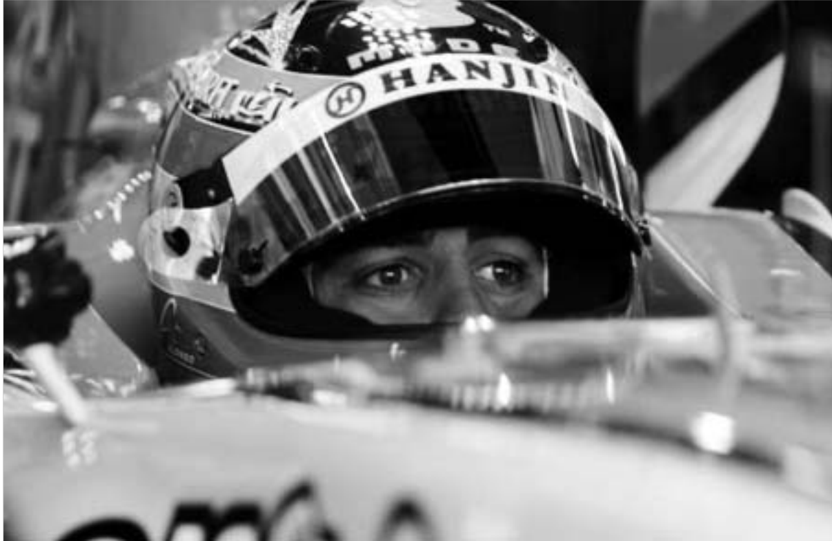
ალონსო რენოს კოპიტსში გაისადავ ჩაქდება და მერე წავა.

გაისად ფორმულა 1-ის საჯინოებს ჩვეული თავსატეხი გაუჩნდება: რომელი მრბოლი გადაიბირს, ვის შეელონ. საკუთარ გუნდებთან ხელშეკრულებები ეწერებათ ჯანკარლო ფიზიკელას, მიხაელ შუმხერს, ფელიპე მასას და კიმი რაიკონენს. სამეფო რბოლათა ყველაზე ახალგაზრდა ჩემპიონი, "რენოს" ესპანელი პილოტი ფერნანდო ალონსო 2007 წლიდან "მაკლარენის" გუნდს შეუერთდება.