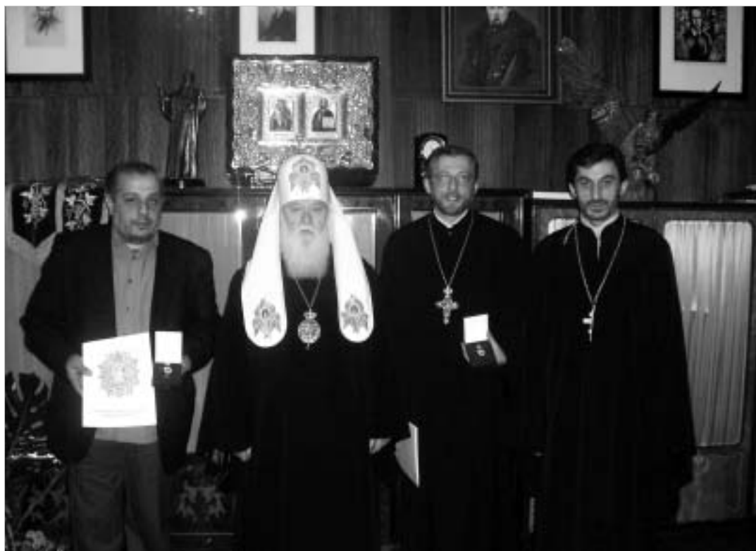
საეკლესიო ორდენებით დაჯილდოება.