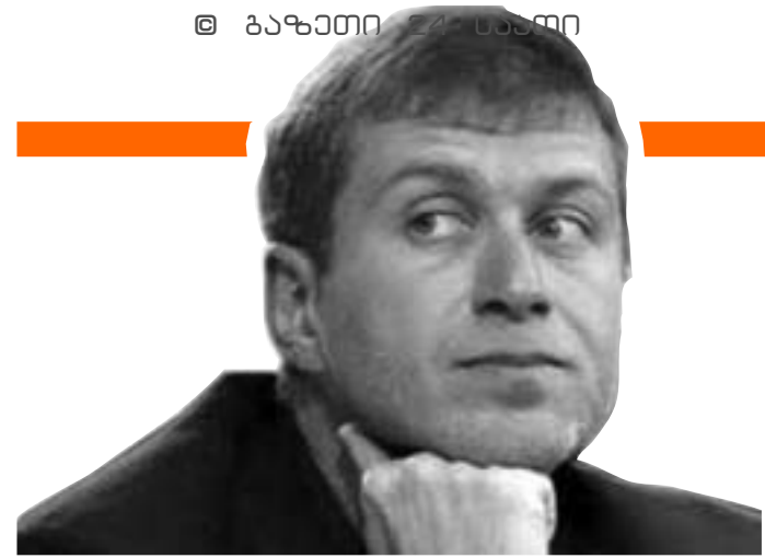
აბრამოვიჩი საგამომცემლო სახლს ყიდულობს

ჩელსის მფლობელის, რომან აბრამოვიჩის რუსულ მედი-აბაზარზე დაქვემდებარება შეიძლება ითქვას უკვე შედგა. კომპანია Millhouse-მა, რომელიც რომან აბრამოვიჩის ინტერესებს წარმოადგენს, საგამომცემლო სახლს "კურიერის" საკონტროლო პაკეტი შეიძინა. კომპანიაში გამოცემლობის 60% გასულ კვირას შეისყიდა. გარიგების თანხა ჯერ ცნობილი არ არის, თუმცა შეიძლება ითქვას, რომ საქმე რამდენიმე ათას დოლართან გვაქვს.