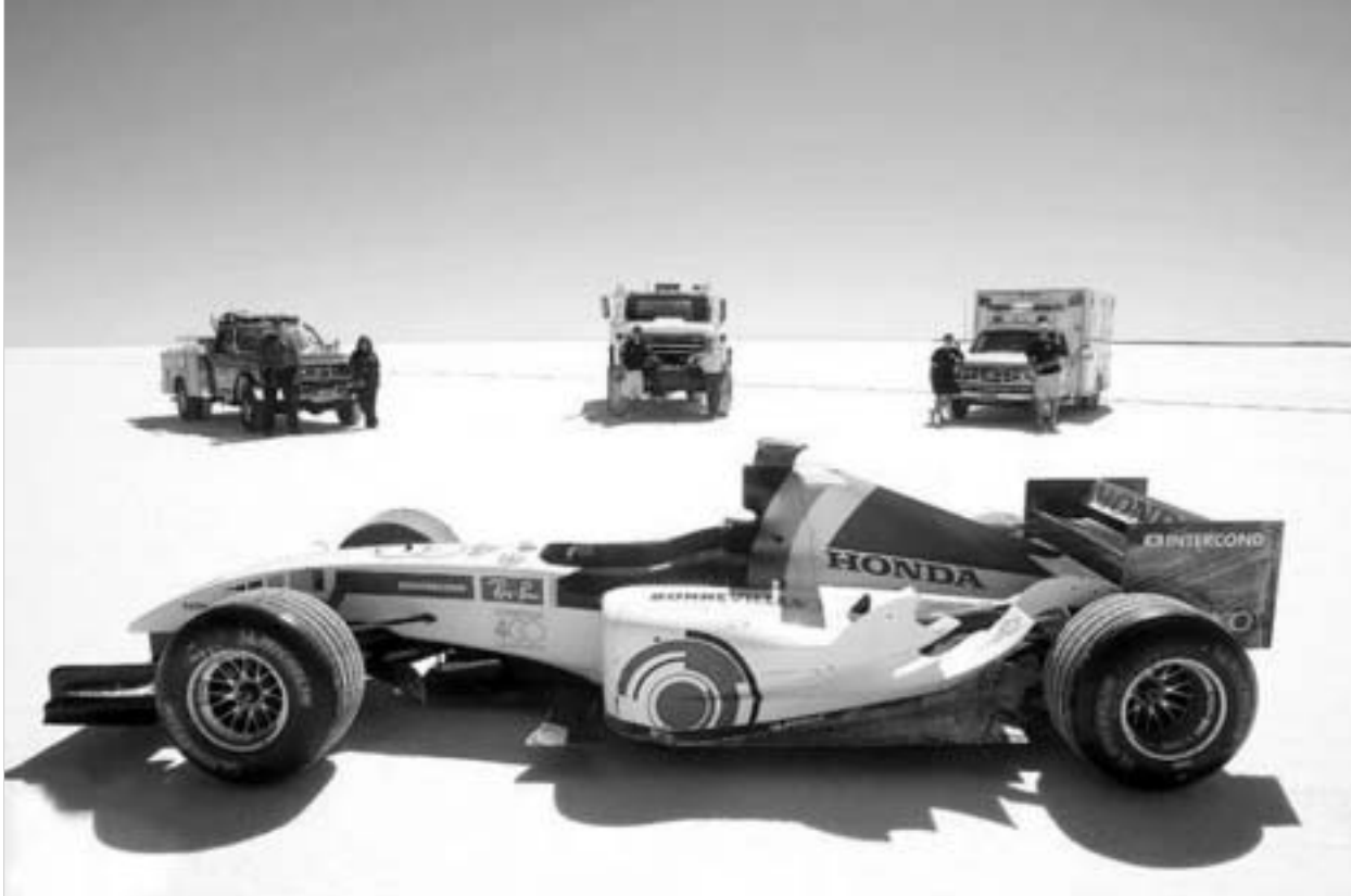
ჰონდამ ბონევილის უდაბნოში რეკორდი დაამყარა

"ფერარი" და "რენო" ერთმანეთის ალი-კვალაი