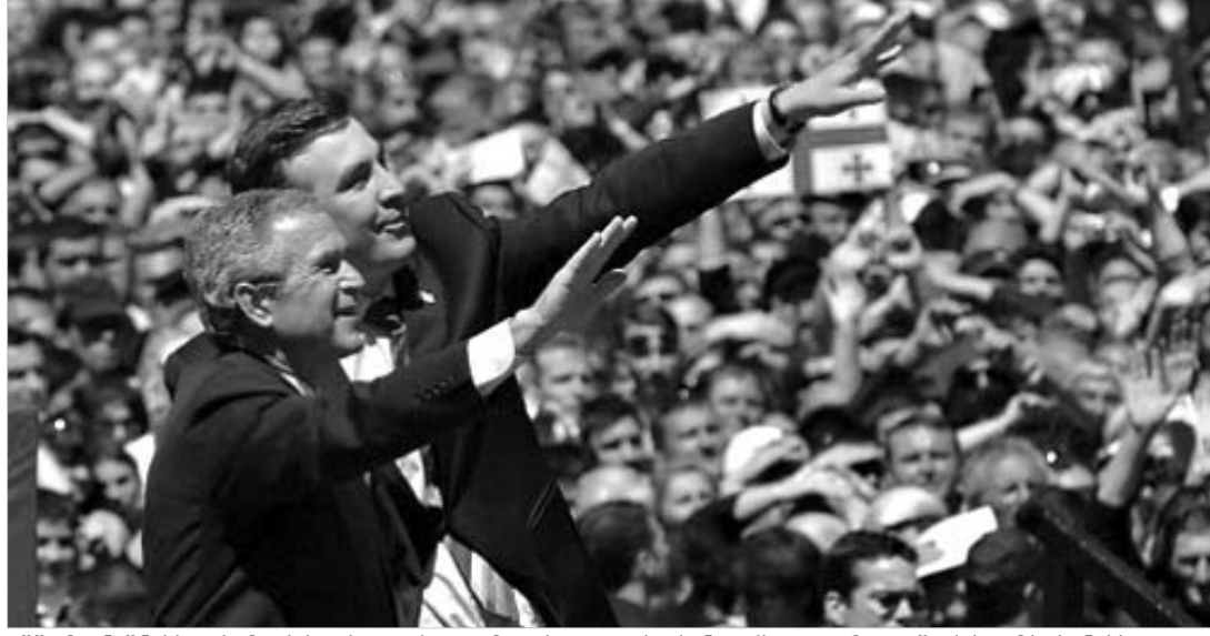
აშშ მინისტრებს, რომ რუსეთს უფრო დემოკრატიულ პარტნიორსა და მოკავშირეს ამტკობინებს.

დინიტრი ავალიანი მიხეილ სააკაშვილისა და ჯორჯ ბუშის შეხვედრაზე აფხაზეთისა და სამხრეთ ოსეთის კონფლიქტების თემის განხილვა, უშუალოდ „დიდი რვიანის“ სამიტის წინ, მოწმობს, რომ თავად სამიტზე ამ საკითხს გვერდს არ აუღლიან. ამავე დროს, აშშ-ს წარმომადგენლები აღნიშნავენ, რომ ვაშინგტონისთვის ძალზე დიდი მნიშვნელობა აქვს საქართველოში მიმდინარე დემოკრატიულ რეფორმებს. ბაზრქალაბა A3 ბაჰრძევა