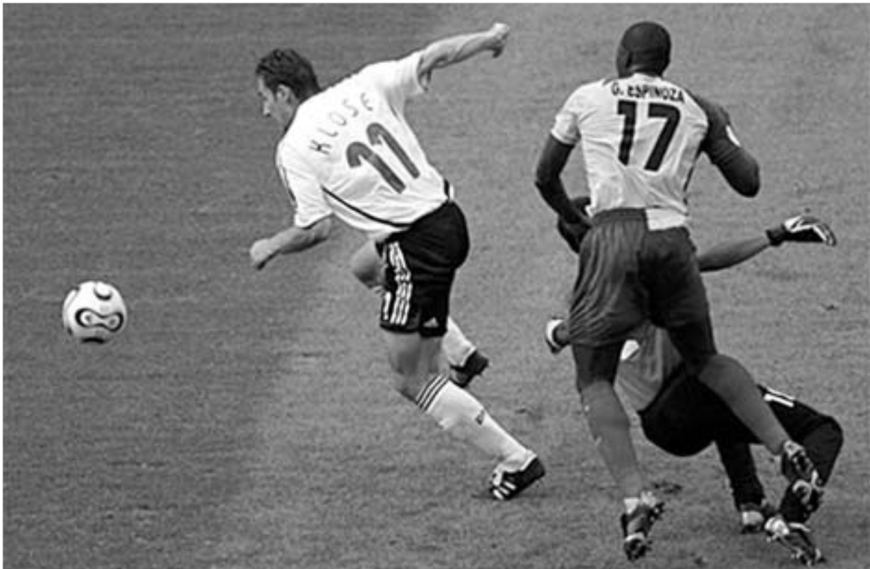
მიროსლავ კლოზეს მეორე გოლი.

გერმანიის ნაკრებმა ჯგუფური ტურნირის ბოლო მატჩიც მოიგო და კლინსმანის გუნდს ასპროცენტიანი მაჩვენებელი აქვს. მიროსლავ კლოზე კი ტურნირის საუკეთესო ბომბარდირის ტიტულის მოპოვების მთავარ პრეტენდენტად