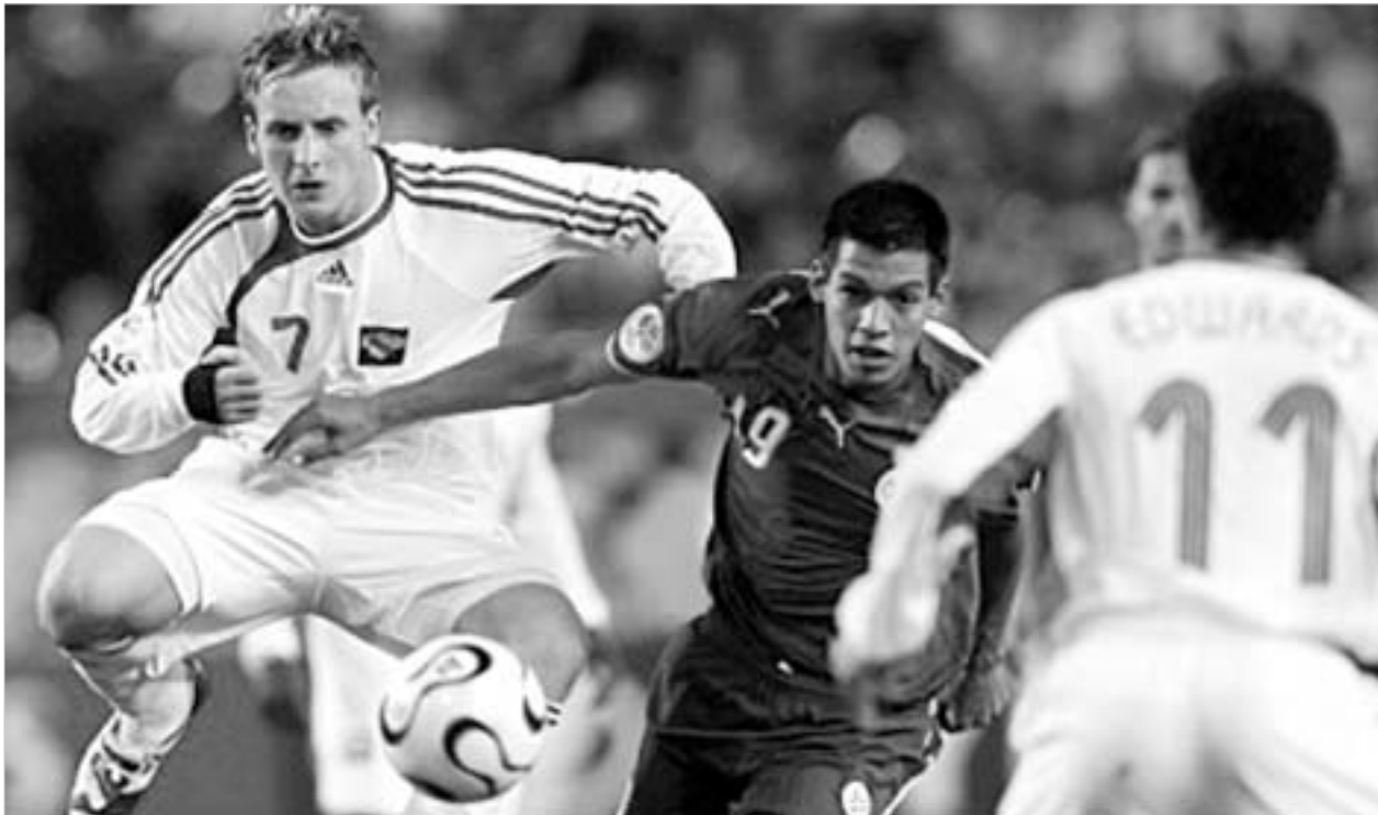
ტრინიდადელებს როკე სანტა კრუზის შერჩერება გაუჭირდათ.

პარაგვაისა და ტრინიდადი და ტობაგოს გუნდმა, შეიძლება ითქვას, საკუთარი თავის წინაშე ვალი მოიხადეს. პარაგვაისთვის, უდავოდ, სირცხვილი იქნებოდა მსოფლიო ჩემპიონატი გატანილი გოლიდან და ქულის გარეშე დაეტოვებინა და ამიტომ პარაგვაელები ბრძოლისთვის განწყვენენ. მათ მიზანს