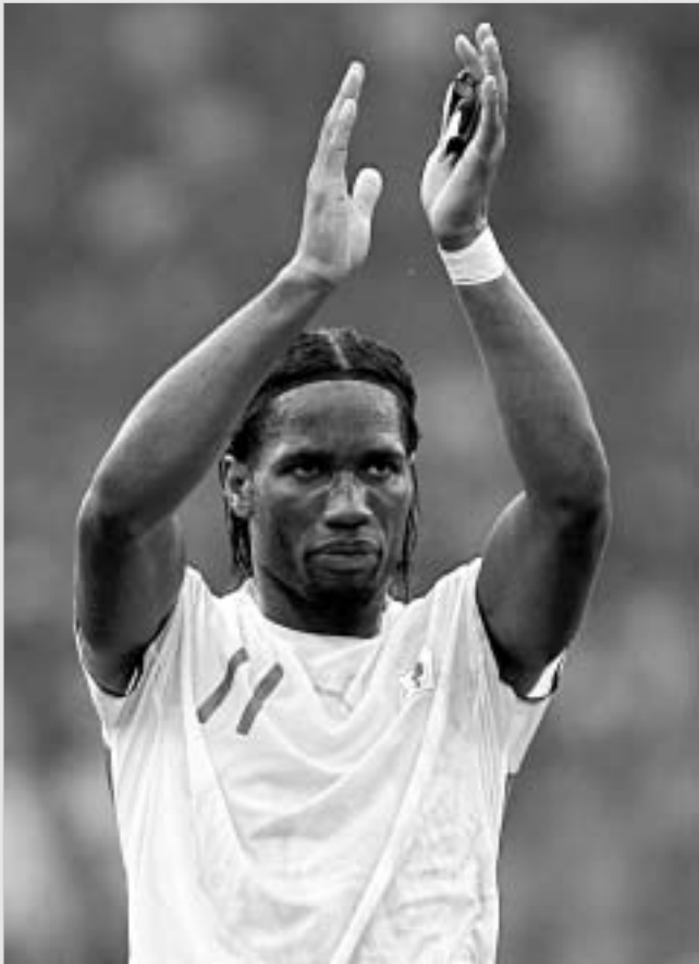
თანამედროვე ფეხბურთში აფრიკელს დიდი როლი აქვთ ვარსკლავების ჰაპინი

ჯერ კიდევ ათი წლის წინ საერთაშორისო ფეხბურთში სამაგალითო, პატრიარქალური წესრიგი სუფევდა. ისე, როგორც ძველ, საგვარეულო სახლში - იყო სასტუმრო დარბაზები და იყენებნ მათი ტიტულოვანი მფლობელები. იყო "ადამიანური" ოთახები - მსახურებისთვის. მსოფლიოსა და ევროპის ჩემპიონატებზე მსახურიც მხოლოდ მსახურის რანგში მონაწილეობდა და "თავადებს" ქულებს ართმევდა. ერთი სიტყვით, საფეხბურთო ცხოვრება ყველასთვის თანაბარი, გასაგები და არცთუ ძნელად პროგნოზირებადი იყო.