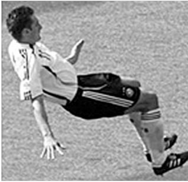
ფეხბურთო სამშობლოს" მიმართ მადლიერება ასე გამოხატა. თუმცა, მუნტარის ამ მოულოდნელი საქციელის-