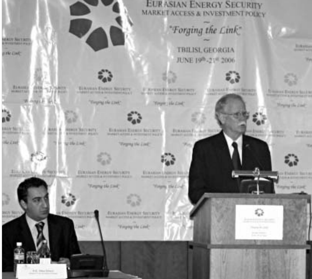
საქართველოს, როგორც სატრანზიტო ქვეყნის როლი, ენერჯისფერ-თხოვბის გაზრდას ითხოვს.

ენო ნაჩროვი სამდლიანი კონფერენცია - „ევრაზიის ენერჯისფერ-თხოვბა, ბაზრის მისაწვდომობა და საინვესტიციო პოლიტიკა“ სასტუმრო „ქორთიარდ მარიოტში“ პრეზიდენტ მიხეილ სააკაშვილის ხელმძღვანელობით, საქართველოს მთავრობისა და საერთაშორისო ენერჯეტიკის სააგენტოს ორგანიზებით მიმდინარეობს. შეხვედრის მიზანია ევრაზიის რეგიონში ცენტრალური აზიის გაზის როლისა და მნიშვნელობის ამაღლების, ასევე, ამ გზით კომერციული ენერჯისფერ-თხოვბის გაძლიერებისა და რეგიონის ენერჯისფერ-თხოვბით მომარაგების გაუმჯობესების პერსპექტივების განხილვა. კონფერენციის გახსნას, მისი მნიშვნელობიდან გამომდინარე, საქართველოს პრეზიდენტ მიხეილ სააკაშვილი, პრემიერ-მინისტრი ზურაბ ნოღაიდილი, მთავრობის წევრები, მათ შორის, საგარეო საქმეთა მინისტრი გელა ბეჟუაშვილი და ენერჯეტიკის მინისტრი ნიკა გილაური დაესწრნენ. ბაზრქალაბა A3 ბაჰრძევა