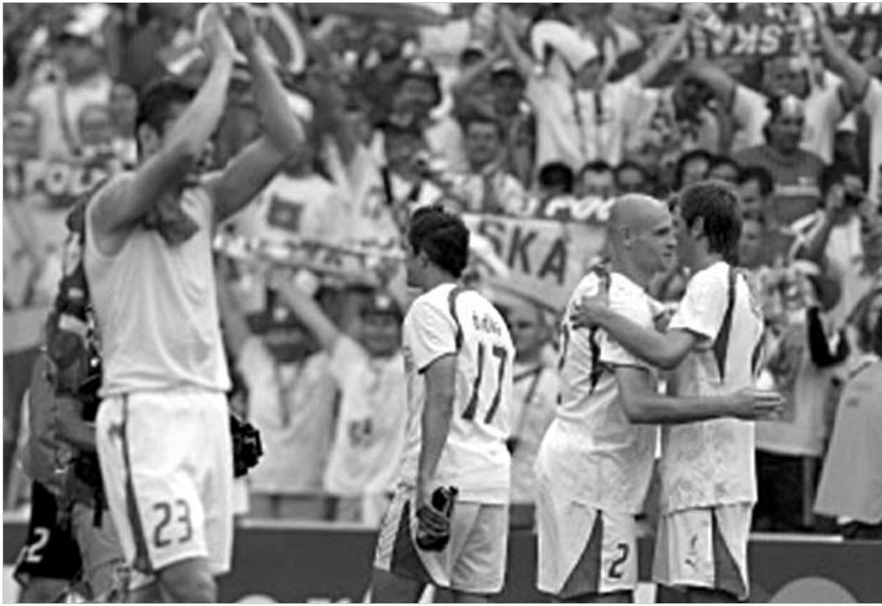
პოლონეთი მენდილს ემშვიდობება.

პოლონეთისა და კოსტა რიკის ნაკრები გუნდების მატჩს არანაირი სატურნირო მნიშვნელობა არ ჰქონია. მეორე ტურის შემდეგ ორივე გუნდი დაკარგული ჰქონდა შემდეგ ეტაპზე გასვლის შანსი და ბოლო ტურის მატჩი მხოლოდ სიმბოლურ