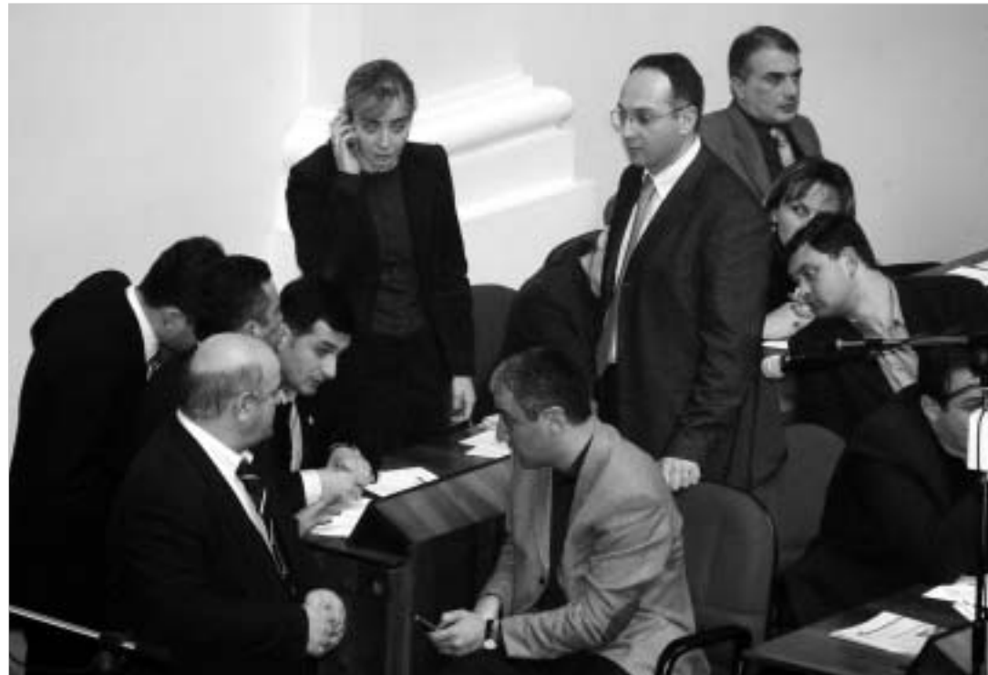
საკონსტიტუციო პროექტის ჩაყარვამ უმრავლესობა ააღელვა.