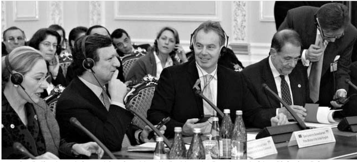
ყველაზე წარმატებული სამიტი აქამდე ჩატარებულს შორის - ასე შეაფასა უკრაინის იუშენკომ გუშინდელი დღე

შეცხრე სამიტზე კიევში ჩასულ ევროკავშირის დელეგაციას დიდი ბრიტანეთის (ევროკავშირის მოქმედი თავმჯდომარე) პრემიერ-მინისტრი