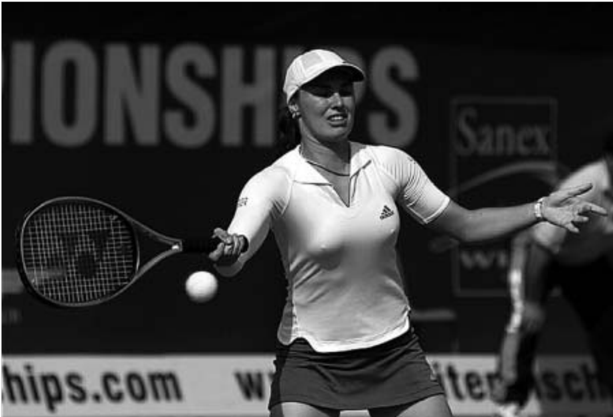
პინგისი იანვრიდან ათამაშდება.

მსოფლიოს ყოფილი პირველმა ჩოგანმა შვეიცარიელმა მარტინა პინგისმა პროფესიულ ჩოგბურთში დაბრუნება გადაწყვიტა. პინგისი 16 წლის ასაკში გახდა მსოფლიოს პირველი ჩოგბურთელი. მან "დიდი სლემის" 5 ტურნირში მოიგო ერთეულთა თანრიგში და 9 წყვილებში. 2003 წელს პინგისმა პროფესიული კარიერის დამთავრების შესახებ განაცხადა. ამის მიზეზი ფეხების სერიოზული ტრავმა გახდა. 25 წლის შვეიცარიელმა ნელს ტალიანდის ტურნირზე ერთი მატრი ითამაშა. ის გერმანულ მარლენ ვაინგარტნერთან შეხვედრაში დამარცხდა.