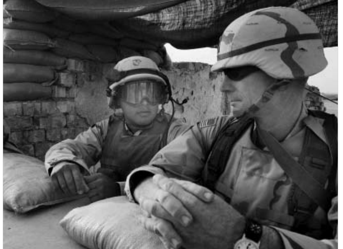
სხვები დაიხილენ ჩვენი თავისუფლებისთვის - ახლა კი ჩვენი ქრია" - აცხადებს აშშ-ს პრეზიდენტი.