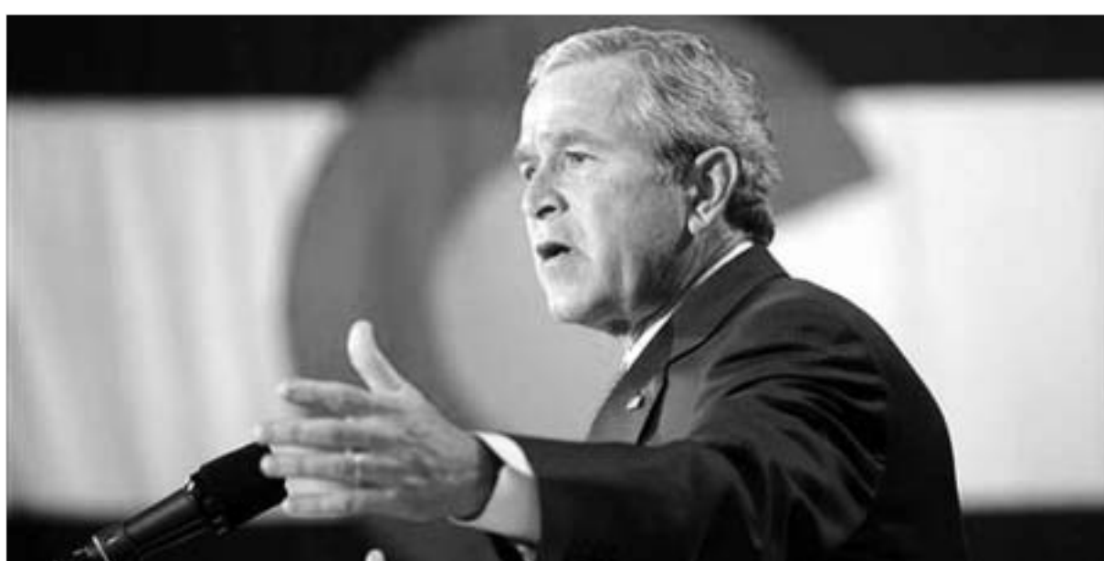
"ამერიკის არასოდეს დაუხვია უკან მანქანების ამფეთქებელთა და მკვლელთა წინაშე და სანამ მე ვარ მთავარსარდალი არც არასოდეს დაიხუტა."

ერაყიდან ამერიკული ჯარების გამოყვანის თაობაზე ბოლო დროს გახშირებული მოთხოვნების საპასუხოდ, აშშ-ს პრეზიდენტი-ის ადმინისტრაციამ გამოაქვეყნა სტრატეგიული გეგმა, რათა ყველა სფეროს დაემტკიცებინა (როგორც ქვეყნის შიგნით, ასევე გარე-საზოგადოებო), რომ ერაყში ნარმატების მიღწევის რეალური გეგმა აქვს.