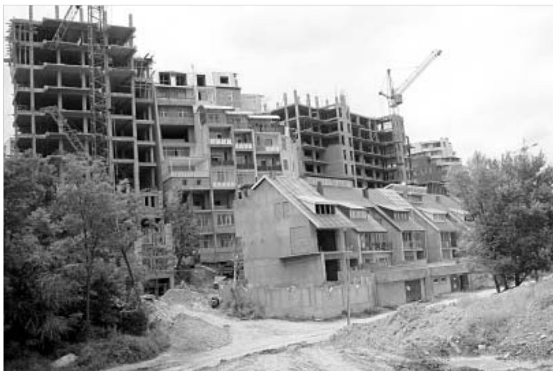
მშენებლობა. რომლის არქიტექტურული სახის განსაზღვრა ძალზე რთულია.