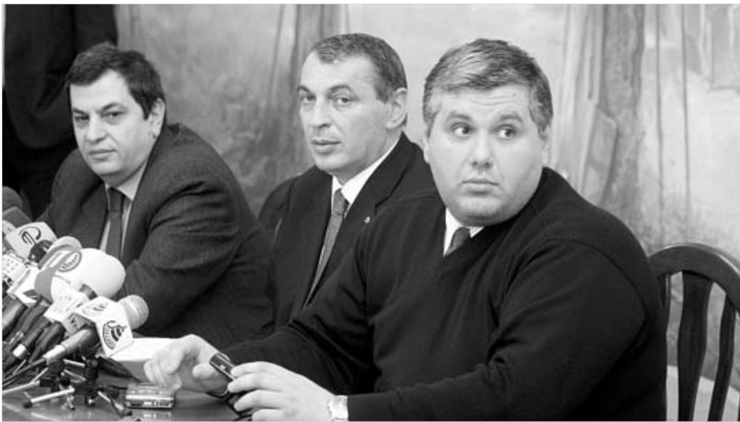
ოპოზიცია კომპრომიზზე წასვლას არ აპირებს.