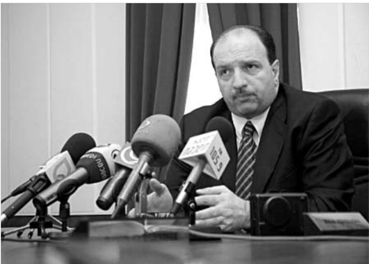
ძებნილი ყოფილი მინისტრი საფრანგეთში იმყოფება.

როგორც ცნობილია, მამუკა ნიკოლაიშვილის წინააღმდეგ სისხლის სამართლის საქმე სამეგრელო-ზემო სვანეთის რეგიონის პროკურატურაში ცოტა ხნის წინ აღიძრა. გამოძიების მტკიცებით, ნიკოლაიშვილმა სახელმწიფო ქონება დაბალ ფასად გაყიდა და ამით სახელმწიფოს ასიათასობით ლარის ზარალი მიყენა. საქმე ეტება ენგურჰესის ტერიტორიიდან გატანილ ჯაროს. სამართალ-