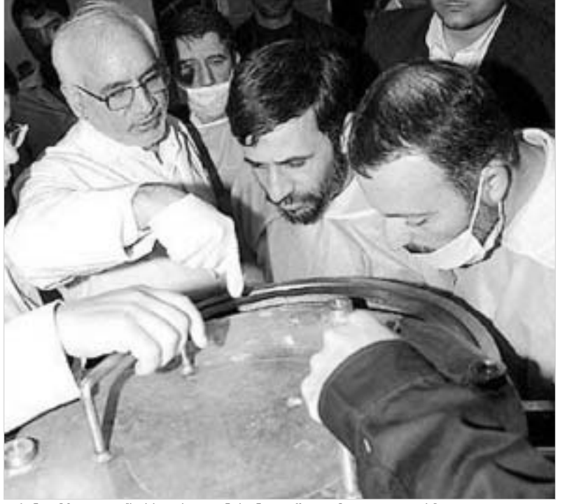
ირანი შაბადი. 'სისხლის უკანასკნელ წვეთამდე დაიცავს' თავისი ბირთვული პროგრამა.

საფურცლებზე, რომ ჯერ კიდევ გასულ თვეში, ვენის შეხვედრაზე რუსეთმა წამოაყენა წინადადება, რომლის მიხედვითაც ურანის გამდიდრების პროცესისა და ბირთვული გამოკვლევების გაგრძელება შეიძლება რუსეთის ტერიტორიაზე. თუმცა, შეხვედრის მონაწილეებმა განაცხადეს, რომ რუსეთის წინადადება ძირითადი საკითხის დროულად განხილვას ხელს შეუშლიდა და აღნიშნული პროცესის შეწყვეტას გამოიწვევდა. ამერიკის შეერთებული შტატები, რომელიც კატეგორიულად მოითხოვს ურანის გამდიდრების პროგრამის შეწყვეტას, არ ეთანხმება რუსეთის მხარის წინადადებას უფლება მისცენ ირანს, საერთაშორისო ატომური ენერჯის სააგენტოს ზედამხედველობის ქვეშ გააგრძელოს ბირთვული გა-