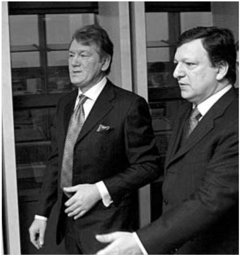
ცხადია, მოვლენების ამ სცენარით განვითარებაზე სულაც არ ოცნებობს უკრაინის ამჟამინდელი პრეზიდენტი. რუსული გაზეთი "იზვესტია" წამოაყენებს "ერთ-ერთ ლიდერზე დაყრდნობით,