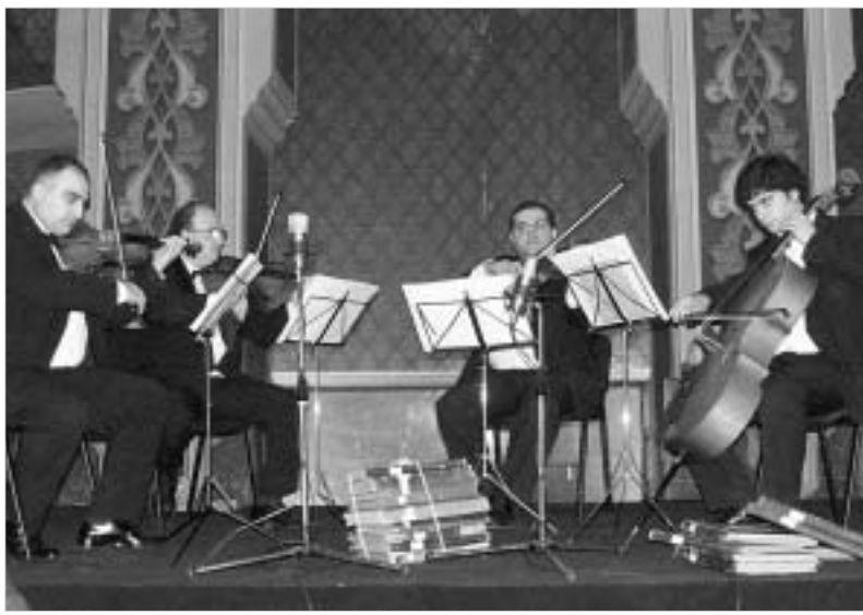
მუსიკოსები ოპერის თეატრში

ოპერის თეატრის შენობაში არის ერთი დარბაზი, რომელსაც ზოგი წითელს ეძახის, ზოგიც კიდევ ჭრელს. ჭრელს ალბათ ვიტრაუების გამო, წითელს კი იმიტომ, რომ მისი კედლების არაბესკები წითელ ფონზეა წარმოდგენილი, ოღონდ ისეთ წითელზე არა, მატისმა რომ მოიფიქრა, სხვაგვარზე, უფრო მუქსა და უფრო ძველებურზე. ალაგ-ალაგ წყლის ჩამონადენებით. ამას მალე გამოასწორებენ, მაგრამ სანამ ასეა, მასაც მოეძებნება თავისი რომანტიკა. ის ხომ ულევად გვაქვს, მით უფრო მაშინ, როცა სანთლებს დაანთებენ, ამალელებულ სცენაზე კი ძველი პარტიტურების ლამაზად დაძველებულ წიგნებს მიმოაბნევენ და სრული კომფორტისთვის ჯერ მოცარტს დაგვიკრავენ, მერე კი ჰაიდნს შესაბამისად.