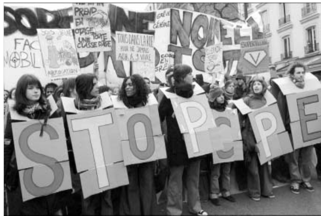
სტუდენტთა აზრით, ახალი კანონი უზუზურობს კი არ შეამცირებს, არამედ უფრო გაზრდის.