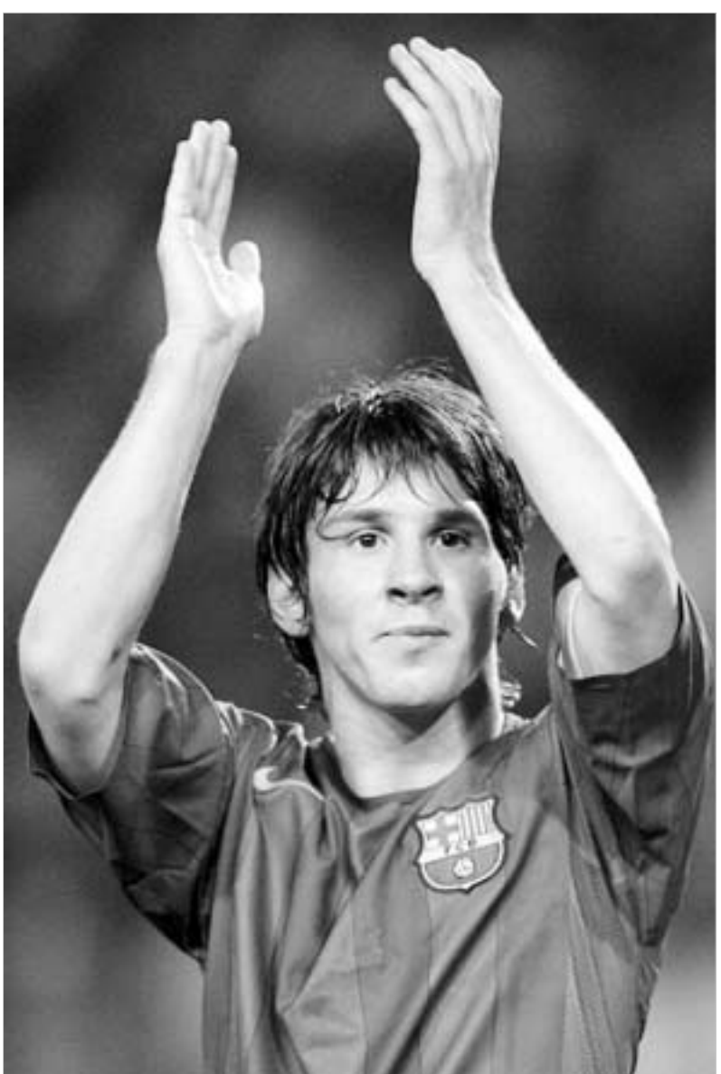
მესი წლევანდელი ლიგის აღმოჩენაა.

არის ხოლმე, როდესაც არსენ ვენგერის საკადრო ცვლილებები თავდაპირველად უჩვეულოდ, სა-