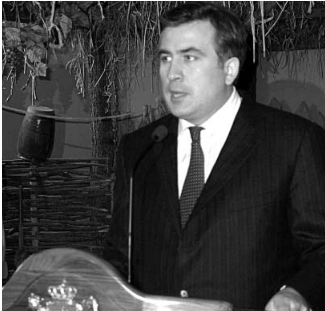
მიხეილ სააკაშვილმა რუსეთს კახეთიდან შეუტია.

ბ რძოლა კახეთიდან უცხადებს. მისი თქმით, რაც შაჰ აბასმა ქართულ ვაზს ვერ დააკლო, ამას რუსეთი ცდილობს. სწორედ ამის გამო, ქვეყნის პირველი პირი "თანამედროვე შაჰაბასებს" წინააღმდეგ ბრძოლას საერთაშორისო არენაზე აპირებს. პირველი ნაბიჯი გადადგმულია, ქართული ღვინის მწარმოებელი ასოციაციები "როსპორტენბაზორის" წინააღმდეგ სარჩელს ამზადებენ. მანამდე კი პრეზიდენტი მოსკოვში პრემიერ-მინისტრს გზავნის.